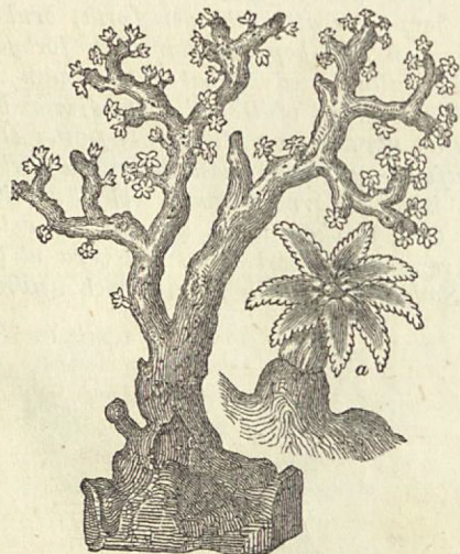
Korall med derpå sittande koralldjur. a. Ett sådant djur förstoraadt.

kring i hafvet. Märkligast äro likväl de polypdjur, som sitta djupt ner i hafvet fastvexta på greniga träd af kalk, hvilka djuren sjelfva bygga åt sig, allt efter som de förökas. Sådana stenträd kallas koraller . De finnas i synnerhet i de varmare delarne af jorden och stundom till så stor