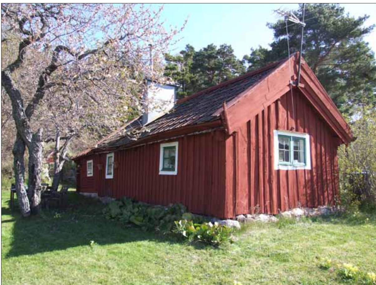
2 Hamnviksstugan från sydväst före åtgärder i maj 2012 (Slm D12-0484).

Sörmlands museum fick uppdraget att svara för antikvarisk medverkan vid arbetets genomförande. Arbetet har följts genom startmöte, platsbesök, samt en antikvarisk slutbesiktning den 16 maj 2012.