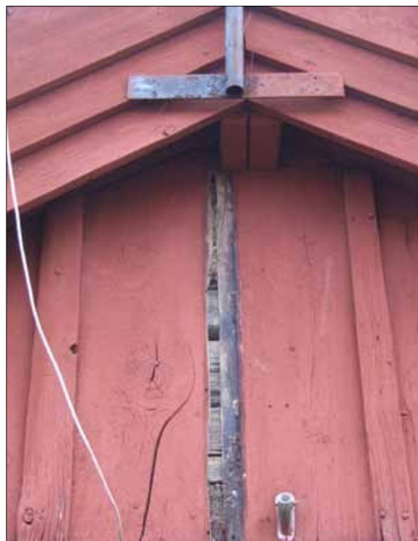
7 Locklisten på södra gaveln lyftes bort för att se om det under panelen möjligen fanns någon ingång/lucka till vind (Slm D12-0489).