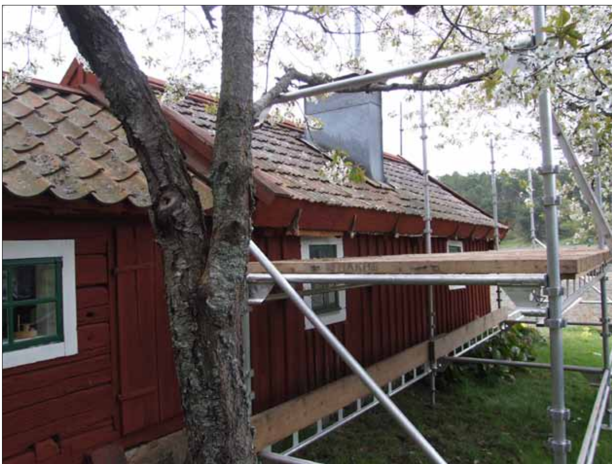
10 Hamnviksstugan efter lagning av mullbrädan (Slm D12-0492).