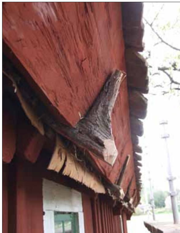
9 Nya "enekrokar" och ny mullbräda, efter åtgärder (Slm D12-0491).