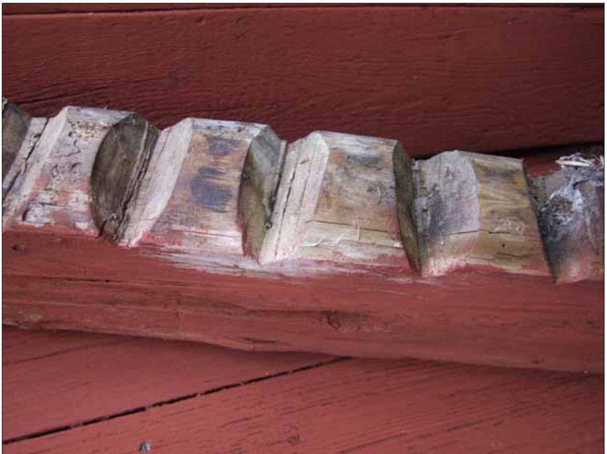
11 Detalj av den utbytta mullbrädan som nu sparades. Tandningen är huggen med yxa (Slm D12-0493).

Reparationsåtgärder vid Hamnviksstugan har utförts med antikvarisk medverkan och i samråd i enlighet med Länsstyrelsens beslut, daterat den 20 december 2011. Utförda arbeten godkänns härmed.