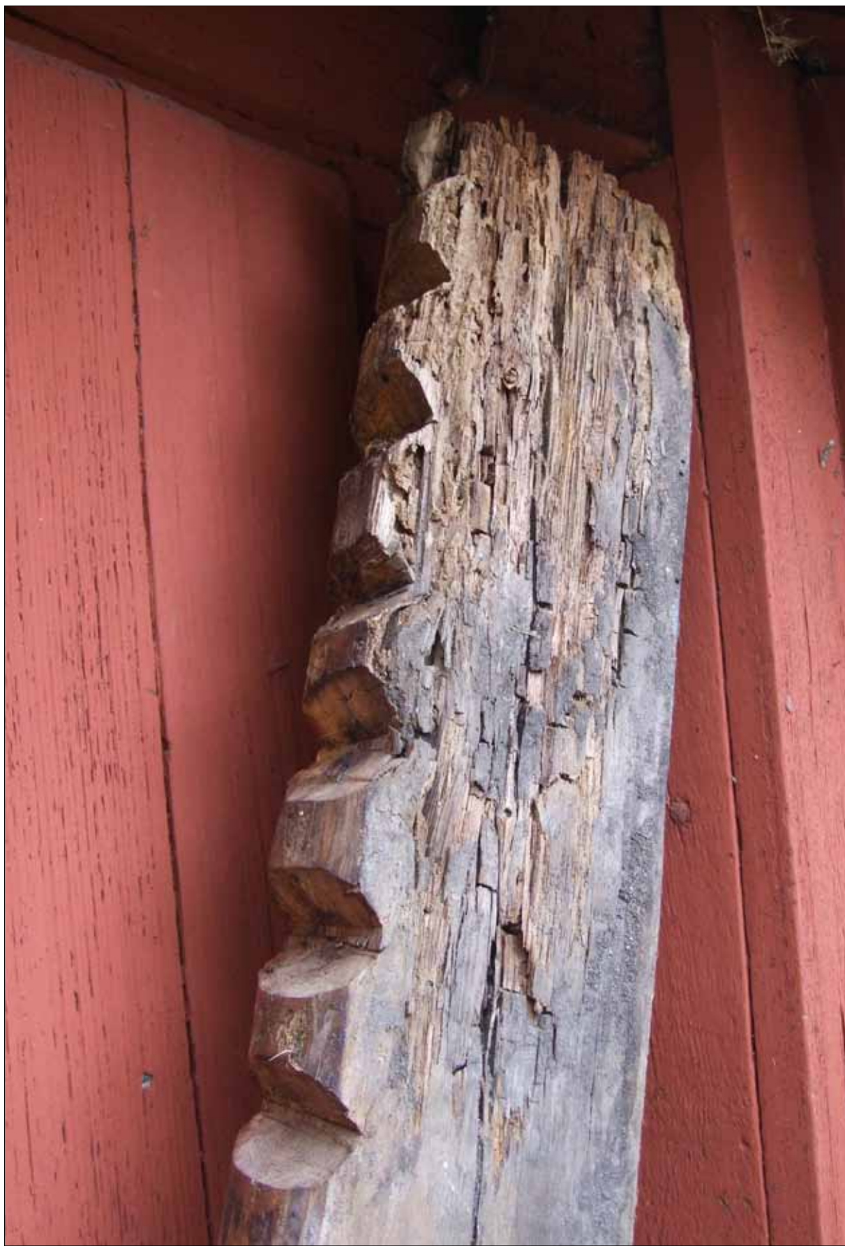
12 Detalj av den rötskadade delen av den befintliga mullbrädan som nu byttes ut (Slm D12-0494).