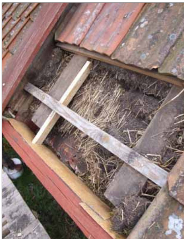
6 En läkt spikades på vissa rafter för att ge stöd åt mullbrädan (Slm D12-0488).

Vid denna renovering lyftes endast de tre nedersta tegelraderna. Under tegeltaket syntes både torvlager och råghalmsstrån. Underst låg flera lager med näver. Inga uppgifter har hittats om stugans ålder och tidigare utseende. Taket bör dock tidigare ha varit täckt med torv. Ett besiktningsinstrument över byggnader som tillhör ”Igelprång” år 1856, visar att flera byggnader i närheten var täckta med både torv och halm. Inga stämplor kunde noteras på tegelpannorna.