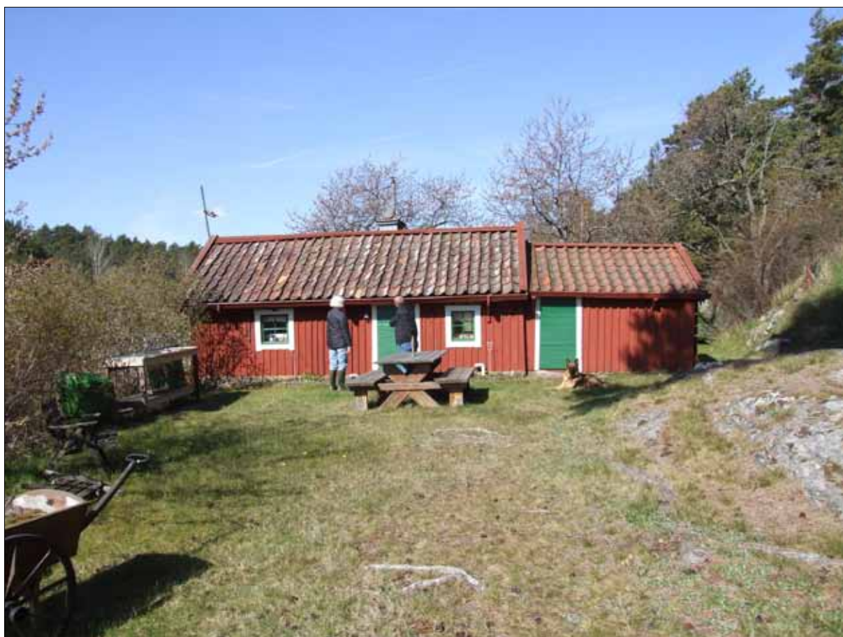
3 Hamnviksstugan sedd från öster i maj 2012 (Slm D12-0485).

Byggnadens taklag har inte kunnat besiktigas underifrån, eftersom ingång till eventuell krypvind saknas. Taket bärs upp av åsar. Taket är täckt med enkupigt lertegel, förutom enkelstugans västra takfall som täcks med trekupigt lertegel. Som tätskikt ligger flera lager med näver. Ovanpå nävern ligger torv och lös halm. På torven ligger kraftiga rafter, ca 100x50 mm. Bärläkten är ca 40x25 mm.