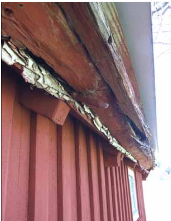
8 Mullbrädan med trasiga "enekrokar" som nu byttes ut (Slm D12-0490).