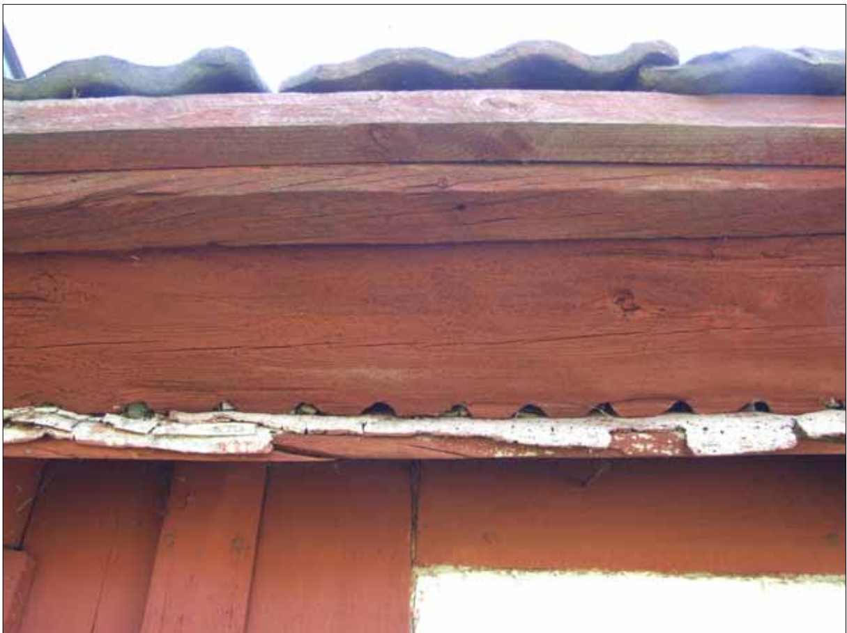
4 Detalj av enkelstugans västra mullbräda före åtgärd. Ovanpå mullbrädan var en regel och en läkt påspikad för att få plats med takteglet ovanpå torven. (Sim D12-0486).