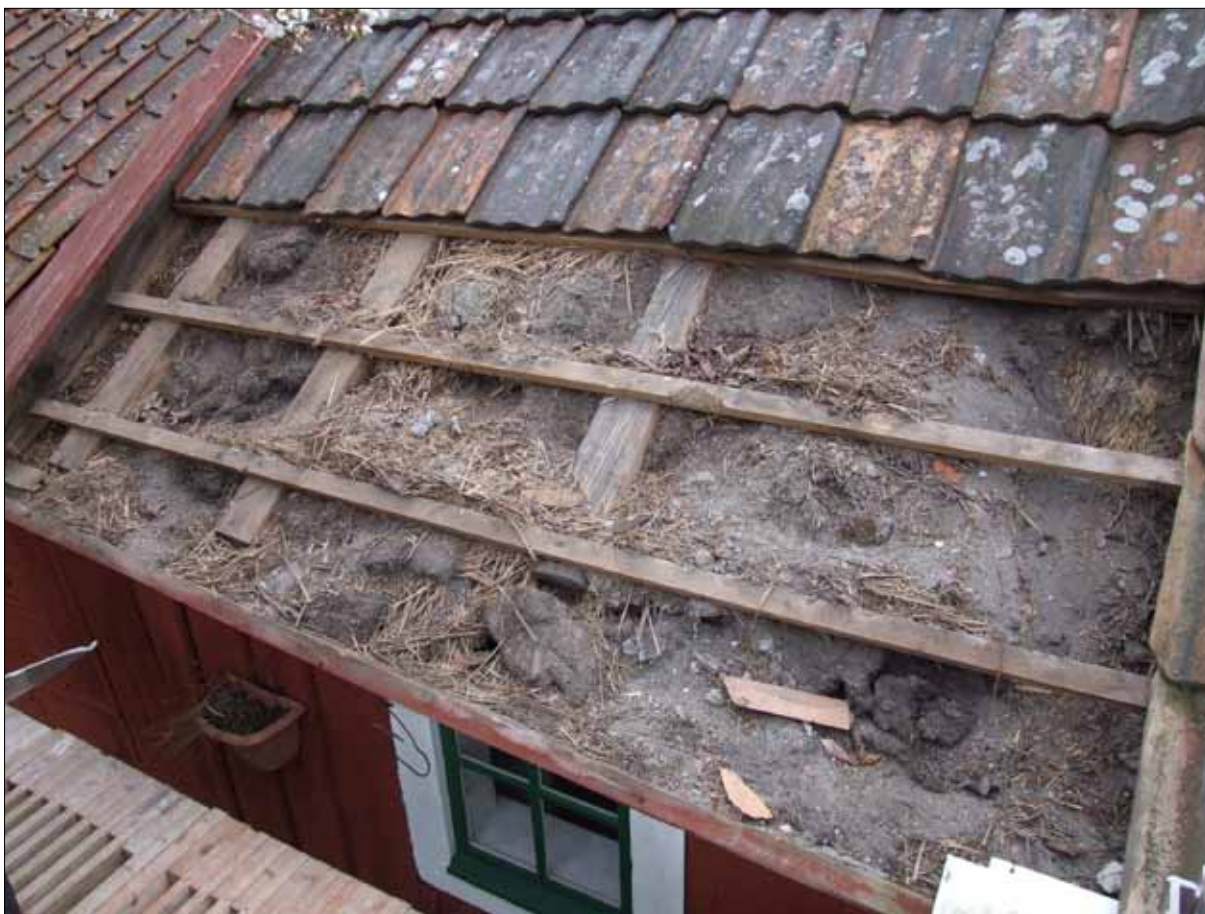
5 Under takteglet ligger torv, men även lös halm (Slm D12-0487).

De tre nedersta tegelraderna lyftes bort. Äldre torv- och halmlager togs bort ned till de underliggande näverlagren. Den nya mullbrädan gjordes ca 10 cm högre än befintlig (för att få en stadigare konstruktion och för att inte behöva spika dit extra regel och läkt). Den nya mullbräda utfördes också utan ”tandning”. Ny läkt skarvades på rafterna för att ge stöd åt den nya mullbrädan. Nedersta bärläkten byttes ut mot en