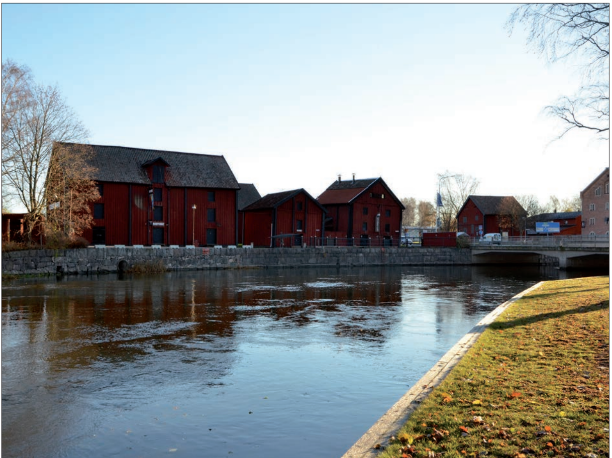
2 Restaurang Rökeriet är inredd i ett 1700-talsmagasin vid Skeppsbron på den östra sidan av Nyköpingsån (Slm D12-0743).

I enlighet med länsstyrelsens beslut skulle samtliga arbeten utföras under antikvarisk medverkan och dokumentation.