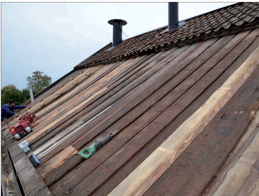
12 Det norra takfallet från nordväst vid pågående utbyte av rötskadad panel (Slm D12-0749).