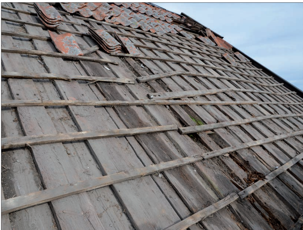
10 Rötskador på södra takfallets underlagstak (Slm D12-0747).