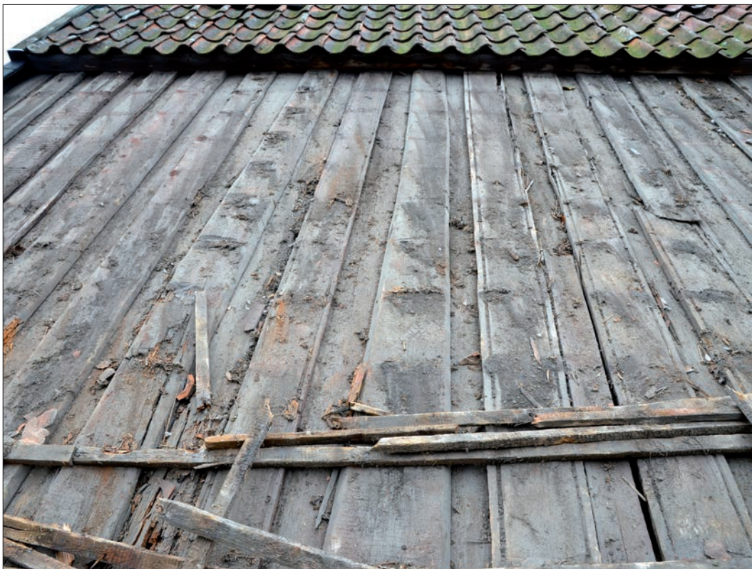
15 Vattspår på det norra takfallets lockpanel (Slm D12-0752).