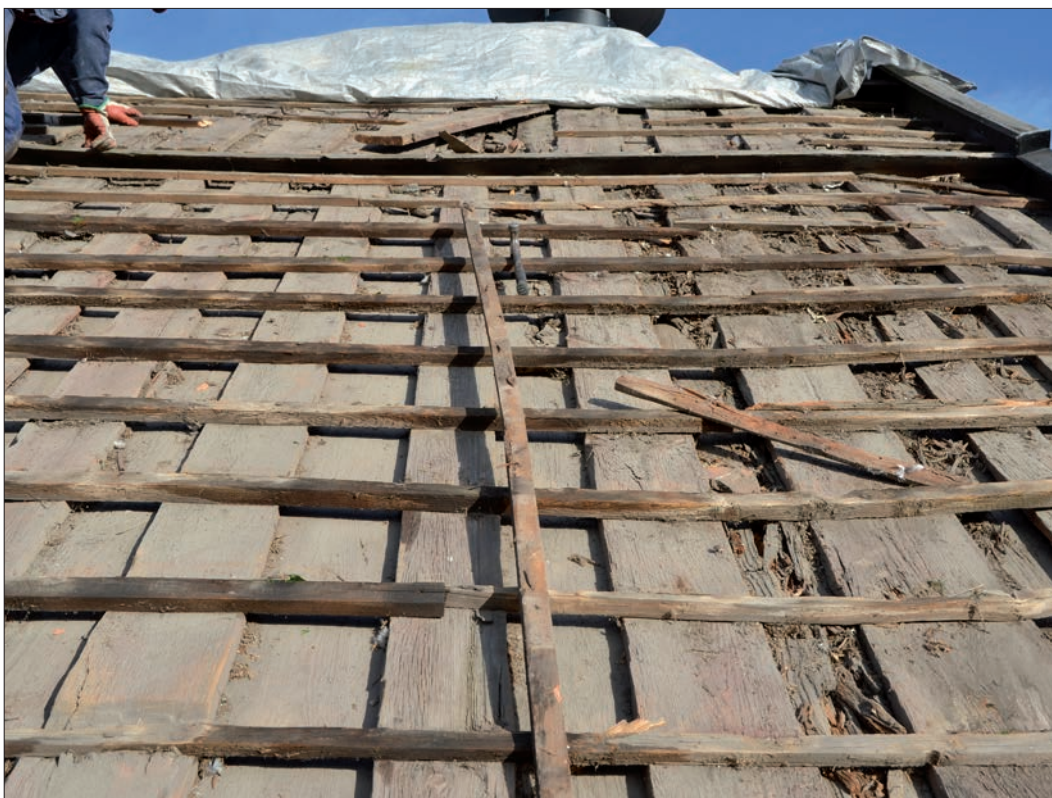
9 I bildens övre del ses den längsgående bräda som markerar övergången mellan takfallens övre och nedre delar (Slm D12-0746).