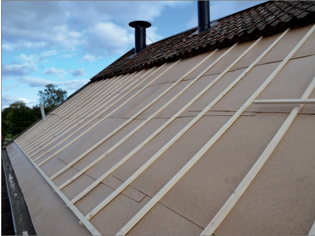
13 Masonit och ny strörläkt har monterats på det norra takfallet (Slm D12-0750).