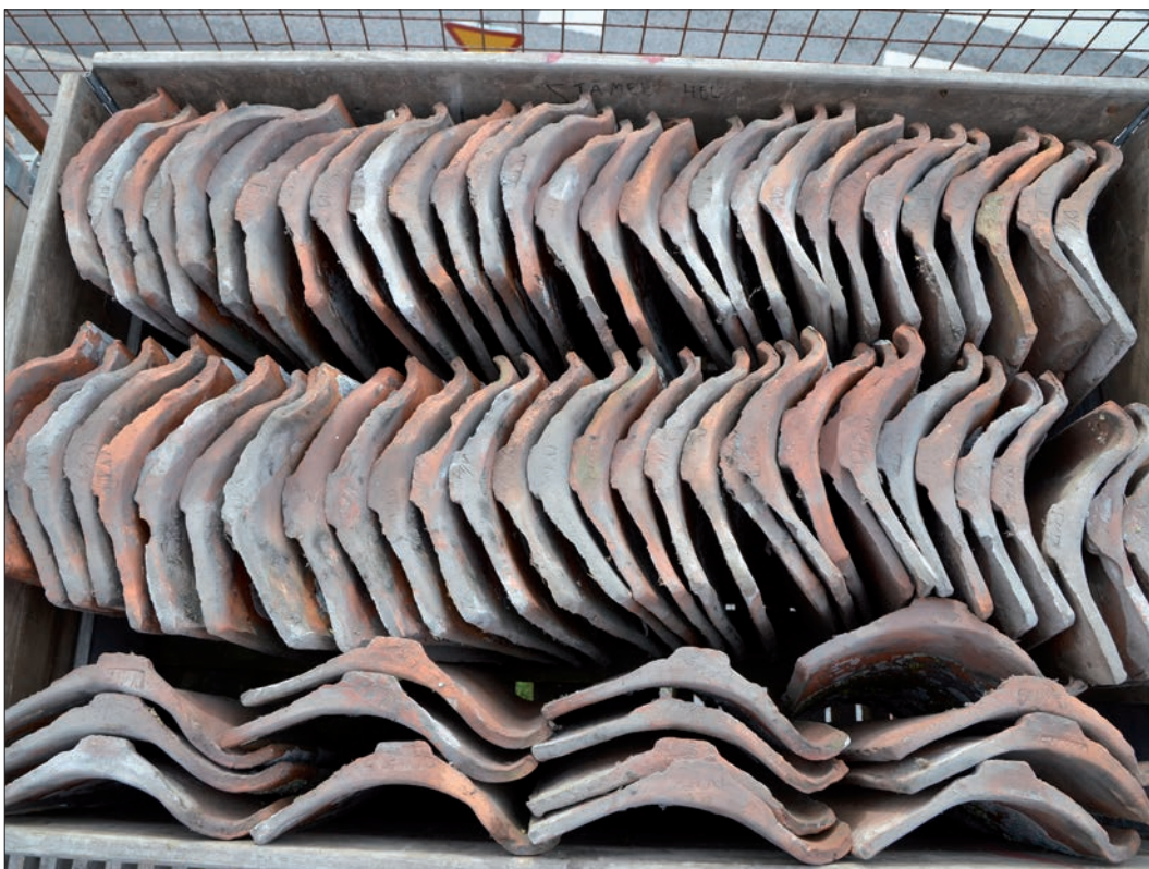
16 Pallkrage med taktegel från Kalkuddens tegelbruk (Slm D12-0753).