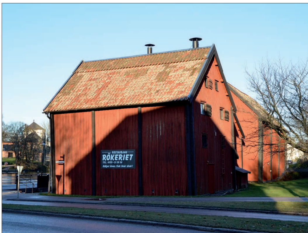
8 Rökeriet från sydost efter avslutat arbete (Slm D12-0745).