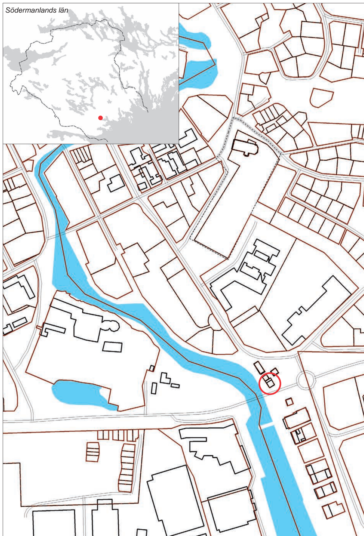
1 Läget för Rökeriet markerat med röd cirkel. Utsnitt ur Fastighetskartan för Nyköping. Skala 1:4 000.