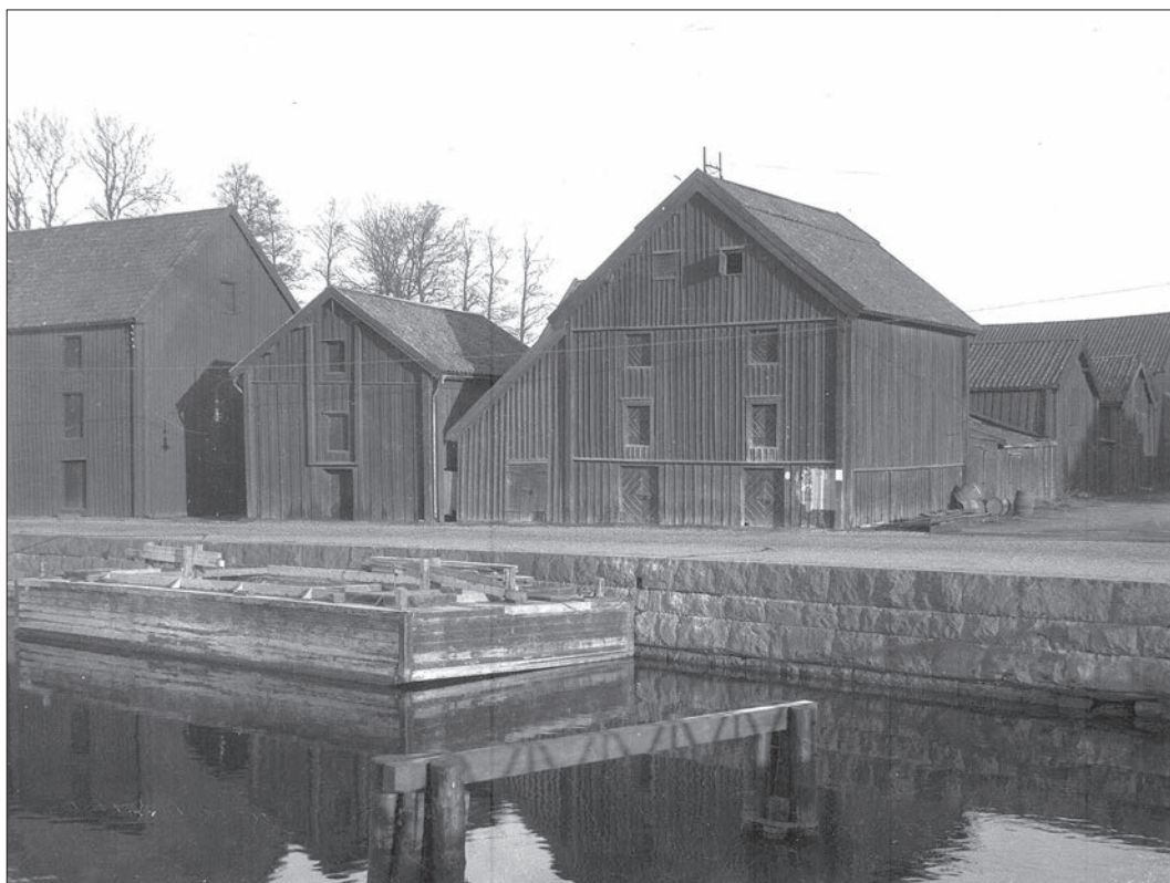
4 På bilden, som troligen är tagen under perioden 1922-1935, börjar tillbyggnadens pulpettak vid nuvarande Rökeriets norra takfall.