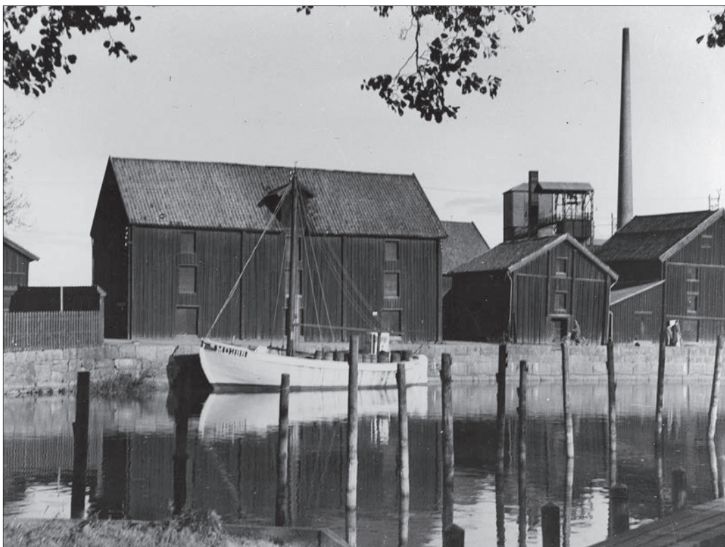
5 På bilden, som troligen är tagen under perioden 1935-1961, är tillbyggnaden lägre än på bilden ovan. bilden är något beskuren.