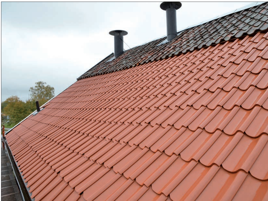
14 Nytt enkupigt taktegel från Vittinge tegelbruk på det norra takfallets nedre del (Slm D12-0751).