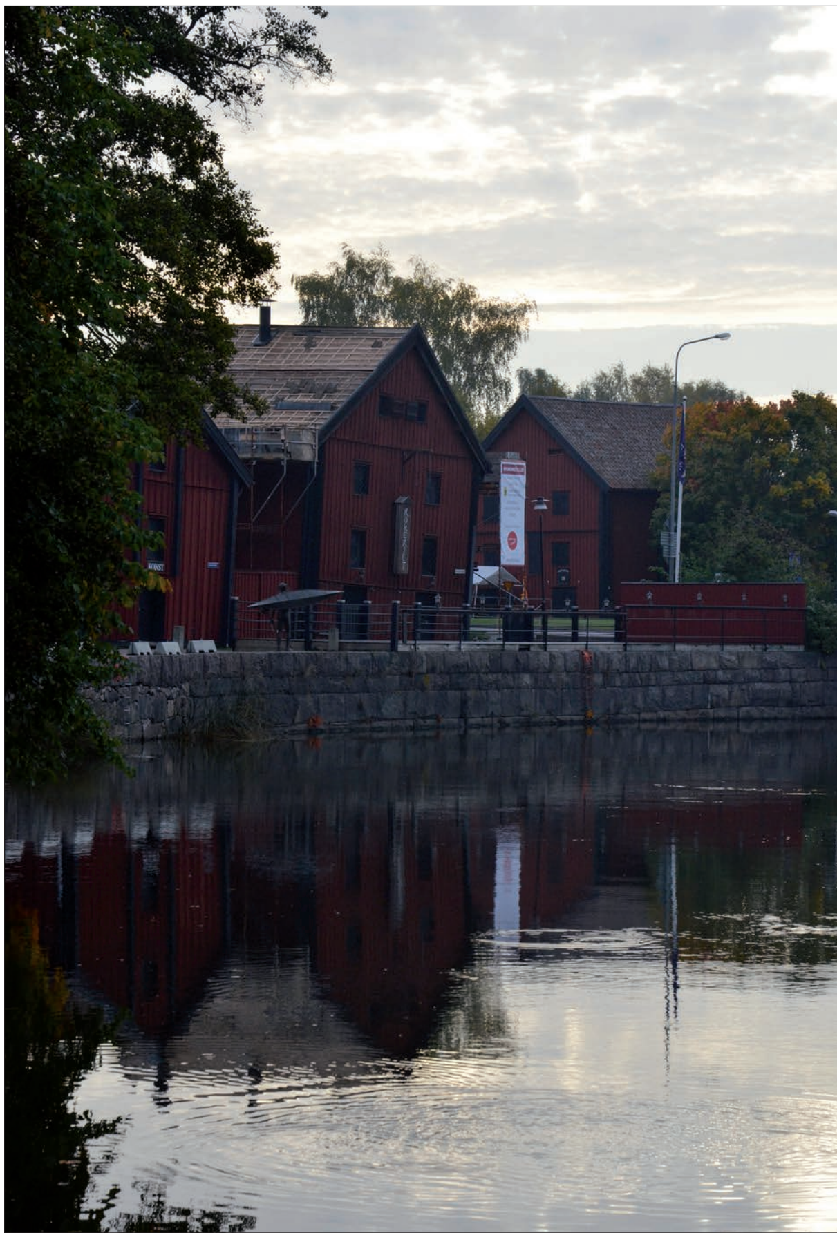
17 Rökeryt från nordväst i samband med pågående arbeten (Slm D12-0754).