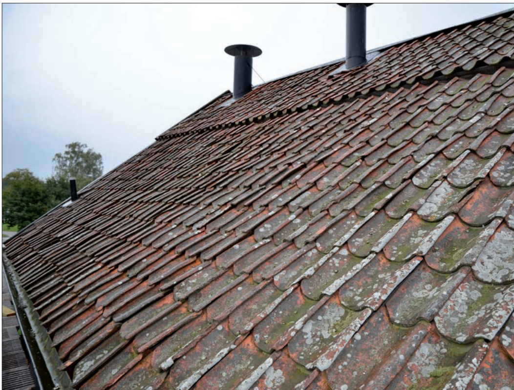
11 Det norra takfallet från nordväst innan arbetena påbörjades (Slm D12-0748).