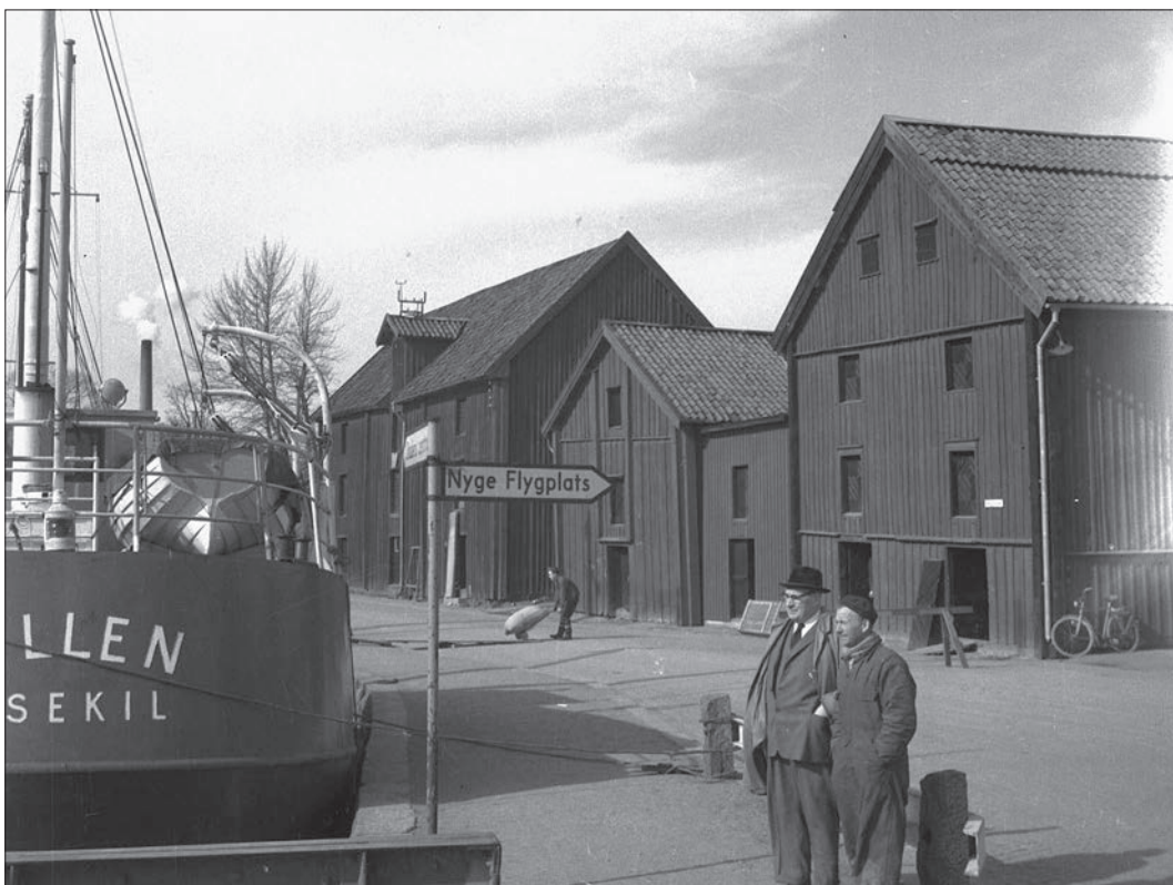
6 På bilden, som är tagen 1962, framgår det att norra delen av tillbyggnadens fasad har höjts till nivå med anslutande magasins takfall. bilden är något beskuren.