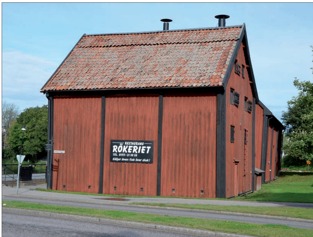
7 Rökeriet från sydost innan arbetet påbörjades (Slm D12-0744).