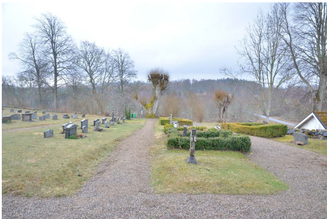
Bild 15. Gång nr 1 (höger) ska enligt förslaget behållas medan gång nr 2 (mitt i bild) avses läggas igen. SLM D2023-0382.

Genom att lägga igen gångarna vill församlingen dels tillskapa större marginaler för grävningen med grävmaskin och således minska risken för skador på befintliga gravar, och dels underlätta den regelbundna skötseln av kyrkogården.