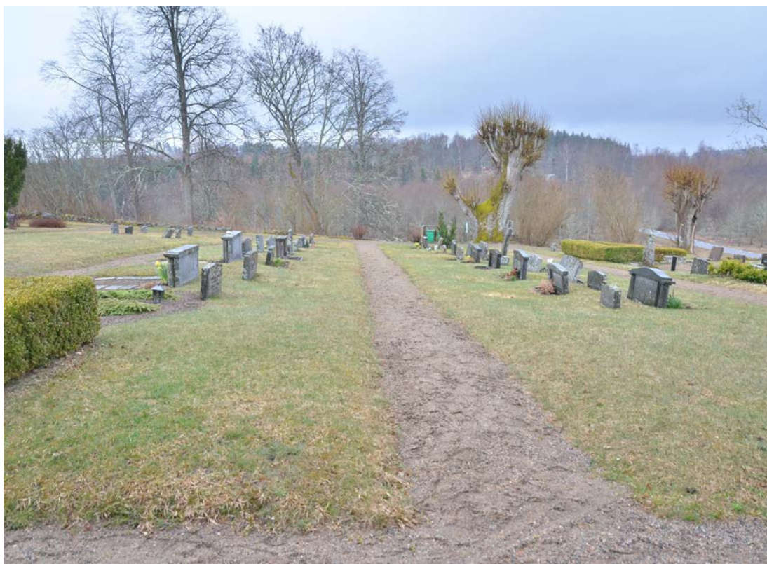
Bild 16. Gång nr 3 som avses läggas igen. Vy mot söder.