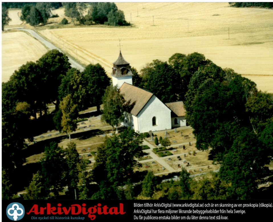
Bild 12. Flygfoto från 1983 som hämtats från ArkivDigital.