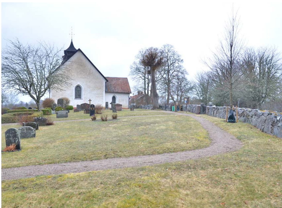
Bild 25. Norra delen av gång nr 10 som avses läggas igen. Vy mot väster. SLM D2023-0375.