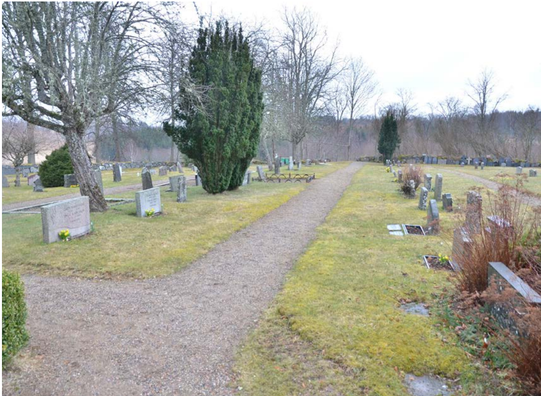
Bild 22. Gång nr 8 som är något bredare och därför avses behållas. Vy mot söder. Kvarteret mellan gångarna 8 och 9 utgjorde den tidigare trädkransen innan kyrkogården utvidgades 1914. SLM D2023-0389.