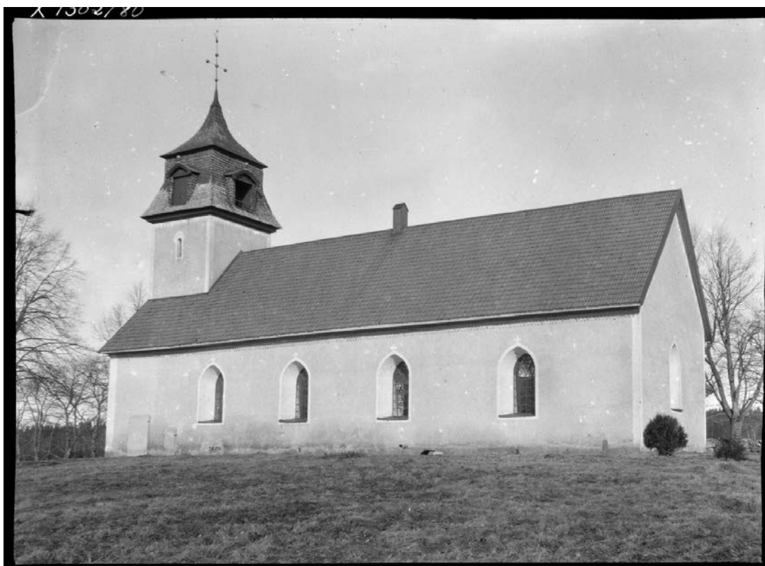
Bild 9. Kyrkogårdsdelen rakt söder om kyrkan (nuvarande kvarter A) utan vare sig grusgångar eller gravar. Foto: Ivar Nilsson, 1922. SLM X1302-80