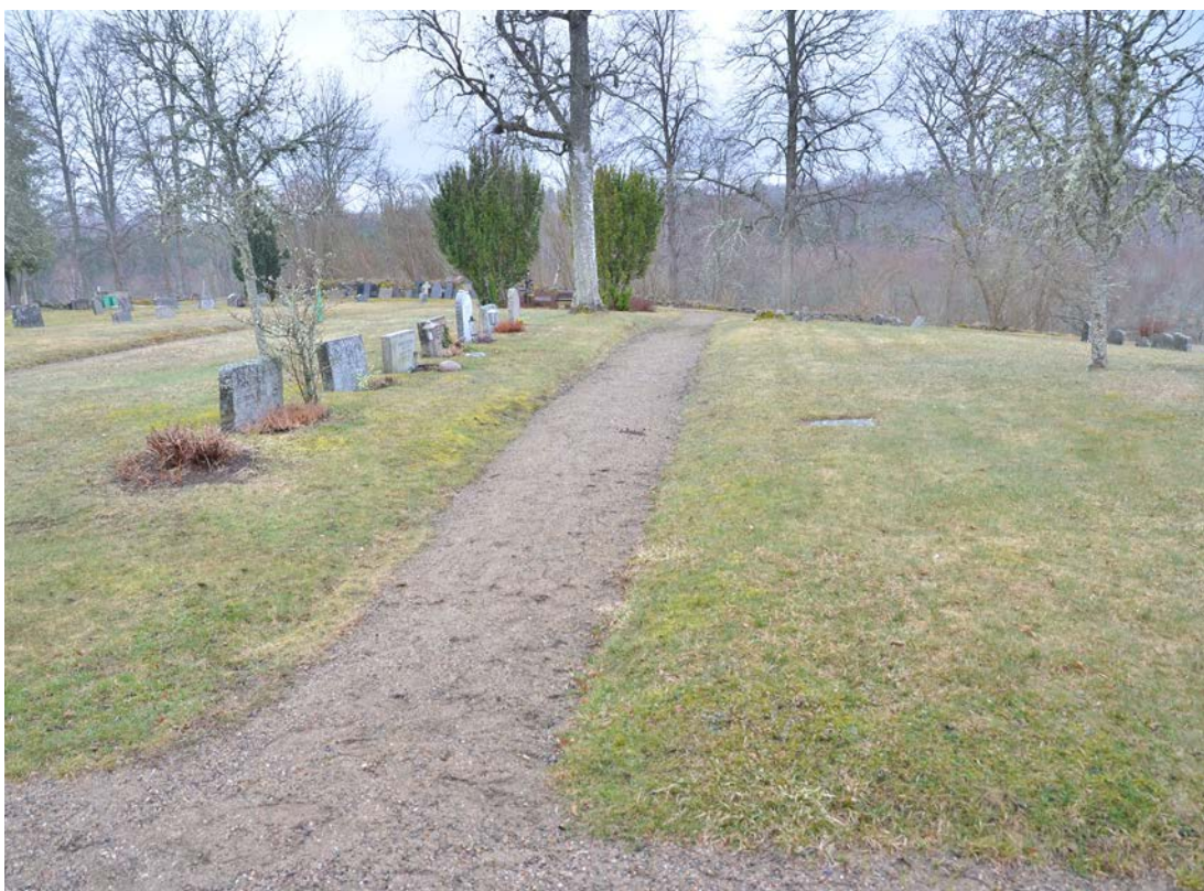
Bild 19. Gång nr 5 som avses behållas. Vy mot söder. Minneslunden syns vid de två gröna idegranarna. SLM D2023-0386.