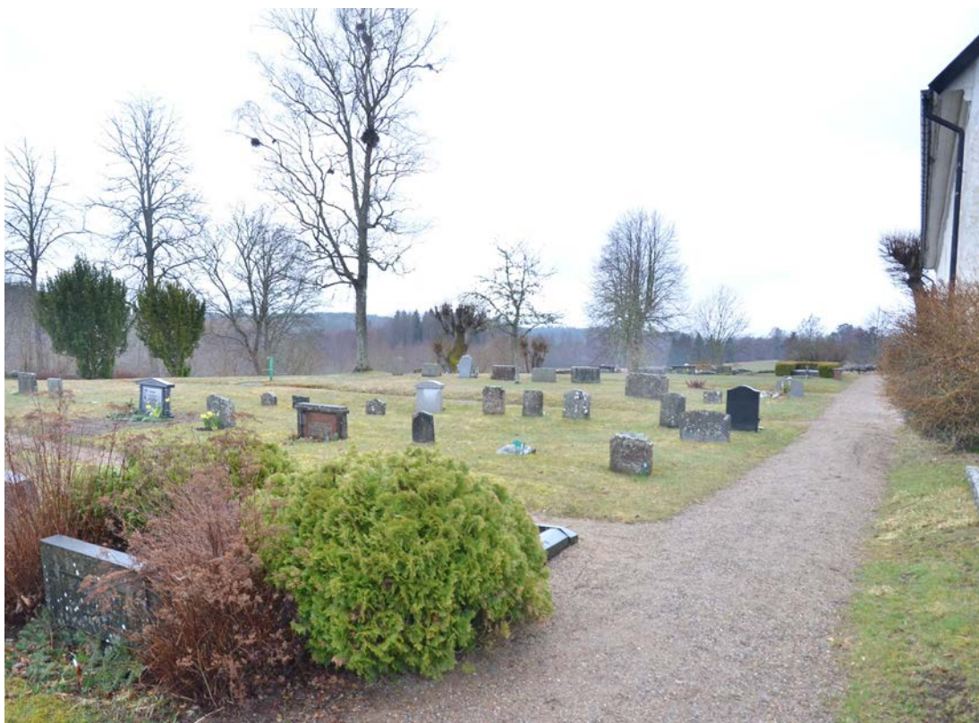
Bild 4. Kyrkogårdens västra del, vy mot väster. Bakom tujabusken börjar gång nr. 7.