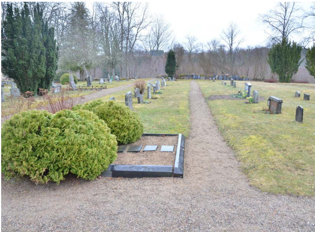
Bild 21. Gång nr 7 som avses läggas igen. I bildens övre vänstra del syns gång nr 8, som avses behållas grustäckt. Vy mot söder. Höger om gång nr 7 syns en nygrävd grav vars nedre kant gränsar precis till gången - en tydlig illustration av det problem som församlingen framför som huvudskäl till åtgärden. SLM D2023-0388.