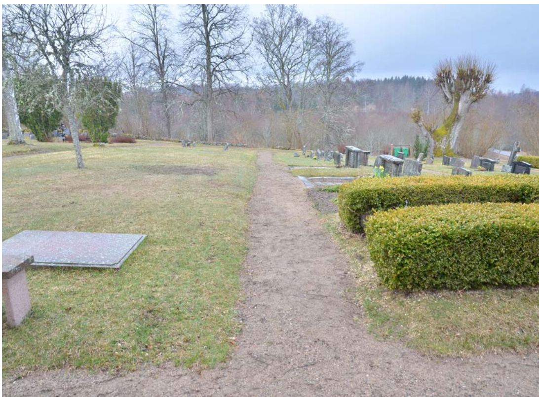
Bild 18. Gång nr 4 som avses läggas igen. SLM D2023-0385.