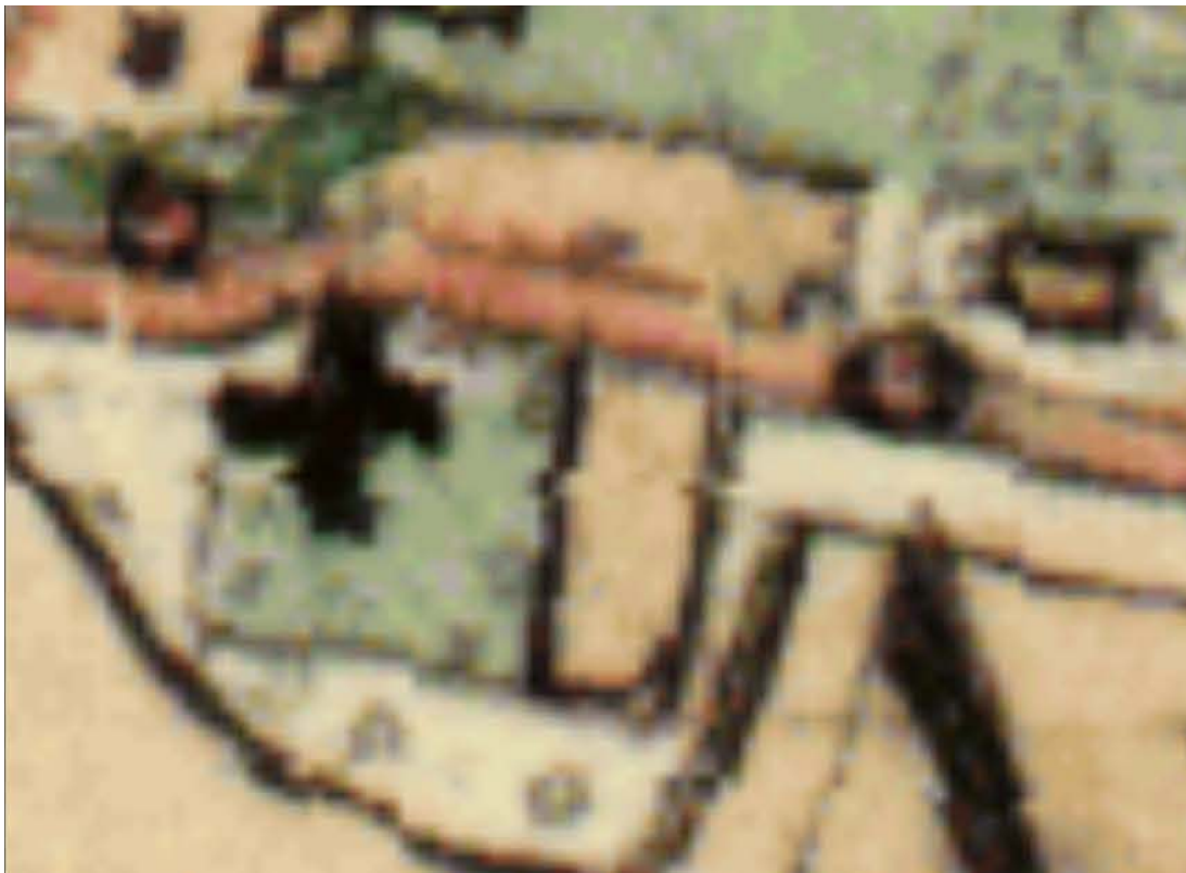
Bild 7. Årdala kyrka och kyrkogård på häradsekonomska kartan, ca 1890-1900. Bilden visar tydligt den ursprungliga delen av kyrkogården (i grönt) och den del till höger (öster) som införlivades med den äldre delen 1914.