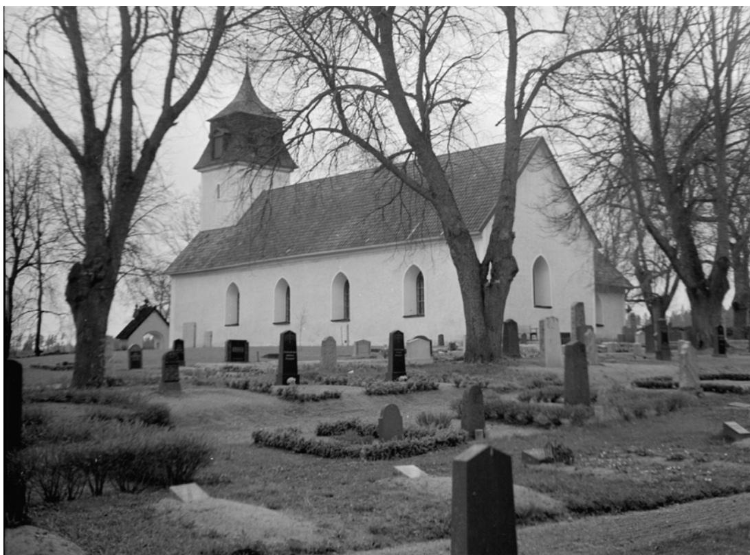
Bild 10. Kyrkogården (kvarter B) 1944. SLM M014870