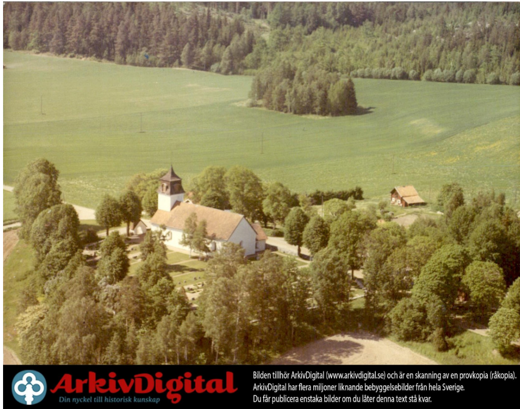
Bild 11. Flygfoto från 1973 som.