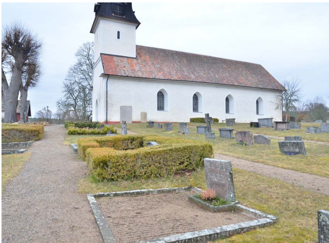
Bild 3. Kyrkogårdens västra de med gångarna 1 och 2. Vy mot norr.