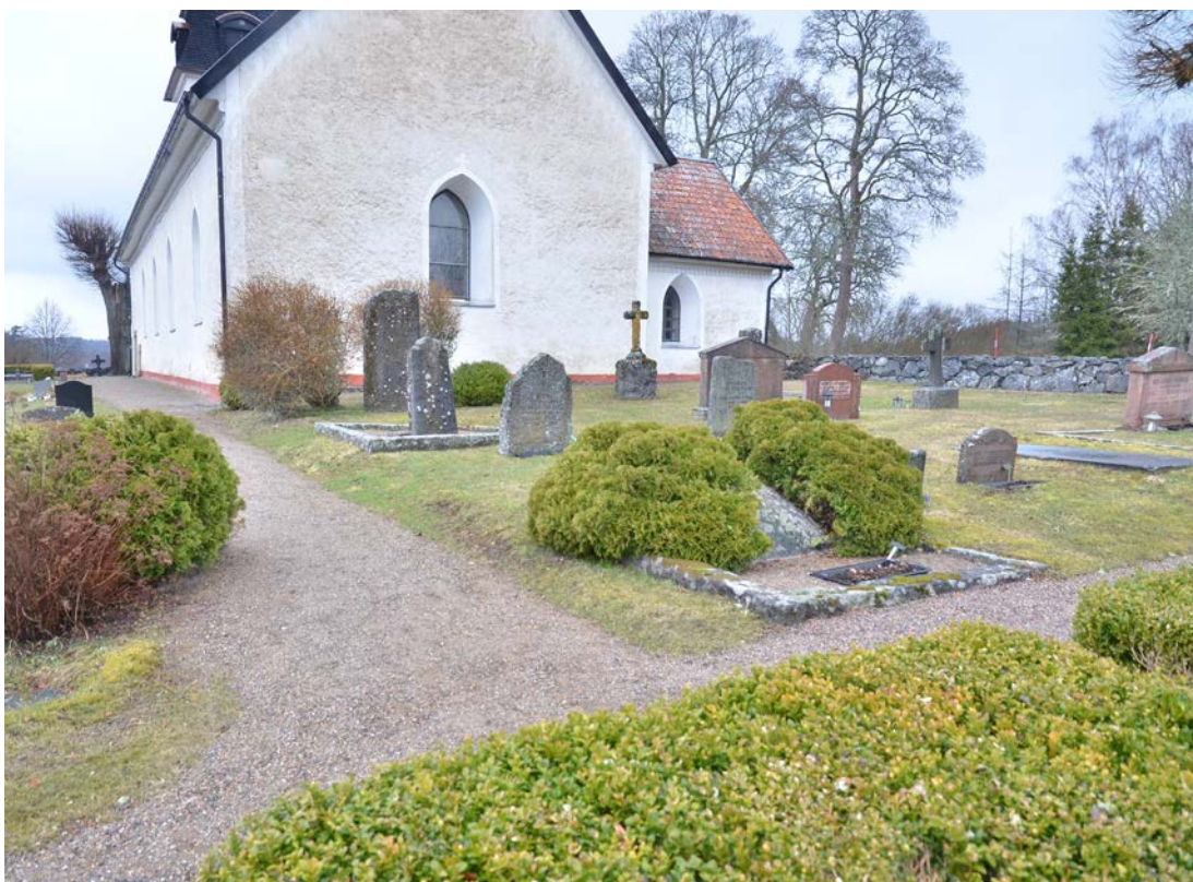
Bild 6. Kyrkogårdens nordöstra del.