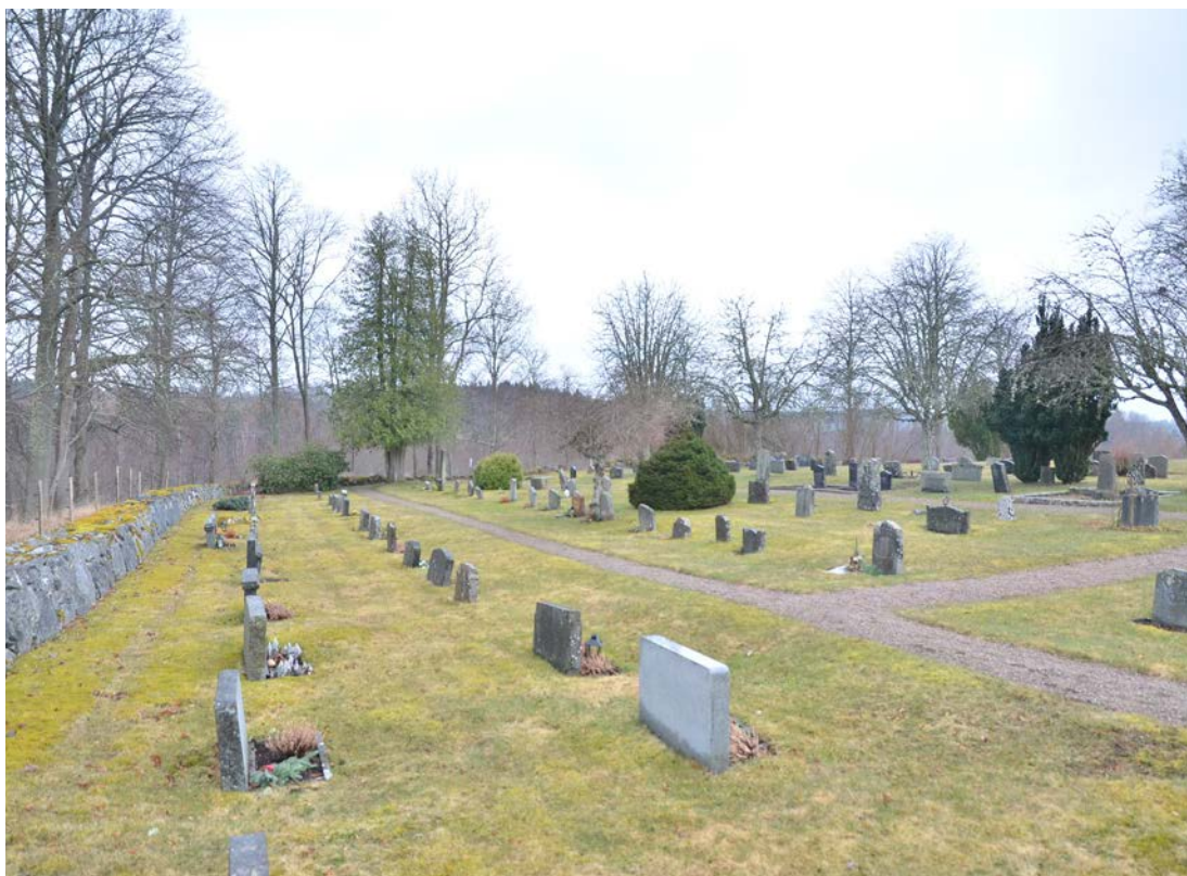
Bild 24. Södra delen av gång nr 10 som avses läggas igen. Vy mot söder. SLM D2023-0391.