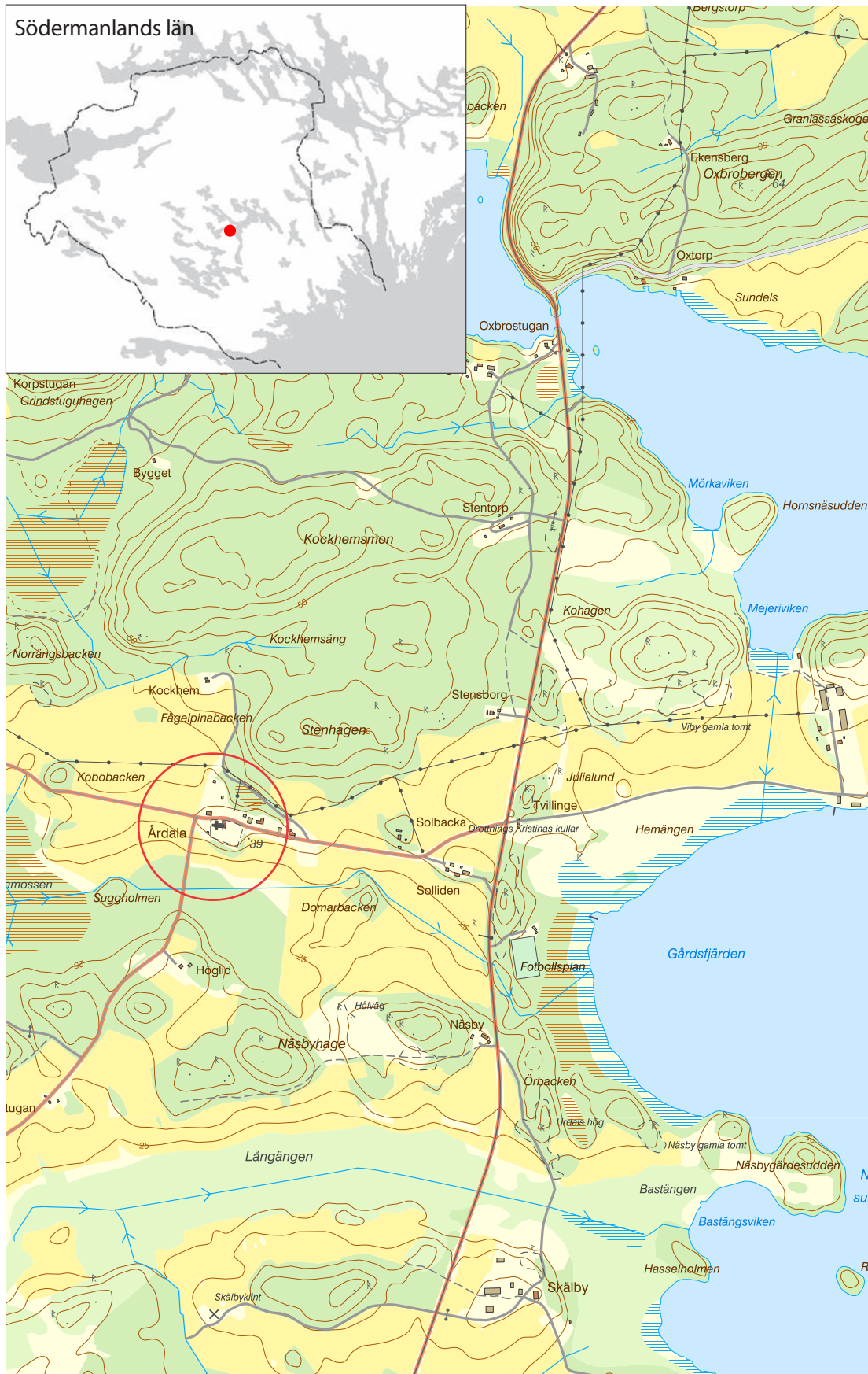
Årdala kyrka öster om Båven mitt i Södermanland. Kartan är hämtad från Lantmäteriets webbtjänst Kartutskrift.