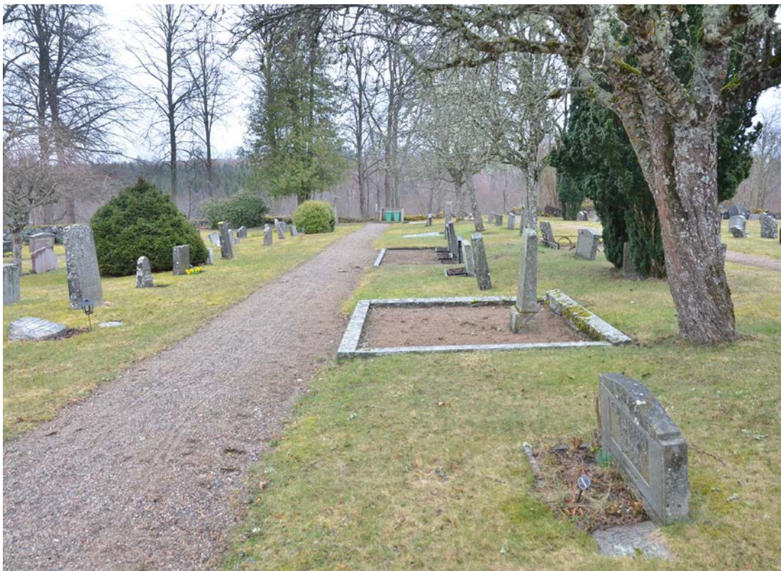
Bild 23. Gång nr 9 som avses behållas. SLM D2023-0390.