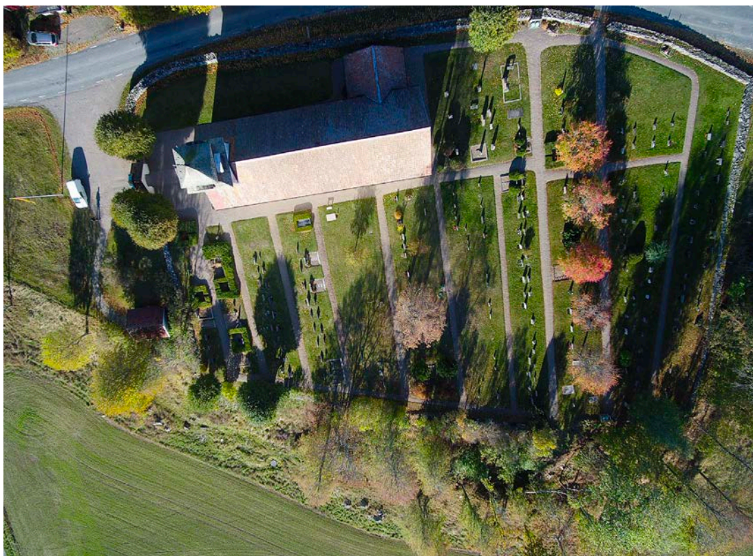
Bild 1. Drönar fotografi taget hösten 2021.