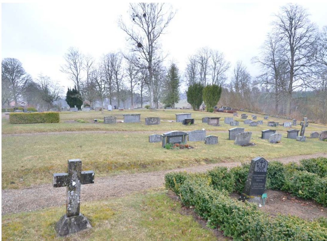
Bild 2. Kyrkogården, vy mot sydost. I förgrunden syns gång nr. 2. SLM D2023-0377.