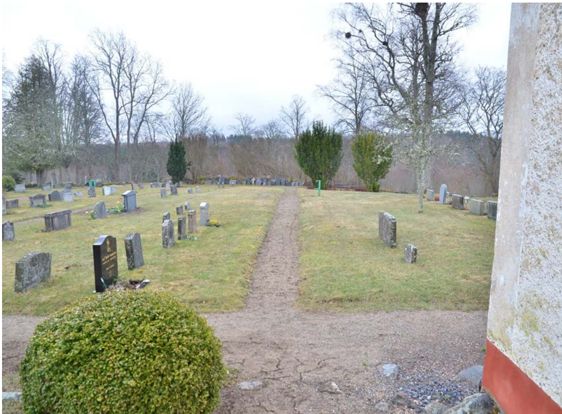
Bild 20. Gång nr 6 som avses läggas igen. Vy mot söder. SLM D2023-0387.