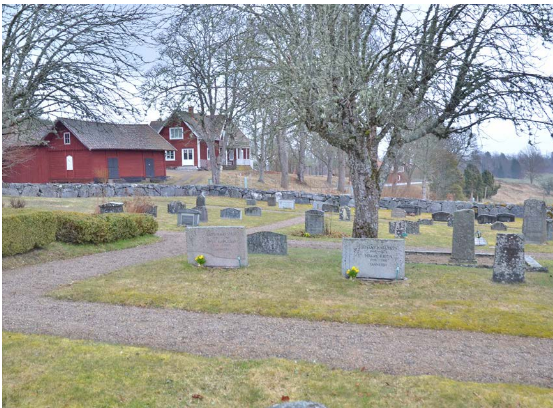
Bild 5. Kyrkogårdens östra utvidgade del.