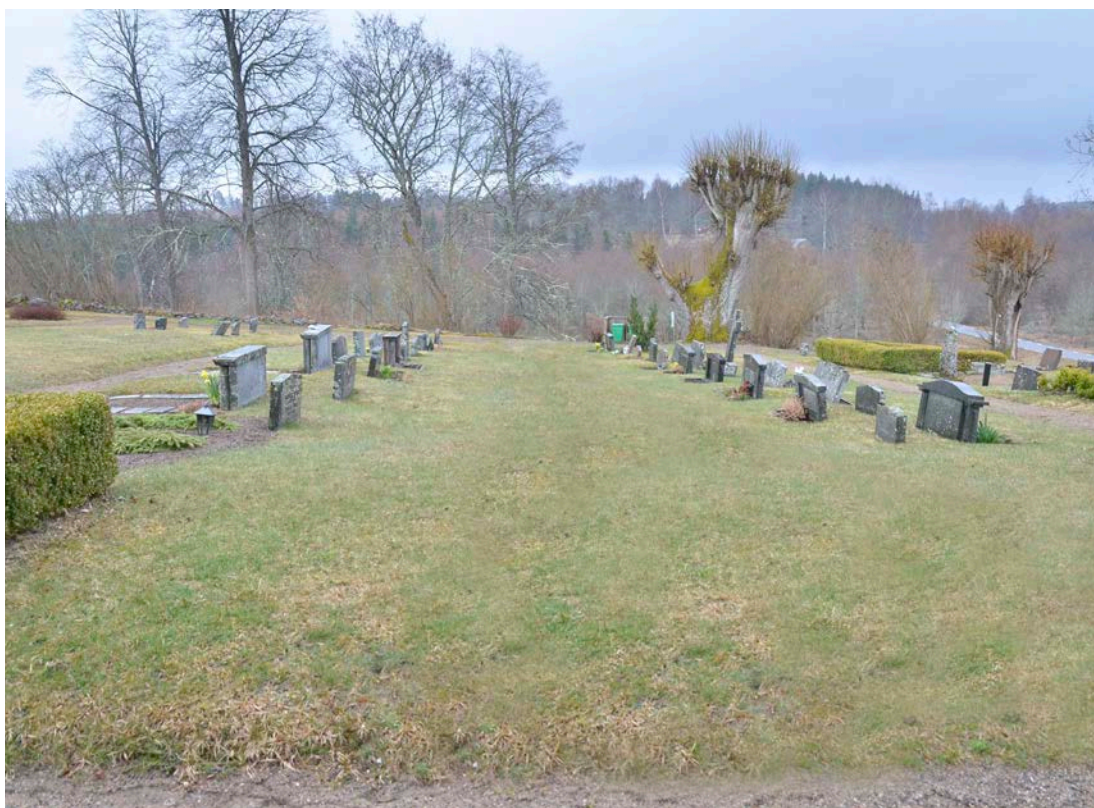
Bild 17. Bilden ovan är densamma som föregående (bild 16), men har ändrats i bildredigeringsprogram för att visa hur kvarteret (A) skulle kunna se ut efter att gången lagts igen och sätts med gräs. SLM D2023-0384.