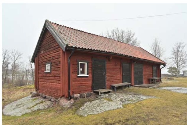
Bild 51. Norra ekonomibyggnaden från sydväst. De ospröjsade fönstren passar dåligt in i den äldre karaktären.