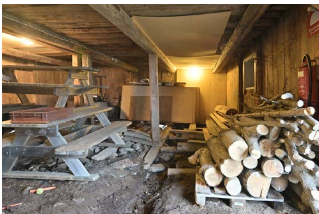
Bild 66. Den lägre delens oinredda del sett mot väster.