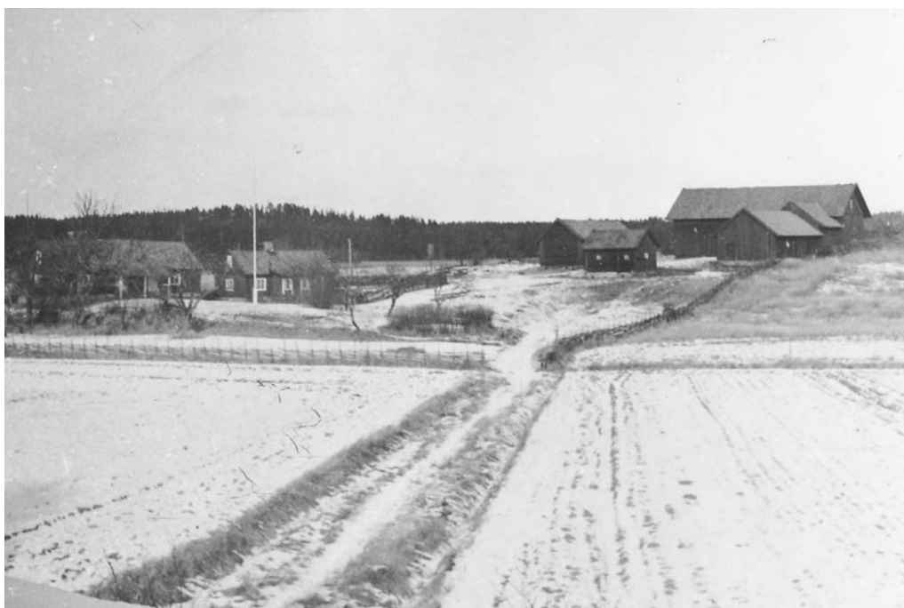
Bild 12. Foto av hela gården taget 1949. Här syns den stora ekonomibyggnaden som brann 1954. Denna var sammanbyggd med den södra ekonomibyggnaden. (Neg. nr. A11-545)