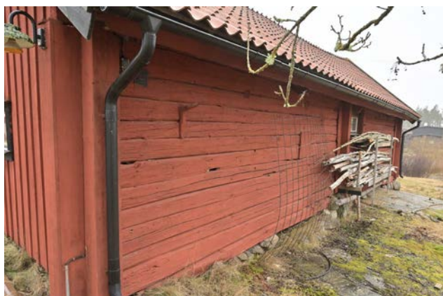
Bild 54. Norra ekonomibyggnadens norra vägg sett österifrån.