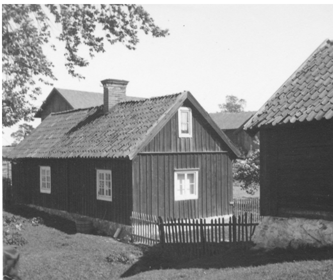
Bild 5. Lilla bostadshuset fotograferat från nordväst 1939. Byggnaden har i stort sett samma utseende än idag. Notera den oputsade skorstenen, vindsvåningens gavelfönster med en tvärgående spröjs och vindskivorna som är rödfärgade. Intressant att se är också staketet mellan stora och lilla bostadshuset. Djuren gick tidigare och betade alldeles norr om husen. Foto: Ivar Nilsson. (SLM MO15784)