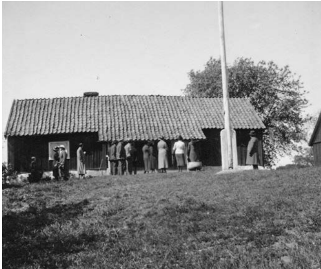
Bild 3. Foto av stora bostadshuset vid Edanö sett från söder. Foto: Ivar Nilsson 1939. (SLM MO15789)