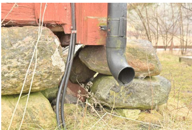
Bild 60. Grundstenarna vid det nordvästra hörnet på södra ekonomibyggnaden har flyttat sig och riskerar att trilla ut.