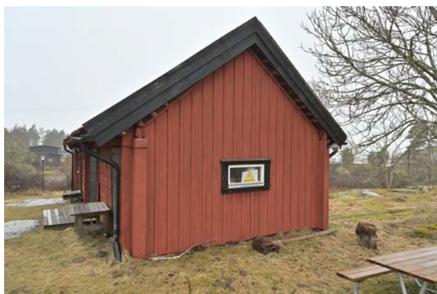
Bild 53. Norra ekonomibyggnadens östra gavel. (SLM D2024-0277)