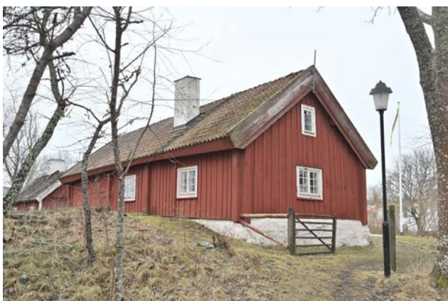
Bild 22. Stora bostadshuset sett från nordväst. Notera de kraftiga vindskivorna som är ett resultat av att taket riktades vid den senaste omläggningen.