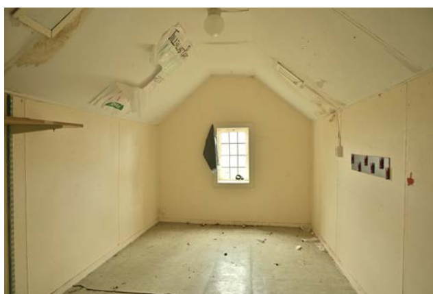
Bild 32. Det västra gavelrummet.