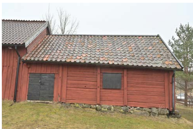
Bild 58. Den lägre delen på den södra ekonomibyggnaden.