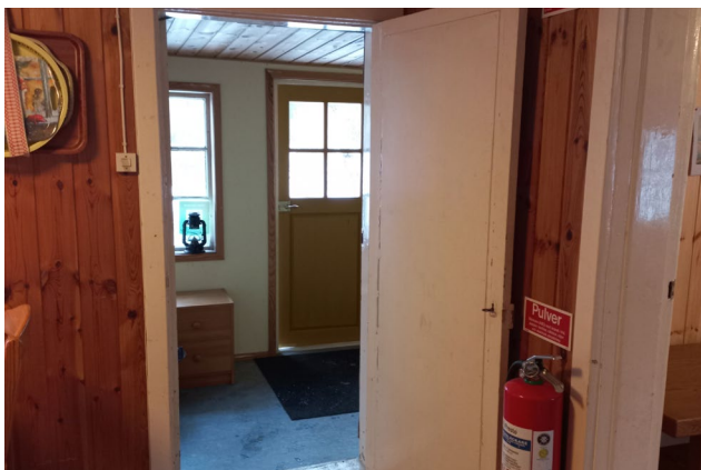
Bild 46. Bild av farstun i lilla bostadshuset fotograferad från köket.