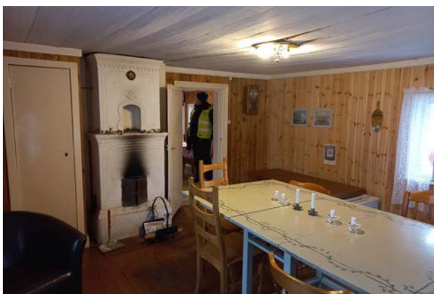
Bild 44. Bild av stugan mot öster.