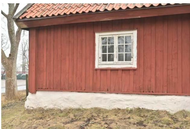
Bild 16. Stora bostadshusets södra fasad, med mindre skadade partier i panelens nederkant. (SLM D2024-0240)