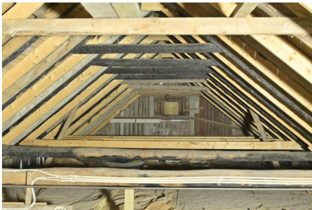
Bild 69. Vinden över den högre delen av södra ekonomibyggnaden sett mot öster. Notera de brandskadade takstolarna som idag är kompletterade med nya takstolar.