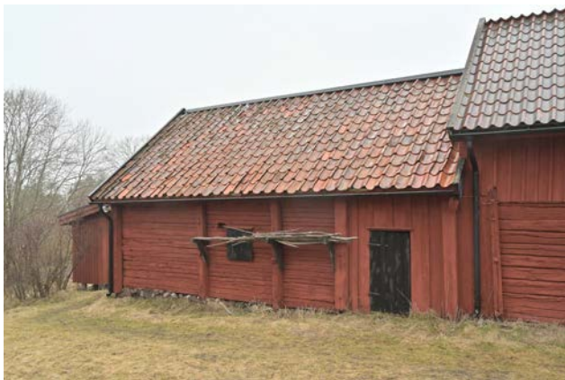
Bild 65. Södra ekonomibyggningens södra del sett från söder. (SLM D2024-0289)