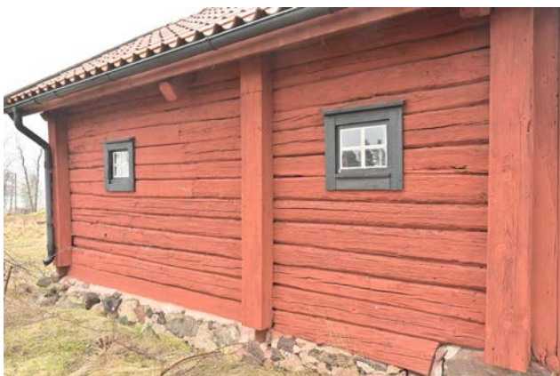
Bild 74. Uthusets västra fasad.