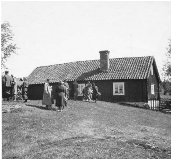
Bild 10. Foto av stora bostadshuset från norr 1939. Här syns den välbetade marken närmast husen i norr. Notera fönstren som ännu har kvar sin tidigare rutindelning, med en tvärgående spröjs. Foto: Ivar Nilsson 1939. (SLM MO15790)