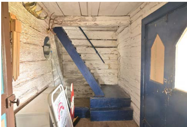
Bild 24. Stora bostadshusets farstu. Trappan till andra våningen har tidigare varit omålad.