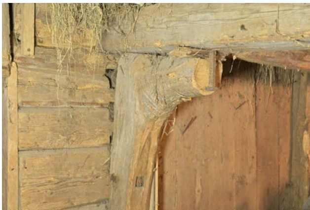
Bild 68. Konsol bestående av ett naturligt vinkelknän, vilket ser ut att ha kapats i änden.