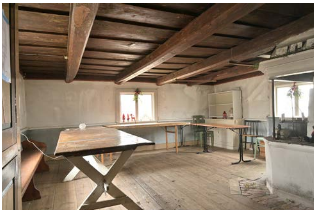
Bild 26. Bild av stugan med det västra gavelfönstret i mitten av bilden. (SLM D2024-0250)