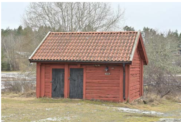
Bild 71. Uthuset sett från öster.