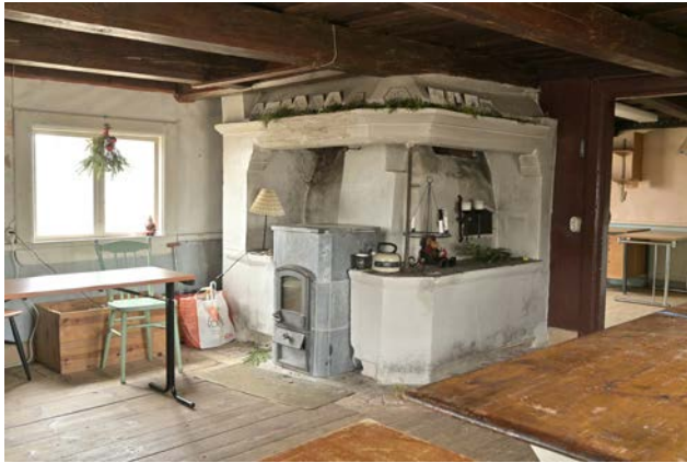
Bild 27. Stugans öppna spis med den relativt nyligen insatta täljstenskaminen. (SLM D2024-0251)