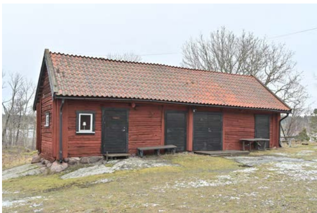
Bild 47. Norra ekonomibyggnaden från söder.