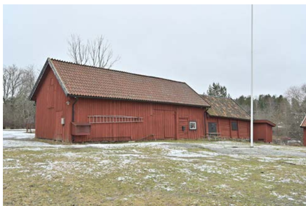
Bild 57. Södra ekonomibyggnaden från norr.