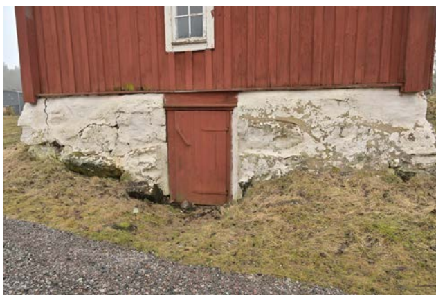
Bild 15. Stora bostadshusets östra gavel med jordkällaren under den förlängda delen av huset. (SLM D2024-0239)