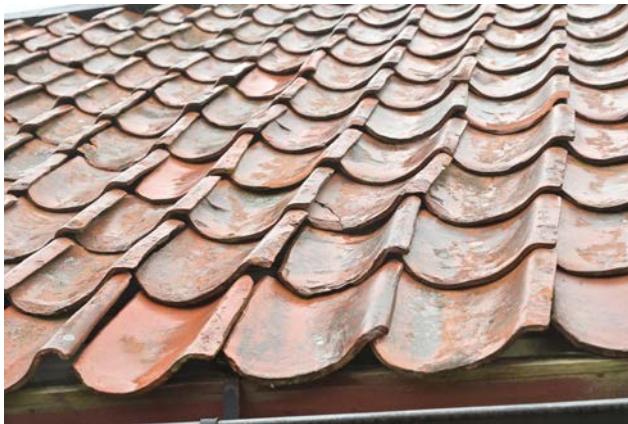
Bild 64. Det enkupiga handslagna teglet på den södra ekonomibyggningens lägre del är troligen tillverkat vid Tureholm.