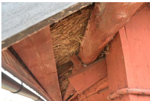
Bild 55. Stråttaket under norra ekonomibyggnaden är synligt vid takfoten.