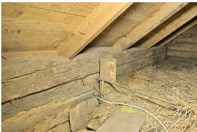
Bild 70. Bild av dragjärn på vinden till den lägre delen av södra ekonomibyggnaden. (SLM D2024-0294)