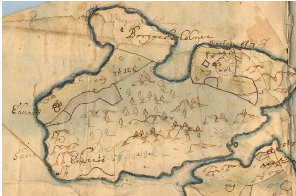
Bild 1. Utsnitt av Karta över säteriet Giäddeholm upprättad 1684. Svartvik syns uppe till höger och Kimholmen är vid denna tid en egen ö, avskuren från Edanö i nedre högra hörnet. Kartan är ritad med norr åt vänster i bild. På det sätt som Edanö är ritad kan man tolka det som att gården är en något större enhet med ekonomibyggnader, jämfört med Svartvik och Kimholmen.