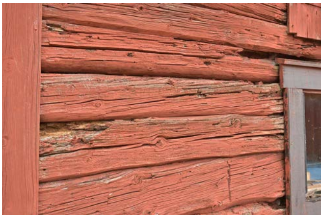
Bild 73. Rötskador i timmerstommen på uthusets södra fasad.