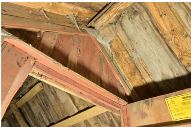
Bild 38. Bild av den tidigare östra gavelväggen med äldre rödfärgad panel. (SLM D2024-0262)