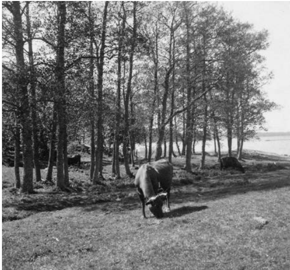
Bild 9. Foto av ängsmarken nära Edanö som betades in på 1900-talet. I bakgrunden syns stadsfjärden och Tureholmsviken bortom den. Foto: Ivar Nilsson 1939. (SLM MO15793)