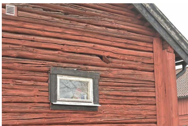
Bild 52. Norra ekonomibyggnadens västra gavel har djupa fickor efter rötskador.