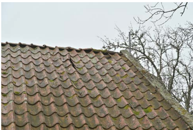
Bild 21. Felaktigt liggande pannor på stora bostadshusets norra takfall.