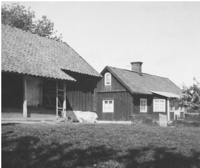
Bild 4. Stora och lilla bostadshuset fotograferade från sydväst 1939. Verandan på stora bostadshuset till vänster har ännu kvar sitt äldre utseende. Verandataket fortsatte i nästan samma vinkel som övriga taket, var tegeltäckt och översta plansteget var lägre än idag. Detta gav huset ett ålderdomligt utseende som idag är sällsynt. Foto: Ivar Nilsson. (SLM MO15786)