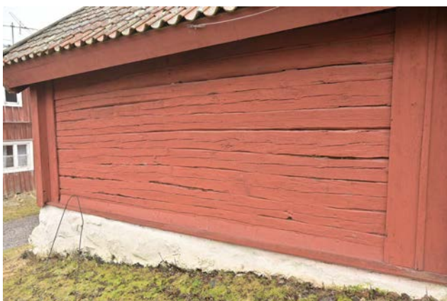
Bild 17. Foto av den opanelade väggen på stora bostadshusets norra sida. Väggen hade fickor i timret efter rötskador. Väggen panelades likt övriga huset innan rapporten färdigställdes.