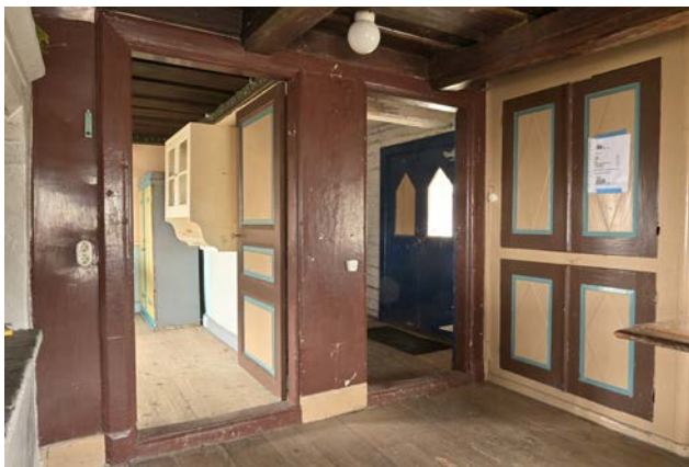
Bild 28. Bild tagen från stugan mot kammaren och farstun. Den nuvarande färgsättningen härstammar sannolikt från 1900-talets andra hälft.