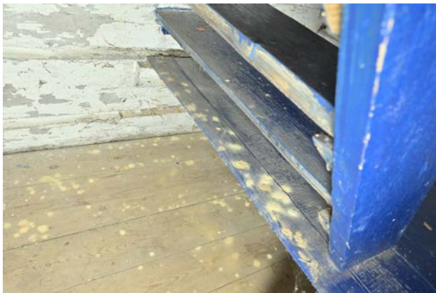
Bild 25. Borrmjöl efter trägnagare.