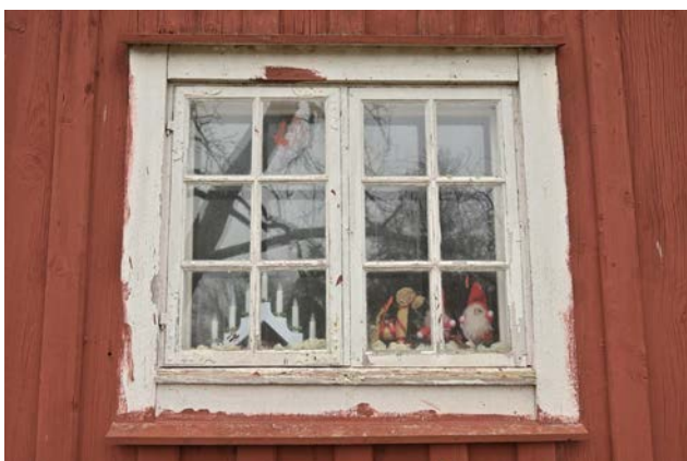
Bild 18. Fönster på stora bostadshusets västra gavel. Den vänstra fönsterbågen har spikade beslag av 1700-talsmodell.