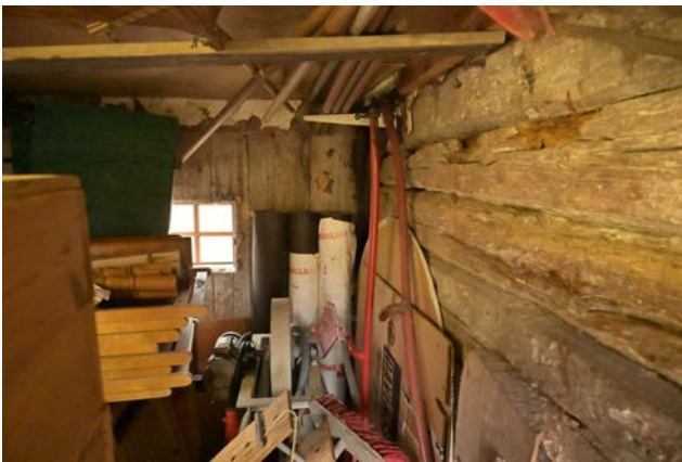
Bild 76. Bild av uthusets oinredda del med hjärtväggen till höger i bild. (SLM D2024-0300)