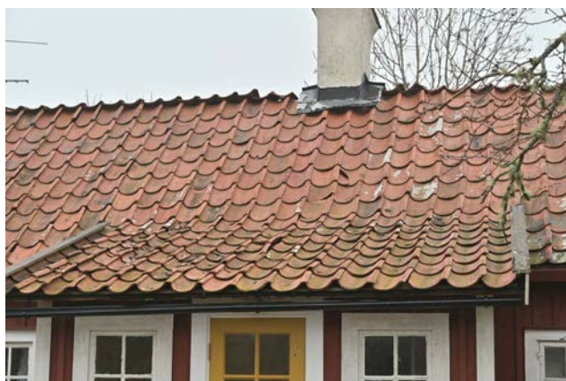
Bild 41. Bild av taket på lilla bostadshuset. (SLM D2024-0265)