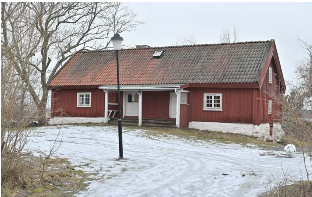
Bild 14. Stora bostadshuset vid Edanö gård.