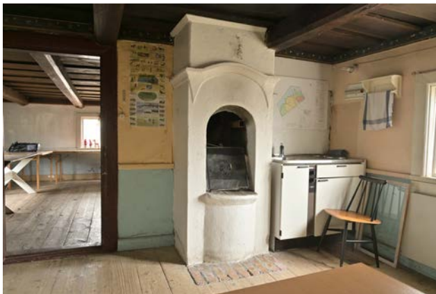
Bild 29. Kammaren mot väster med rörspis och dörröppning till stugan till vänster. (SLM D2024-0253)