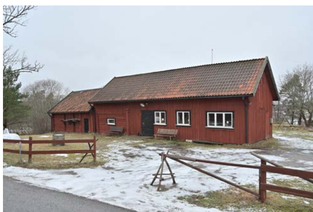
Bild 56. Södra ekonomibyggnaden från sydväst.