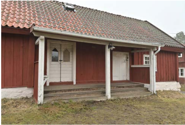
Bild 23. Stora bostadshusets öppna veranda som fick sitt nuvarande utseende i mitten på 1900-talet. En återgång till den tidigare utformningen med ett brantare tegeltäckt tak hade kunnat återskapa en del av husets förlorade ålderdomliga karaktär.