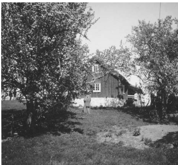
Bild 11. Stora bostadshuset fotograferat från väster 1939. Här syns en del av trädgården med fruktträd, vilken till vänster stängslad för djuren. Notera vindsfönstret som till skillnad från idag har vitmålade träspröjs. (SLM MO15787)