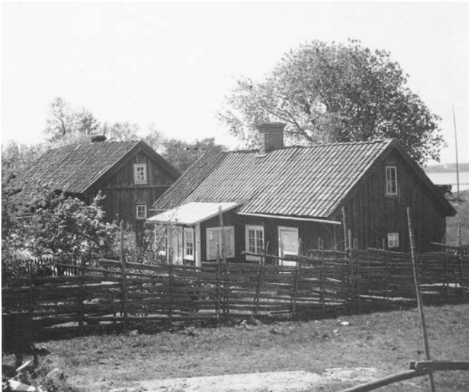
Bild 6. Stora och lilla bostadshuset fotograferat från ekonomigården i öster. Notera takets form på stora bostadshuset som är något hopsjunken vid gavlarna. Lägg också märke till det tvåkupiga teglet på större delen av taket på det lilla bostadshuset, och farstuvistens fönster och tak som skiljer sig från dagens utseende. Här kan man också se gärdesgården som skyddar bostadshusens trädgårdar från djuren på gården. 1939. (SLM MO15788)