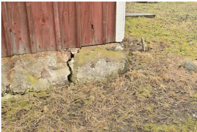
Bild 37. Spricka i grunden vid farstuviken.