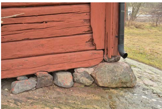
Bild 50. Norra ekonomibyggnadens nordvästra hörn sett från norr. Syllstocken ser ut att vara kapad i änden och ersatt av ytterligare en grundsten.