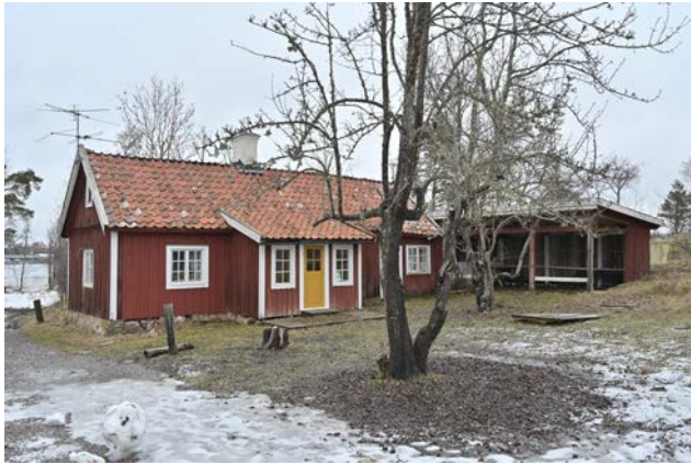
Bild 35. Lilla bostadshuset från söder.