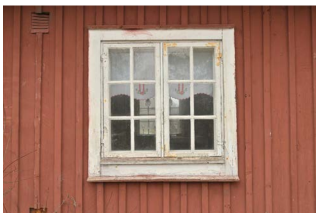
Bild 40. Fönster på lilla bostadshusets norra fasad. (SLM D2024-0264)