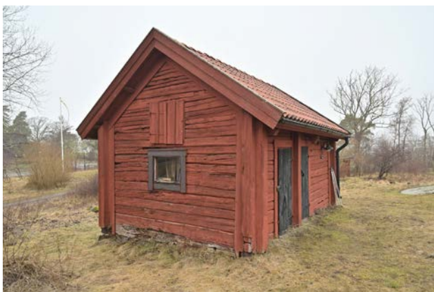
Bild 72. Uthuset sett från söder.