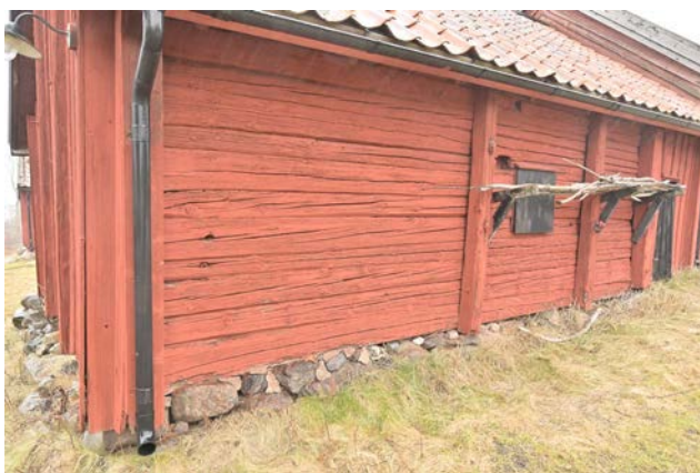
Bild 59. Den södra ekonomibyggnadens södra sida.