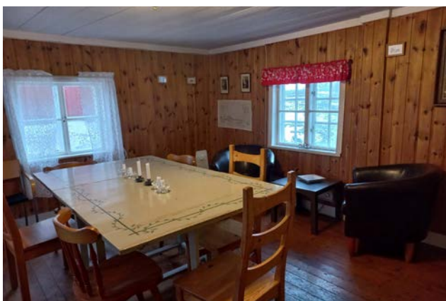
Bild 43. Bild av stugan i lilla bostadshuset mot nordväst.