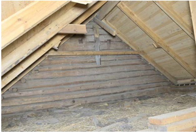
Bild 67. Vinden över den lägre delen på södra ekonomibyggnaden sett mot väster. (SLM D2024-0291)