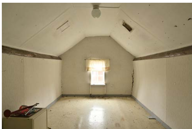
Bild 33. Det östra gavelrummet.