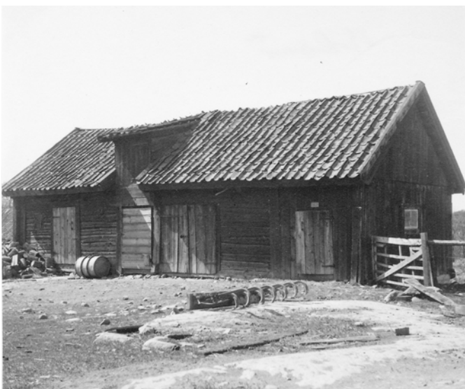
Bild 8. Den norra ekonomibyggnaden fotograferad 1939. Takkupan togs bort någon gång i mitten på 1900-talet. Portarna är inte svartmålade som idag, utan är ljusare än fasadens kulör. Taket som är täckt med handslaget tegel saknar takavvattning helt. Längst till vänster syns en liten lucka, där det idag finns ett fönster. (SLM MO15796)