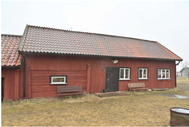
Bild 63. Södra ekonomibyggningen från söder. Köket finns vid det liggande fönstret till vänster i bild, och en samlingsisal innanför övriga fönster.