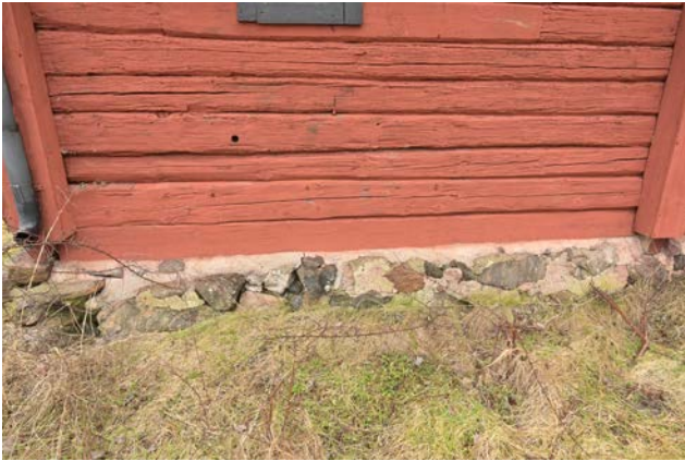
Bild 75. Syllstocken på uthusets västra sida har bytts ut i senare tid.