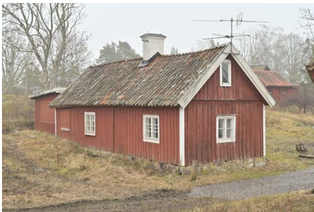
Bild 36. Lilla bostadshuset från norr.