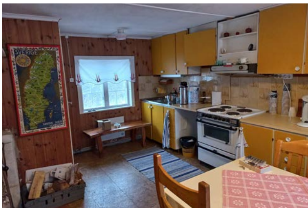
Bild 45. Bild av köket i lilla bostadshuset mot norr.