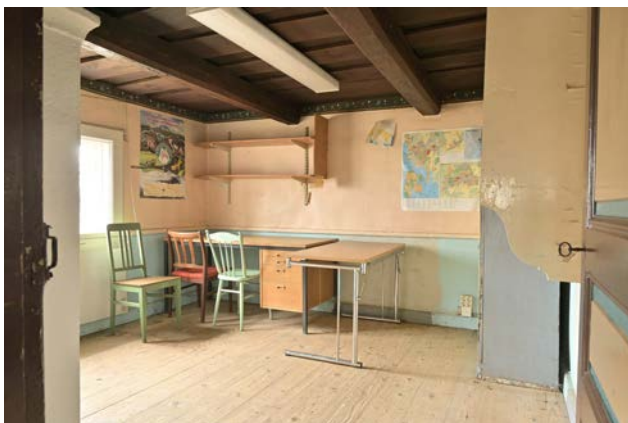
Bild 30. Kammaren sett mot öster. (SLM D2024-0254)