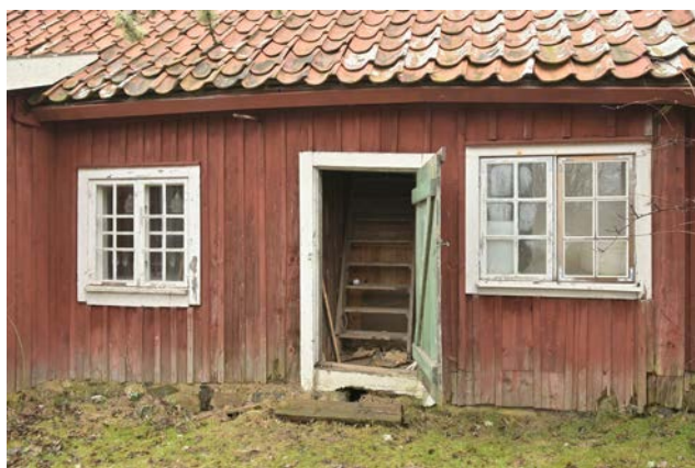
Bild 39. Ingången till vindsvåningen som finns i husets förlängda del. (SLM D2024-0263)