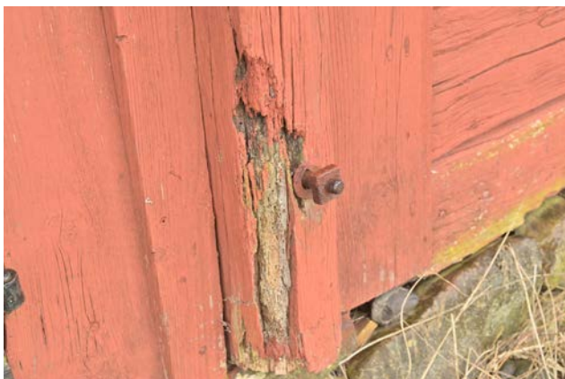
Bild 61. Rötskada på en av följarna på södra ekonomibyggnaden.