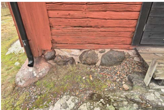
Bild 49. Fogad naturstensgrund och rötskador i timmerstomme på norra ekonomibyggnaden. (SLM D2024-0273)