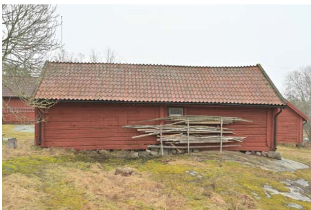
Bild 48. Norra ekonomibyggnaden från norr.