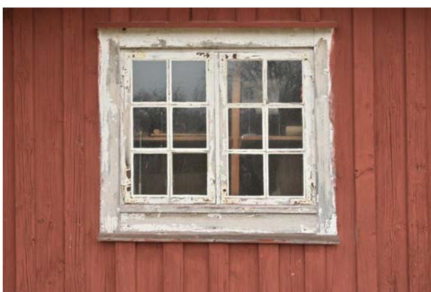
Bild 20. Ett av fönstren på stora bostadshusets norra långsida.