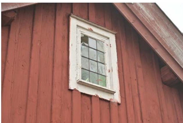
Bild 19. Det blyspröjsade fönstret på stora bostadshusets västra gavel. En ruta har gått sönder.