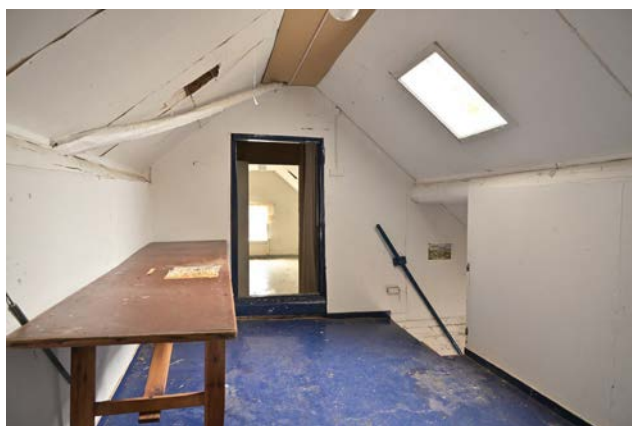
Bild 31. Hallen på vindsvåningen sett mot öster med trappan till höger i bild. Väggen bakom trappan utgjorde tidigare husets östra gavel.