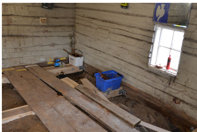
Bild 34. Förrådsdelen under pågående arbete med förstärkning av bjälklaget. Till höger syns fönstret vid husets östra gavel.