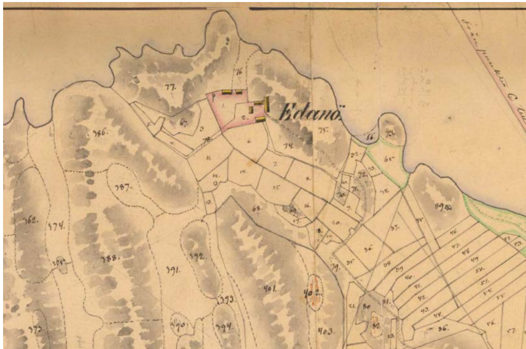
Bild 2. Karta över Edanö, Svartvik och Kimholmen upprättad 1876. Kartan är beskuren. Vid Edanö längst upp i bild syns förutom dagens byggader också den äldre ekonomibyggnad som ramade in gårdsplanen åt öster. Denna ersattes senare av en ny uppförd 1918, vilken brann ner 1954. I närheten av vattnet finns en liten bod. Från udden längst upp i bild går idag vägen till fastlandet.