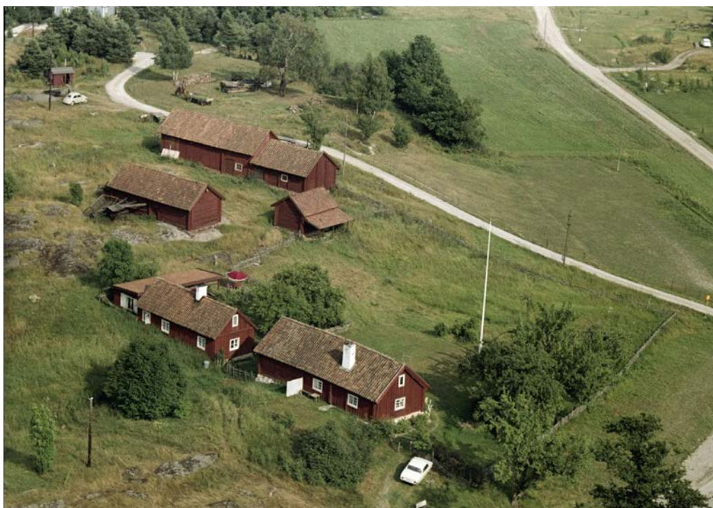
Bild 13. Flygfoto av Edanö taget 1962. Förrådet vid det lilla bostadshuset är byggt med den öppna delen i vinkel. Här syns den noggrant instängslade trädgården, som även var skild från stora bostadshuset trädgård. Infarten till gården sker från väster, närmast i bild.