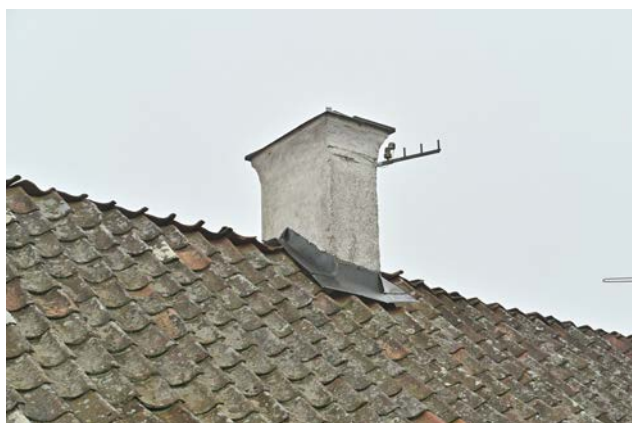
Bild 42. Skorstenen på lilla bostadshuset sedd från norr.