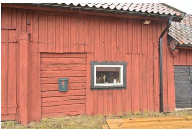
Bild 62. Södra ekonomibyggnaden från norr med fönster till köksdelen. (SLM D2024-0286)