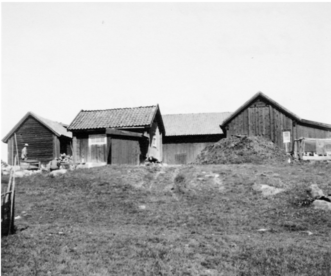
Bild 7. Foto av ekonomigården från väster med den norra ekonomibyggnaden till vänster följt av uthuset och den södra ekonomibyggnaden. I bakgrunden syns också den större ekonomibyggnad som ramade in gårdsplanen åt öster. Denna brann ner 1954. Längst till höger syns en tillbyggnad av den södra ekonomibyggnaden som revs på 1940-talet. Framför denna en hönsgräddgård. (SLM MO15795)