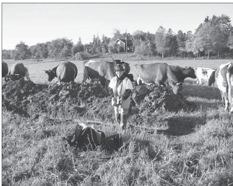
Figur 8. Karin Berggren sökschaktar inom objekt 1046 vid Laggartorp. Foto från öster, Mikael Nordin, Sörmlands museum år 2005.

En osäker stensättning samt ett gravfält om 13 synliga stensättningar påträffades (objekt 1043 respektive 1038). För att kunna fastställa statusen på den osäkra stensättningen bör en arkeologisk förundersökning genomföras. Gravfältet utgör fast fornlämning.