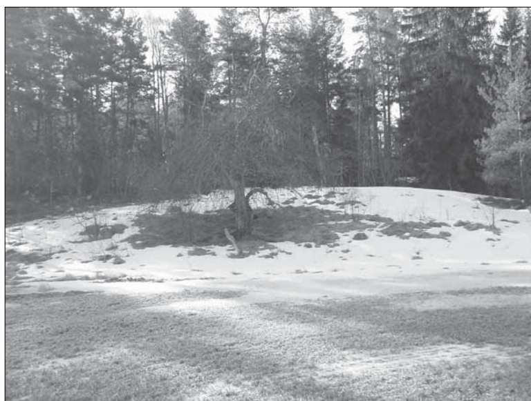
Figur 5. När fältarbetet påbörjades i april låg fortfarande snön kvar. Objekt 1002 fotografierat från norr.