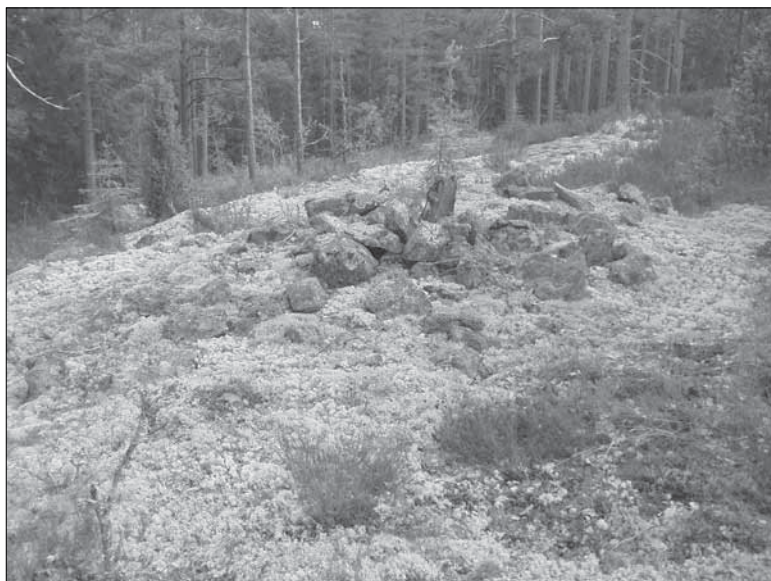
Figur 6. Vacker gränsmarkering på en bergknalle fotograferad från väster(objekt 1056).

I samband med fältinventeringen har elva skilda lämningstyper registrerats. Vid klassificeringen av dessa har Riksantikvarieämbetets nomenklatur för fornlämningar använts i möjligaste mån (Blomqvist 2004). I en del fall har denna dock fått frångås. Exempelvis då det via kart- och arkivstudien ej har varit möjligt att bekräfta närvaron av historiska enheter, vilka genom förekomster av fysiska spår såsom av äldre vägar, rester efter tomtmark synlig genom stenröjning och kulturväxter med mera, ändå kan misstänkas finnas dolda under mark. Företrädesvis kan det röra sig om mindre enheter, såsom backstugor et cetera, men möjligen även äldre gårdar och torp med rötter i medeltiden vilka inte låter sig spåras i befintliga kartor och arkiv. Dessa platser kallas Plats för lägenhetsbebyggelse – by-/gårdstomt , och syftar på ej fullständigt verifierade lägen som behöver utredas vidare (etapp 2). Ett passande läge för förhistorisk bosättning som ännu inte testats benämns Boplatzläge . På en plats har både hyttlämningar och boplatzlämningar påträffats och registrerats under samma nummer (objekt 1055), varför detta objekt benämns Hyttlämning/Boplatzläge . Sammanlagt har 79 objekt registrerats under fältinventeringen.