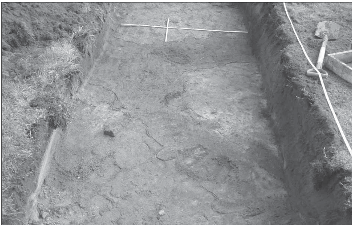
Figur 10. Den påträffade rännan vid Linddalen (objekt 1069) fotograferad från väster.

Objekt 1010. Husgrund, historisk tid. Objektet är cirka 13x7 meter stort och beläget i sydsluttning intill befintlig åkermark. Sluttningen är beväxt med företrädesvis barrskog. Objektet utgörs av resterna av en ladugårdsgrund med upp till en meter stora tuktade grundläggningsstenar. Vid utredningen konstaterades förekomster av enkupigt taktegel vid och omkring husgrunden. Lämningen kan eventuellt knytas till den registrerade by-/gårdstomten Träsket belägen drygt 150 meter åt nordväst (Oxelösund 52:1). Objektet är lokaliserat utanför det utredningsområde som berördes av etapp 2. Objektet är ej identifierbart på sockenkartan från 1677 (LMS, akt nr C64-1:C13:23-32), däremot identifierbart på Häradskartan (RAK id. J112-56-10). Ej fornlämning. Ingen åtgärd.