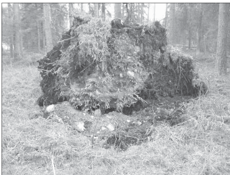
Figur 7. Kolningsanläggning synlig i rotvålta fotograferad från öster (objekt 1057). Foto: Lars Norberg, Sörmlands museum år 2005.

Drygt 600 meter sydost om den tidigare registrerade kopparhyttan Fågelhyttan (Tuna 77:1) påträffades vad som eventuellt kan utgöra ett gruvhål alternativt en täkt (objekt 1033). Vid brytningen, eller täktverksamheten, har man grävt ett horisontellt, cirka 90 meter långt och upptill 10-20 meter brett schakt, vars djup uppgår till cirka 2-3 meter. Delar av schaktet är vattenfyllt samt beväxt med stora löv- och barrträd. Området binds samman med Fågelhyttan via en äldre, till delar övergiven vägsträckning (objekt 1036). I dagsläget kan lämningens funktion inte närmare verifieras, om objektet innefattar en eventuell skärpning alternativt utgör en jordrymning eller möjligen utgör spår av senare täktverksamhet. Huruvida detta är en fast fornlämning återstår att utreda. Platsen bör utredas vidare i händelse av exploatering.