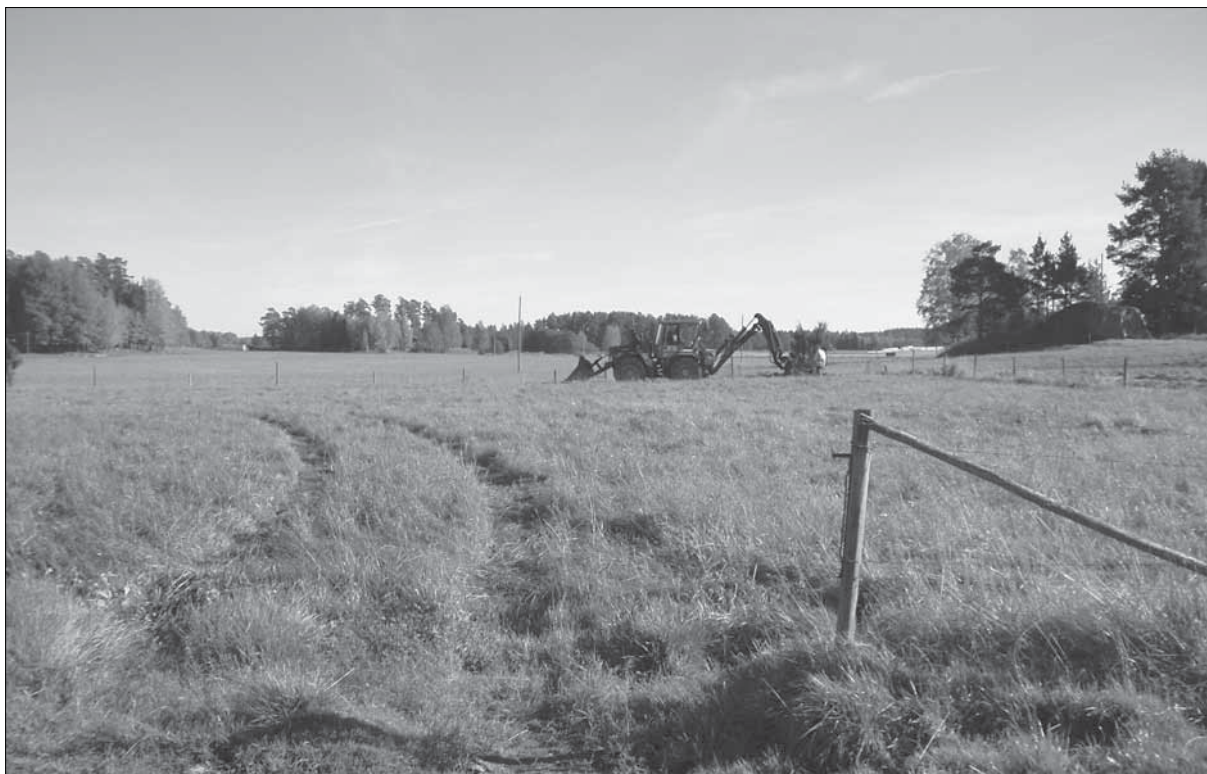
Figur 4. Sökschaktning med traktorgrävare vid objekt 1045. Bilden är tagen från väster. Foto: Karin Berggren, Sörmlands museum år 2005.

En analys av de sju hyttlämningar som återfanns inom, eller strax utanför stråket, ger vid handen att en passande hyttplats ligger på vad som idag är skogsmark i närheten av odlad mark invid ett mindre vattendrag.