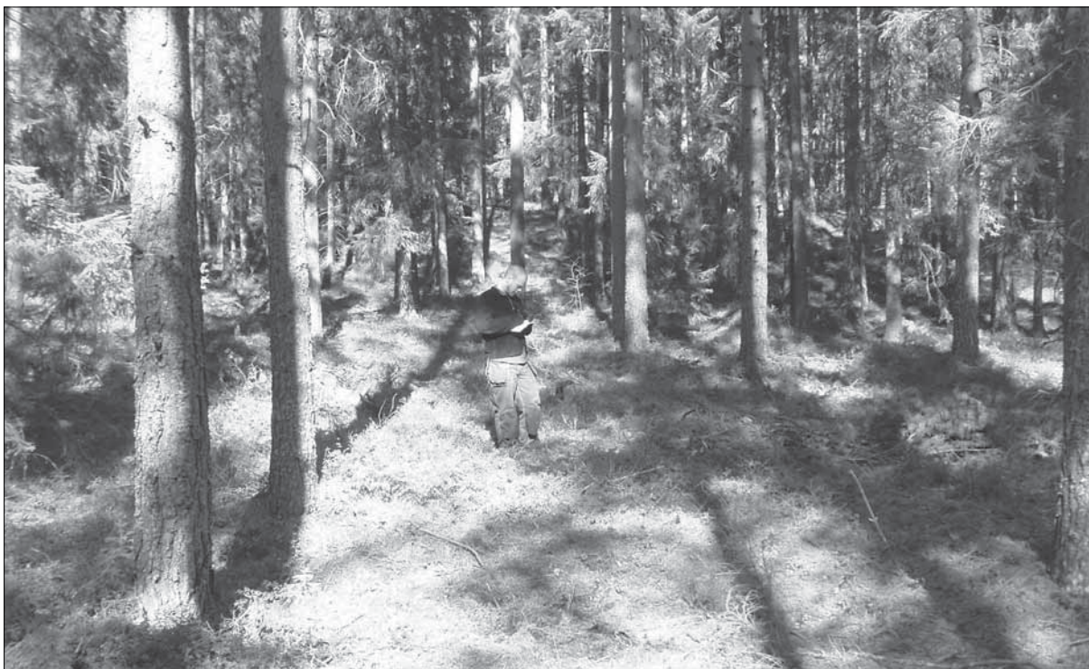
Figur 2. Mikael Nordin fältinventerar i området kring objekt 1021. Bilden tagen från väster. Foto: Lars Norberg, Sörmlands museum år 2005.

I ett fall (objekt 1063) bedömdes noggrann kartering med totalstation i kombination med sondstick med jordsond vara den bästa utredningsmetoden. Cirka 900 punkter mättes in med totalstation inom ett område med kolbottnar och täktgropar. Dessförinnan bedömdes kollagens utbredning genom sondstick med jordsond.