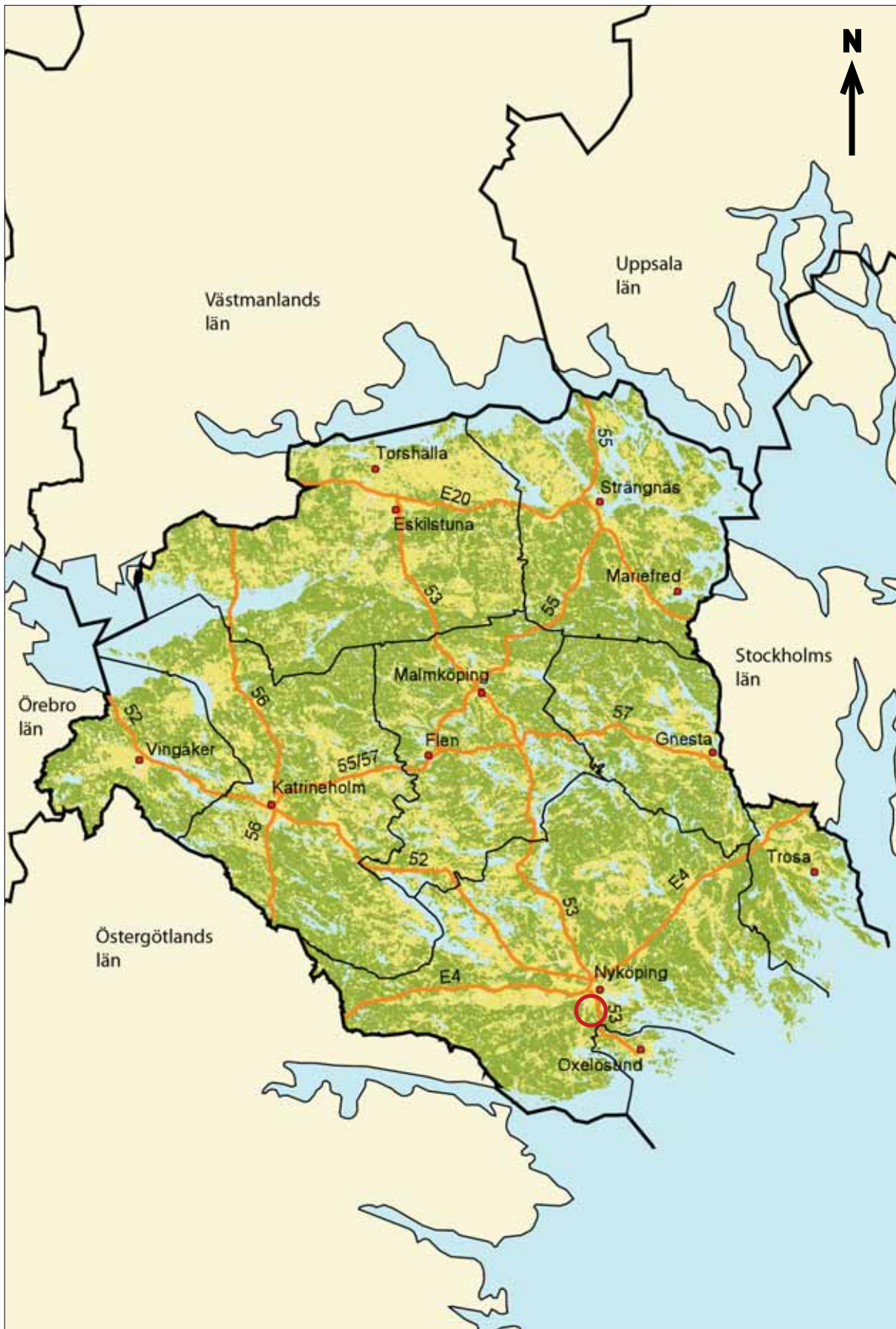
Figur 1. Översiktskarta över Södermanlands län med kommuner, större orter, vägar och angränsande län. Utredningsområdets belägenhet är markerat med röd kontur. Skala 1:800 000.