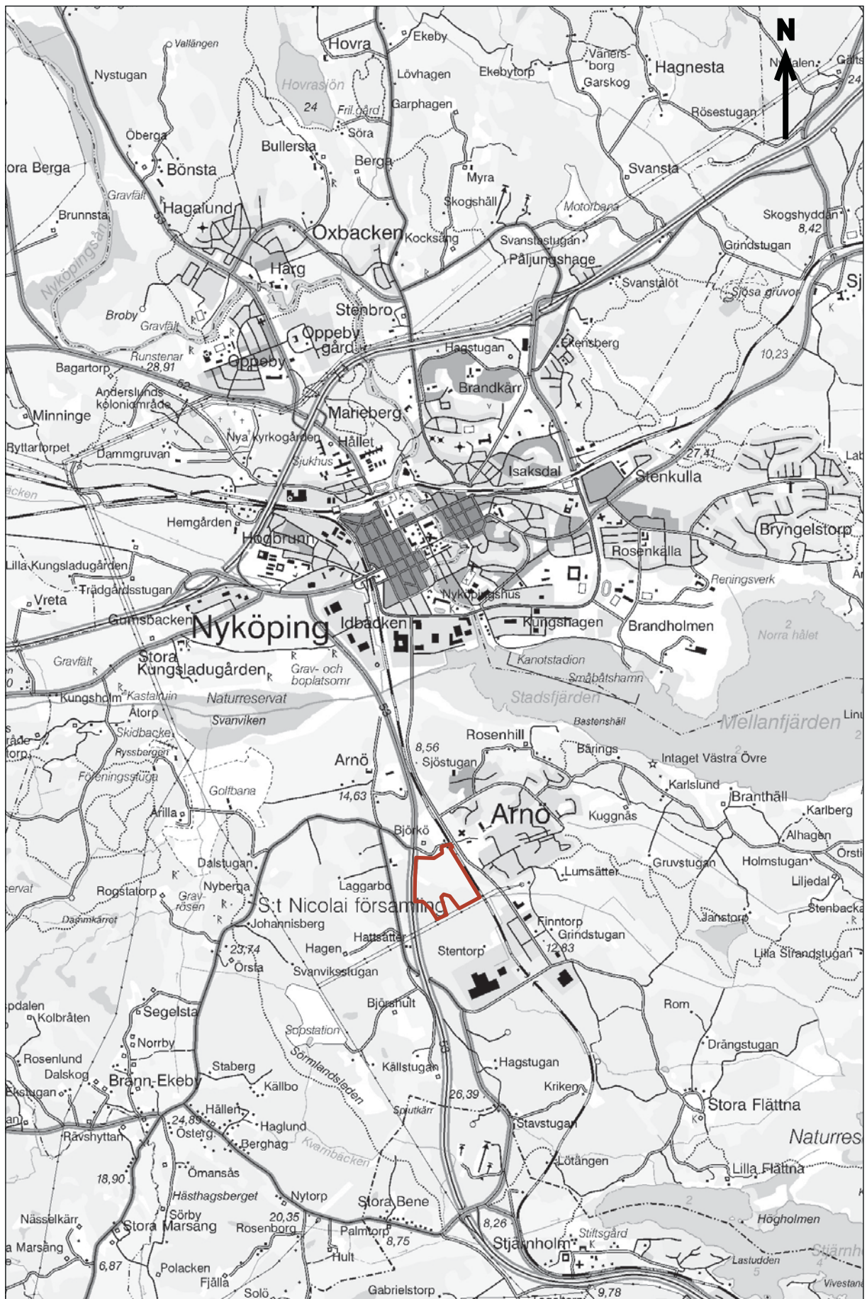
Figur 2. Utdrag ur Gröna kartans blad (GSD) Nyköping 9H SV med utredningsområdet markerat. Skala 1:50 000.