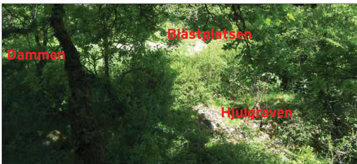
Figur 7. Bilden visar den rumsliga relationen mellan objekt 5 & 6. Bilden är tagen från väster.

Tillägg: Objektet utgörs av en ventilerad grund till någon form av ekonomibygnad, möjligen en ängslada. Lämningen är belägen i kanten av ett skogsparti (lövskog), vilket gränsar till åkermark i öster. Grundstenarna bildar en 5 x 7 meter stor rektangel som ligger i nordväst- sydöstlig riktning. Stenarna är mellan 0,40 och 0,5 meter höga och har både rundade och kantiga former. I det nordvästra respektive sydvästra hörnet är två stenar placerade på varandra. Övrig kulturhistorisk lämning. Ingen åtgärd.