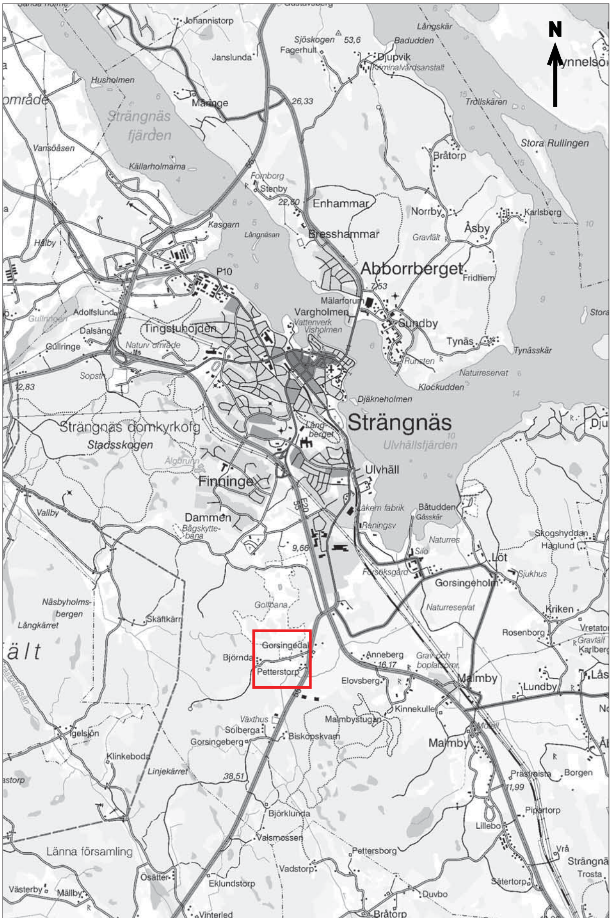
Figur 2. Utdrag ur Gröna kartans blad (GSD) Strängnäs 10H NV med utredningsområdet markerat. Skala 1:50 000.