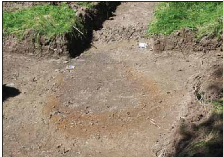
Figur 5. Den framrensade blästerugnen, A1, i schakt 16. Bilden är tagen från söder.