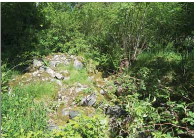
Figur 6. Det raserade fundamentet till en hjulkvarn (hjulgrav), objekt 6. Bilden är tagen från sydsydväst.