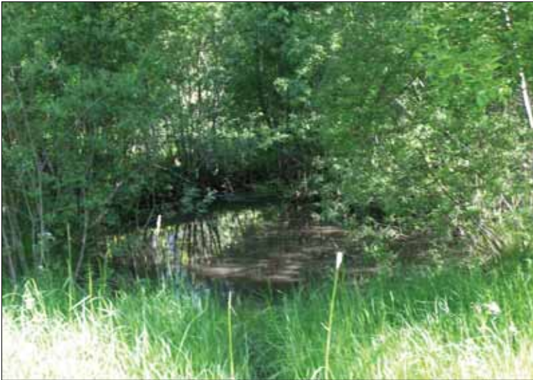
Figur 4. Den mindre dammen som ligger i anslutning till blästplatsen, objekt 5 och ett fundament till en hjulkvarn, objekt 6. Bilden är tagen från söder.