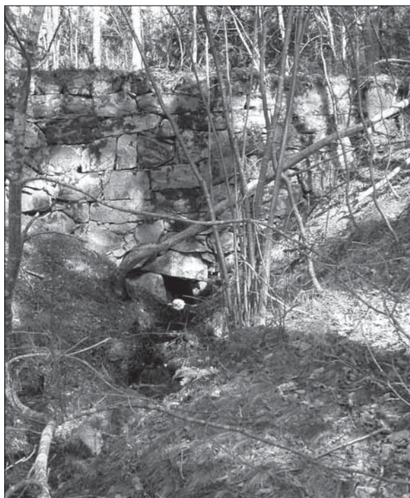
Figur 6. Till vänster: Del av den väg som löper längs med rullstensåsens krön. Vägen kan sannolikt härledas till förhistorisk tid. Till höger: Exempel på en stenbro som finns i anslutning till den äldre vägsträckningen och som fortfarande används som brukningsväg.