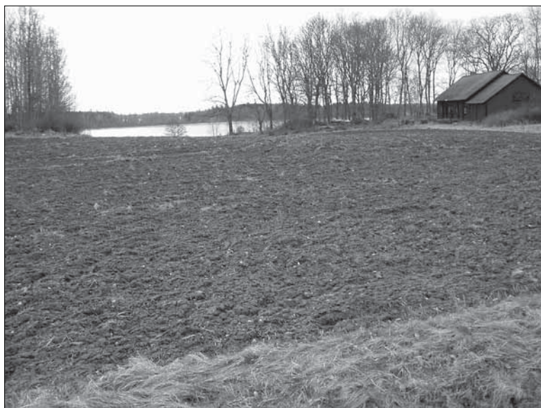
Figur 3. Bilden visar den västra delen av objekt 3, ett boplatsläge med utsikt mot Yngaren. I den plöjda åkern påträffades ett lösfynd i form av en facetterad löpare. Bilden är tagen från NO.

Objekt 3. Boplatsläge. Objektet är beläget öster om Lundby på södra sidan om väg 52. Området är cirka 250 x 50 meter stort och är beläget 35 meter över havet.