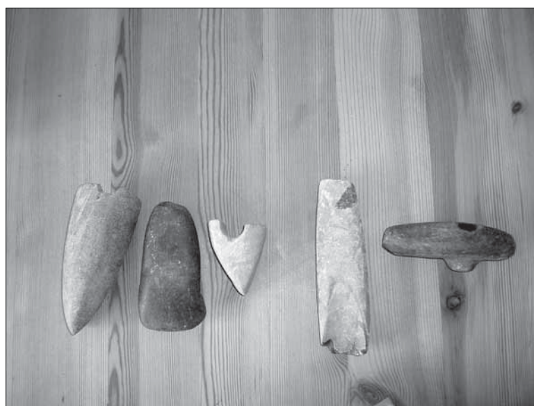
Figur 4. Stenyxor som påträffats inom Sten- torps ägor. Yxorna förvaras på gården.

Objektet kan ses i samband med dagens bostadsbebyggelse. Ej fornlämning. Ingen åtgärd.