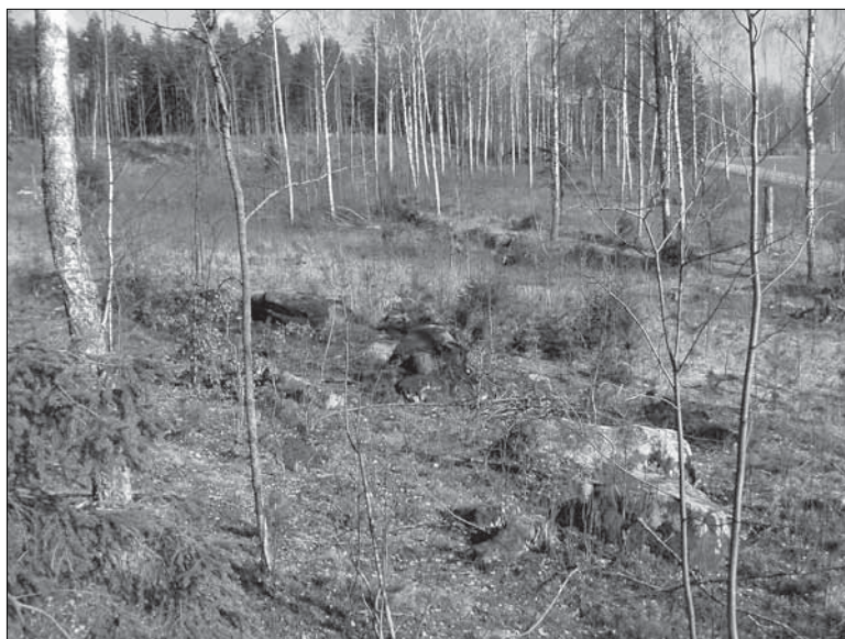
Figur 6. Bilden visar boplatsläget objekt 17. Vid inventeringen påträffades lösfynd i form av keramik i två rotvälter inom området.

Objekt 21. Boplatsläge. Objektet är beläget söder om väg 52, strax nordväst om gården Dämbol. Området är cirka 150 x 50 meter (nordväst-sydöst) och är beläget 35 meter över havet. Objektet ligger i åkermark och utgörs av en flack sluttning åt sydväst, ned mot