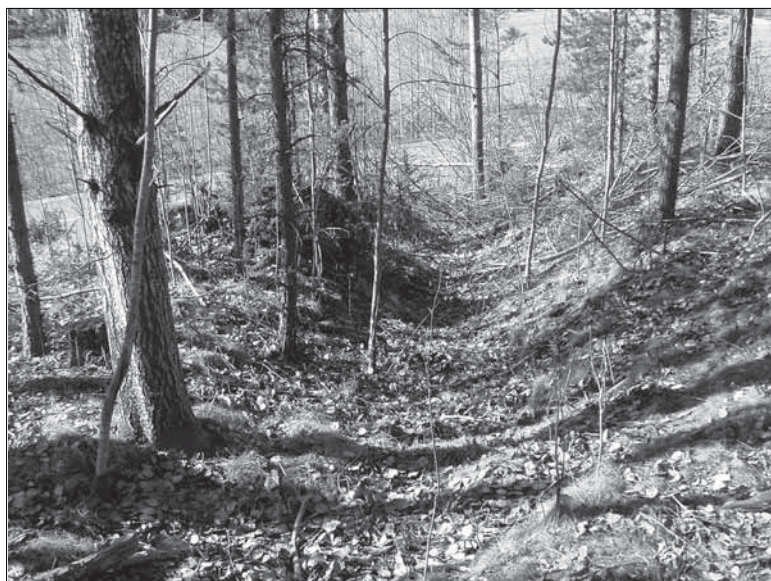
Figur 5. Bilden visar den nedre delen objekt 16. Hålvägen ligger i sluttningen av rullstensåsen (Tolmon/Katrineholmsåsen) och sträcker sig i sydvästlig riktning. Bilden är tagen från NO.

Objekt 15. Fångstgrop. Objektet är beläget på södra sidan om väg 52, mitt emot objekt 14 . Lämningen