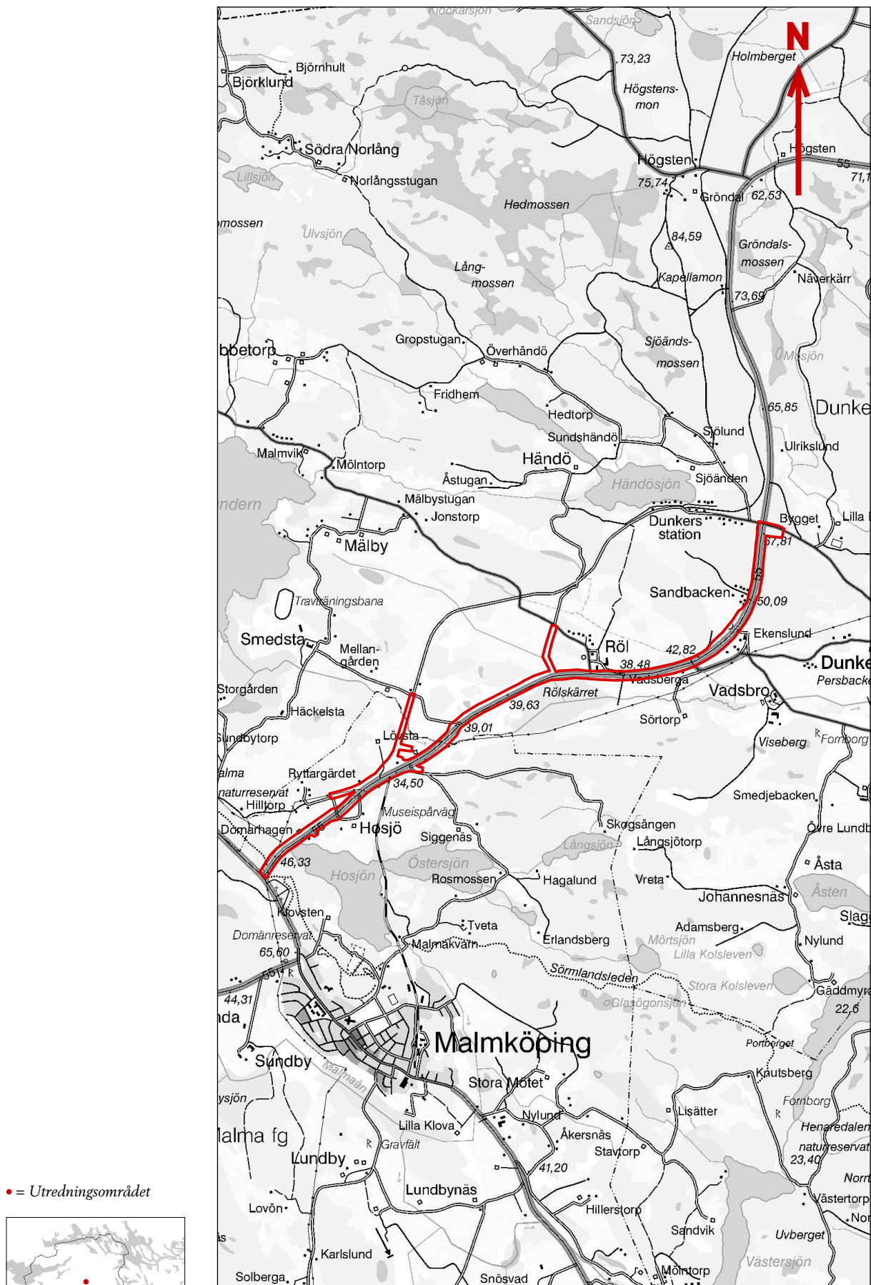
Figur 1. Utdrag ur Gröna kartan (GSD) Strängnäs 10H SV med undersökningsområdet markerat. Skala 1:50 000.