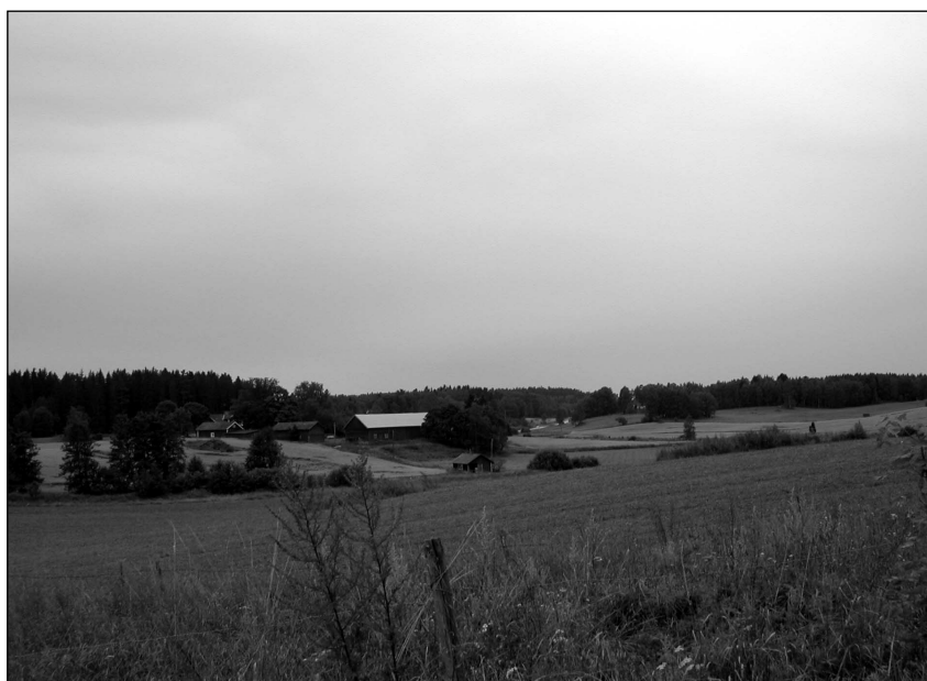
Figur 2. Det kuperade jordbrukslandskapet i anslutning till väg 55. Bilden tagen från NV.

Under inventeringen påträffades inom och i anslutning till utredningsområdet sammanlagt 16 objekt. av varierande karaktär (se bilaga 4 & 5). Majoriteten utgjordes av områden som utifrån topografiskt