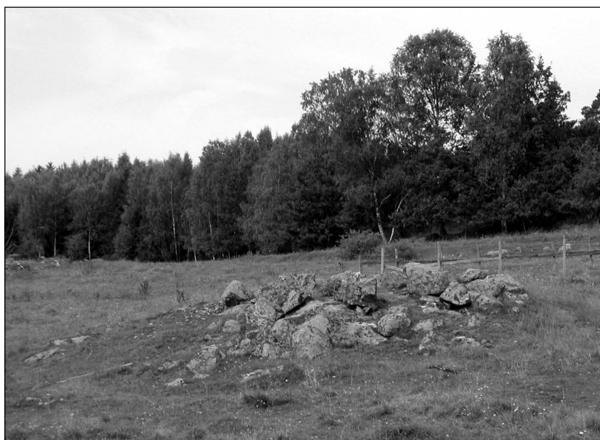
Figur 3. Hagmarken väster om Röl, norr om väg 55, där objekt 11, 12 och 13 var belägna. I förgrunden ett av röjningsröseena. Bilden är tagen från SÖ.

Brukningsvägen ska ses i samband med RAÄ206, en vägbank, med tillhörande milsten RAÄ32 (se Häradskartan och Ek. karta 1958). Bron går över ett dike som sträcker sig genom en dalgång i nordvästlig riktning. Ej fornlämning.