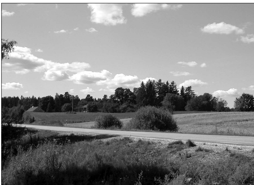
Figur 5. Objekt 16. Boplatsen ligger på höjden framför huset i bildens vänstra kant. Bilden är tagen från SÖ.

RAÄ206. Vägbank. Lämningen är belägen i hagmark nordväst och sydöst om väg 55. Vägbanken är idag sönderskuren av väg 55. Vägbanken uppgår totalt till en längd om 650 meter och är 5-6 meter bred. Sträckningen nordväst om väg 55 är flack och ställvis dikesavgränsad. I den norra delen finns en milstolpe (RAÄ32) från år 1844. Sträckningen sydöst om väg 55 är uppbyggd intill 2 meter hög. Utmed den södra kanten är ett tjugotal kvadratisk huggna stenpällare. Objektet är i Fornlämningsregistret ej bedömd som fast fornlämning.