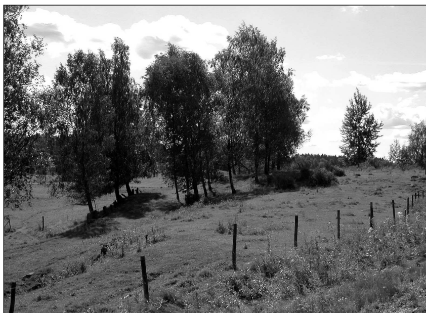
Figur 4. Bilden visar den sydvästra delen av RAÄ206. Vägbanken samt de kvadratisk huggna stenarna som markerar vägkanten, syns mellan björkarna. Bilden är tagen från NÖ.

Objekt 14. Byggnadsgrund. Objektet är beläget i hagmark, cirka 60 meter sydväst om objekt 13, nordöst om väg 55. Objektet utgörs av enskilt stående, delvis tuktade stenar till en rektangulärt formad ventilerad grund. Grundens storlek är cirka 11 x 4 meter. Trolig utgör grundstenarna resterna