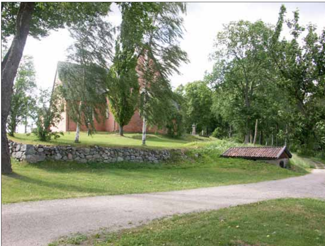
4 Kyrkogårdsmurens sydöstra del före påbörjade arbeten. Foto Kjell Taawo, Sörmlands museum (Slm D11-260).