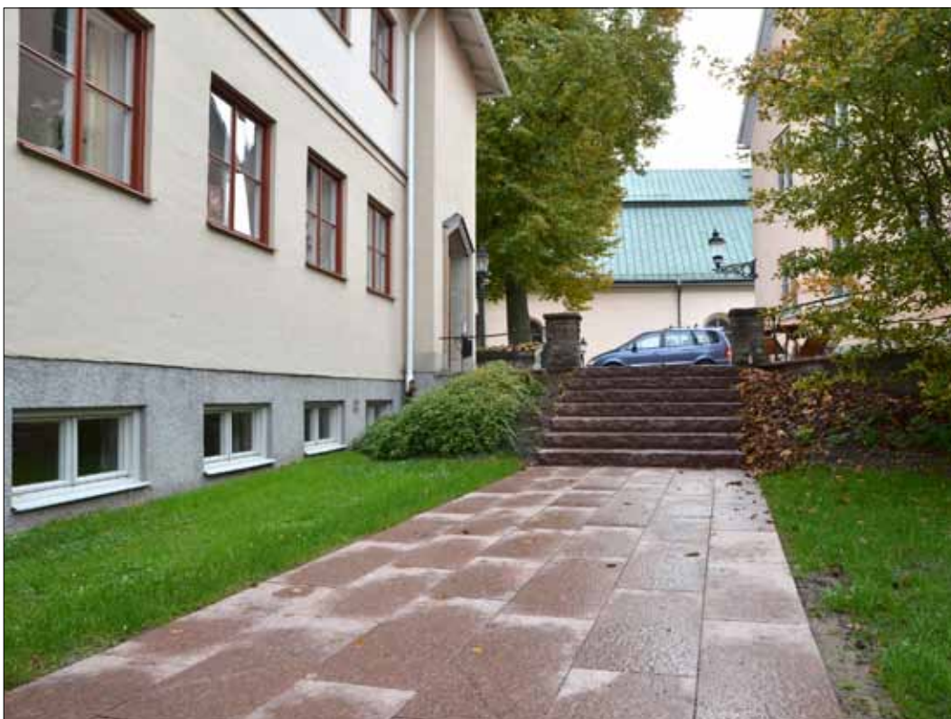
10 Gången mot trappan till parkeringsplatsen efter avslutade arbeten (Slm D13-0039).