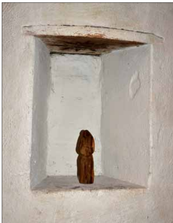
15 Nischen vid trappan till koret innan säkerhetsanordningen monterades. Skulpturen på bilden är inte den medeltida skulpturen (Slm D13-0044).