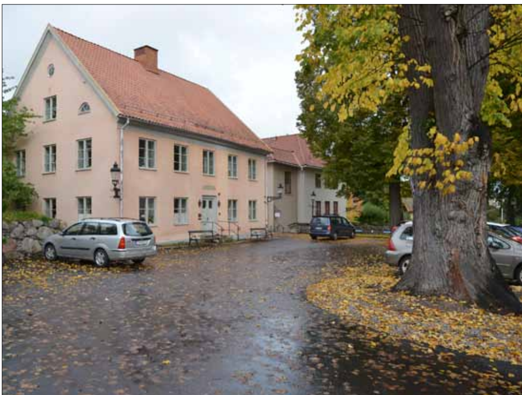
6 Parkeringsplatsen vid slutbesikningen (Slm D13-0035).