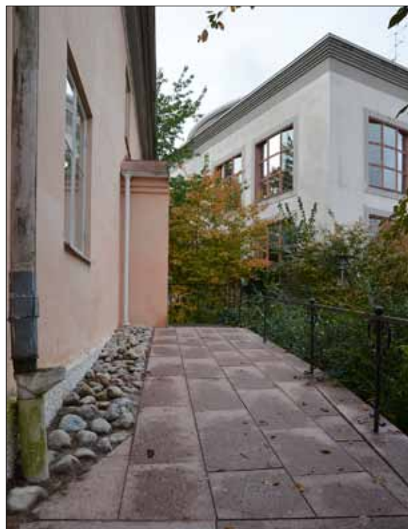
8 Entrén efter anpassning för funktionsnedsatta (Slm D13-0037).