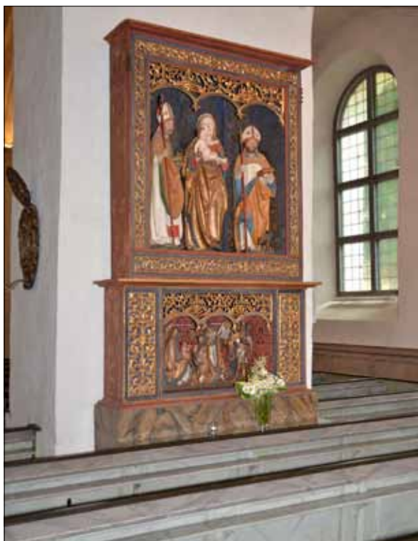
11 Platsen vid Mariaskåpet innan arbetet påbörjades (Slm D13-0040).

För att skapa en naturlig sittplats vid andaktsplatsen på ett lämpligare avstånd från altarskåpet gjordes istället en förändring av nästa bänkrad. Andaktsplatsens sittplats markerades genom att ett armstöd som var placerat mitt för skulpturen demonterades. Det demonterade armstödet flyttades omkring