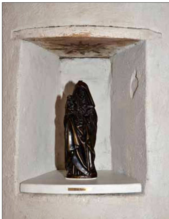
16 Nisch med den säkrade skulpturen efter avslutade arbeten (Slm D13-0045).