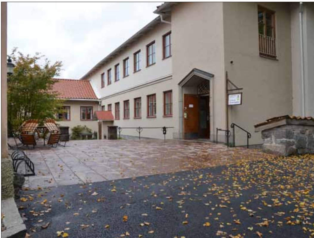
9 Ytan mellan sockenstugan och församlingshemmet vid slutbesiktningen (Slm D13-0038).