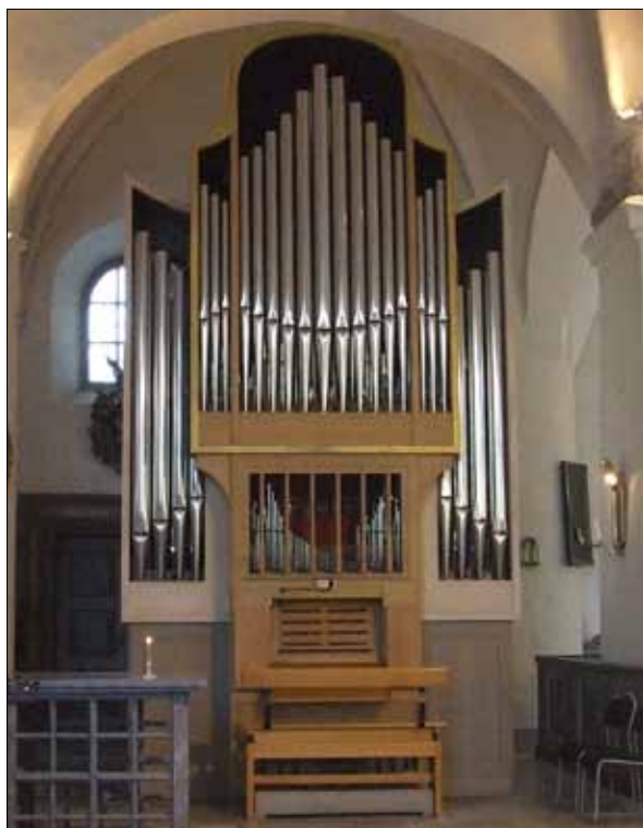
13 Orgeln i ursprunglig färgsättning. (Slm D13-0042).