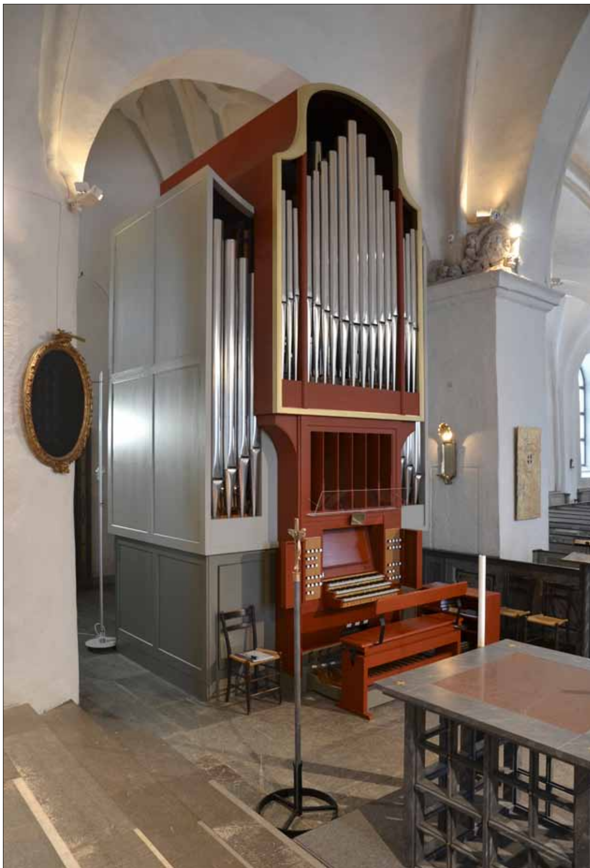
17 Orgeln sedd från koret (Slm D13-0046).