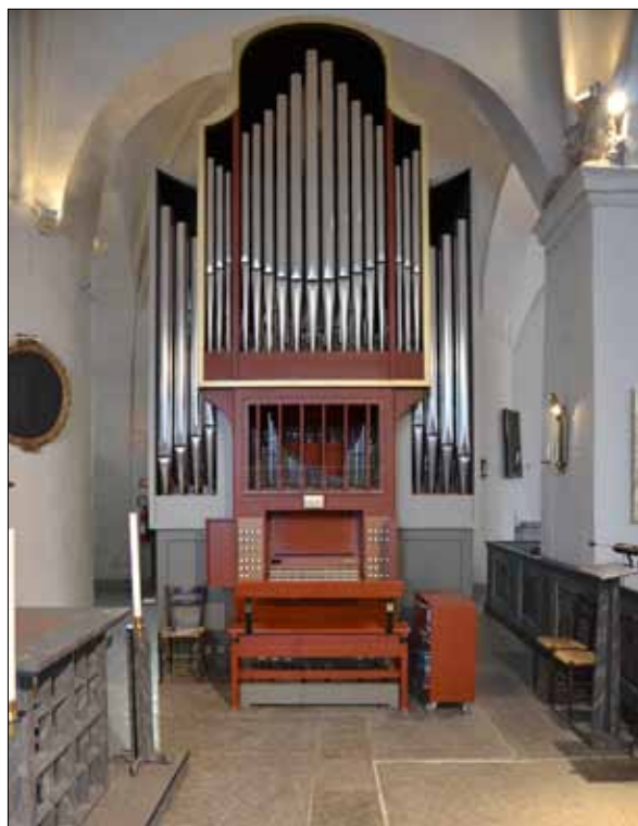
14 Orgeln vid slutbesiktningen (Slm D13-0043).