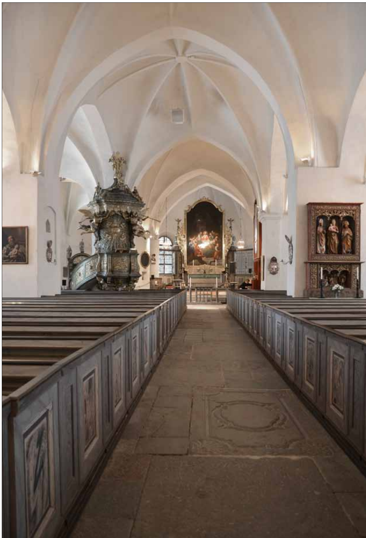
18 Kyrkorummet från väster (Slm D13-0047).