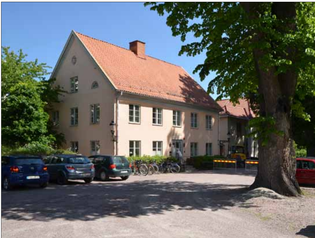
5 Den grusade parkeringsplatsen i samband med att arbetet påbörjades (Slm D13-0034).