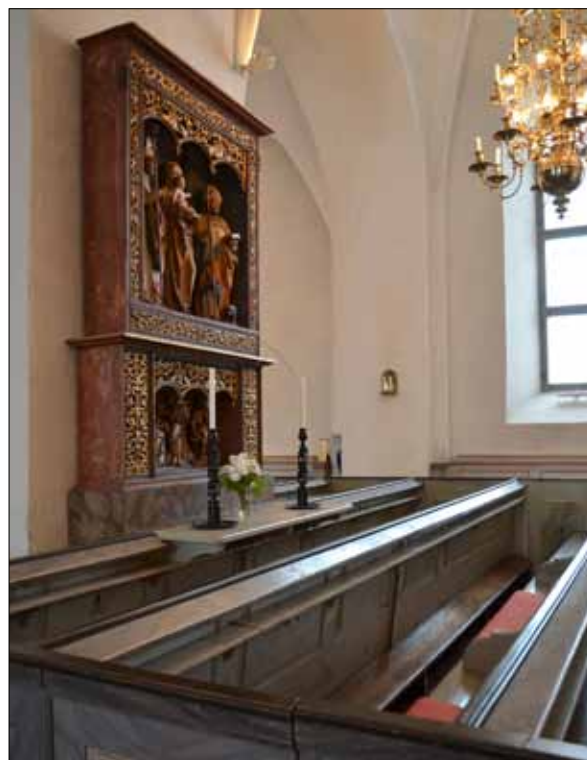
12 Andaktsplatsen och den tillskapade sittplatsen innan målningen utfördes (Slm D13-0041).