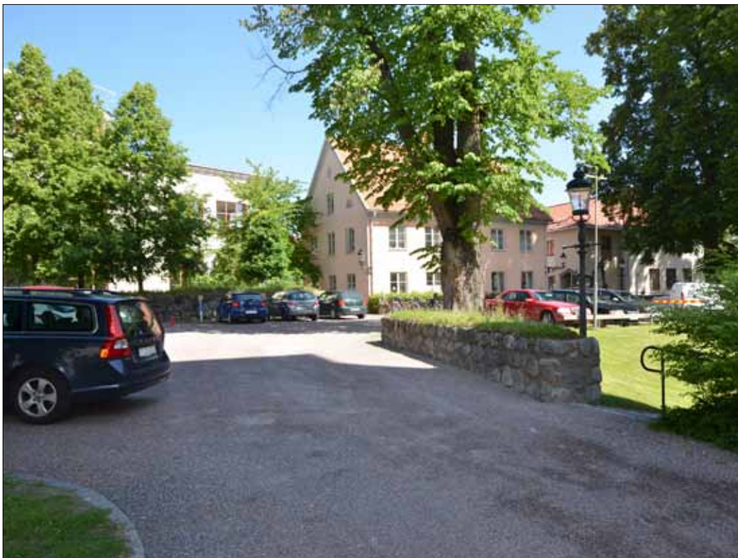
3 Infarten till parkeringen norr om kyrkan var grusad innan arbetet påbörjades (Slm D13-0032).