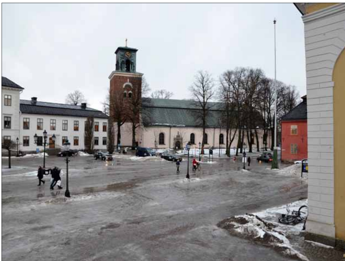
2 Sankt Nicolai kyrka utgör genom sin placering vid Stora Torgets nordöstra hörn en viktig del av Nyköpings stadsbild (Slm D13-0031).

Den 22 januari 2009 ansökte Nyköpings kyrkliga samfällighet om tillstånd till anordnande av en andaktsplats vid Mariaskåpet i Sankt Nicolai kyrka. Beskrivning och åtgärdsförslag var upprättat av Webjörn Arkitektkontor, daterat 2008-07-29. Ansökan inkom till Länsstyrelsen i Södermanlands län den 23 januari 2009. Kompletterande handlingar inkom den 2 december 2010. Länsstyrelsen beslutade