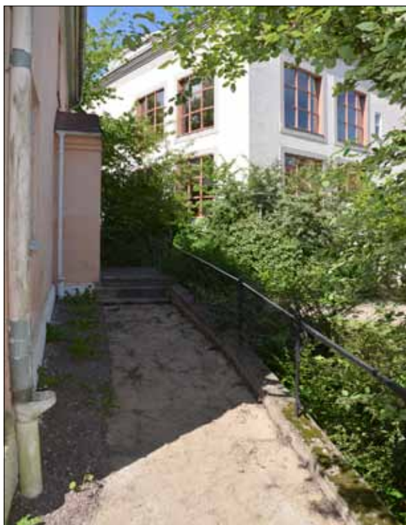
7 Den norra entrén till sockenstugan efter demontering av Ölandskalkstensbeläggningen (Slm D13-00336).

Även rampen till sockenstugans norra entré belades med Vångagranit. Mellan rampen och husets sockel lades kullersten. Muren i anslutning till rampen justerades och kompletterades med täcksten av granit i nivå med anslutande stenläggning (fig. 7-8).