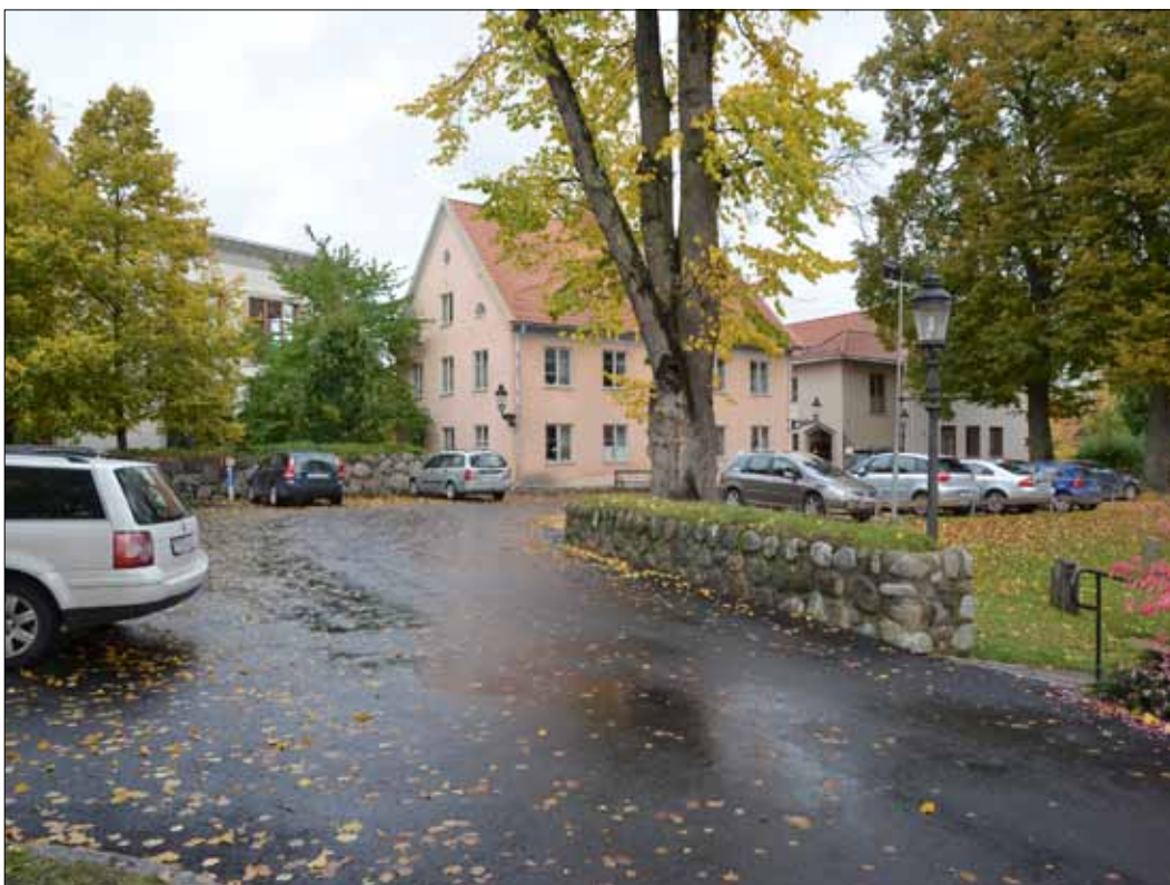
4 Infarten efter avslutat arbete (Slm D13-0033).