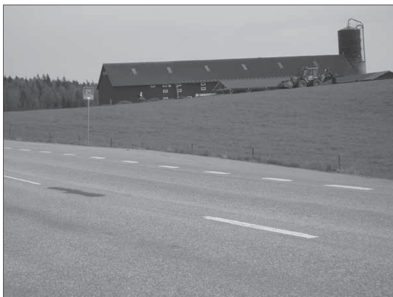
Figur 4. Mellan traktorgrävaren och vägen återfins Objekt 5. I bakgrunden skimtar bebyggelsen vid Grinda gård. Bilden är tagen från väster.

Objekt 18. Gränsmärke. Beläget utanför utredningsområdet. För beskrivning; se rapport över tidigare utförd