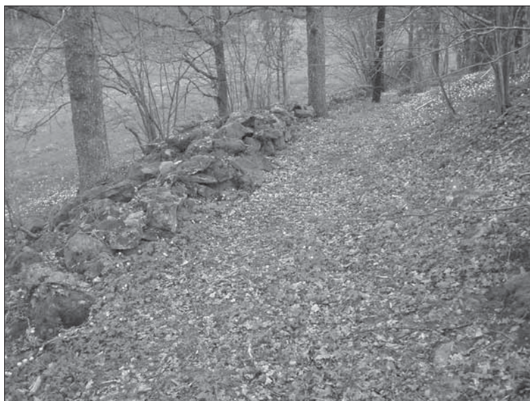
Figur 4. Objekt 30, fägata med stenmur. Gatan är fortfarande i aktivt bruk. Till vänster syns en dalgång som bildar gräns mellan Lilla Malma och Mellösa socknar. Bilden är tagen från norr.

Objekt 36. Husgrund, historisk tid. (X6555649,7, Y159684,5). Strax söder om Ålkärrs gård sågs vid etapp 2 en möjlig husgrund, på cirka 39 meter över havet. Den var delvis övertäckt med odlingssten och beläget på sydvästra änden av ett mindre impediment tätt beväxt med slån och björk. En mindre yta torvades av för hand varvid ett spisiröse kunde konstateras. Husgrunden var cirka 5 x 4 meter stor med ett cirka 2 x 2 meter stort spisiröse. Vid handgrävningen påträffades rikligt med kol, slagg och bitar av tegel. Enligt de boende på Ålkärrs gård skulle det ha funnits en smedja i gårdens närhet som revs på 1800-talets slut (se bilaga 6). Se även objekt 13 och 27. Ej fornlämning. Ingen åtgärd.