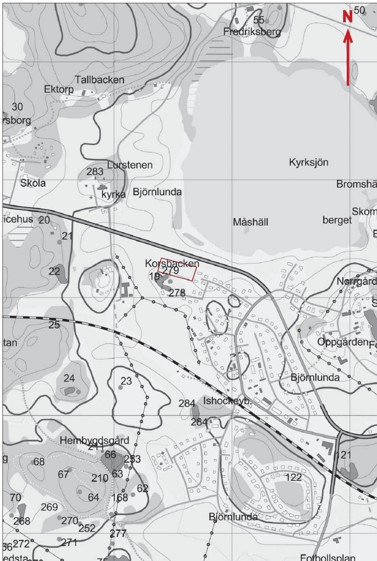
Figur 2. Utredningsområdet utmarkerat med en röd rektangel på fastighetskartan, före detta Ekonomiska kartans blad 10H Of Björnlunda. Skala 1:10 000