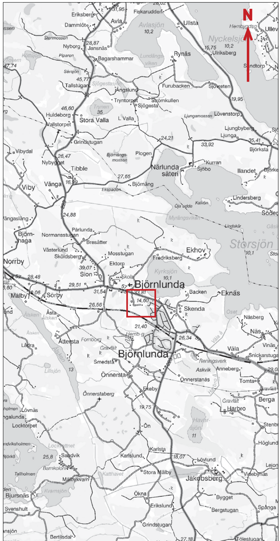
Figur 1. Utdrag ur gröna kartans blad 10H Strängnäs SO med undersökningsområdet markerat. Skala 1:50 000.