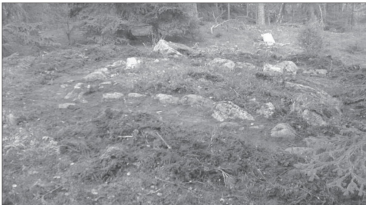
Figur 2. Stensättningen, objekt 1, efter avlägsnandet av förnan varvid kantkedjan framträdde väl. Bilden var tagen från sydost.

Objekt 4 utgjordes av boplatsslämningar i form av stolphål och kulturlager påträffade i utredningsschakt 18, med en trolig medeltida eller historisk datering (se bilaga 1 samt Gustafsson 2001:04).