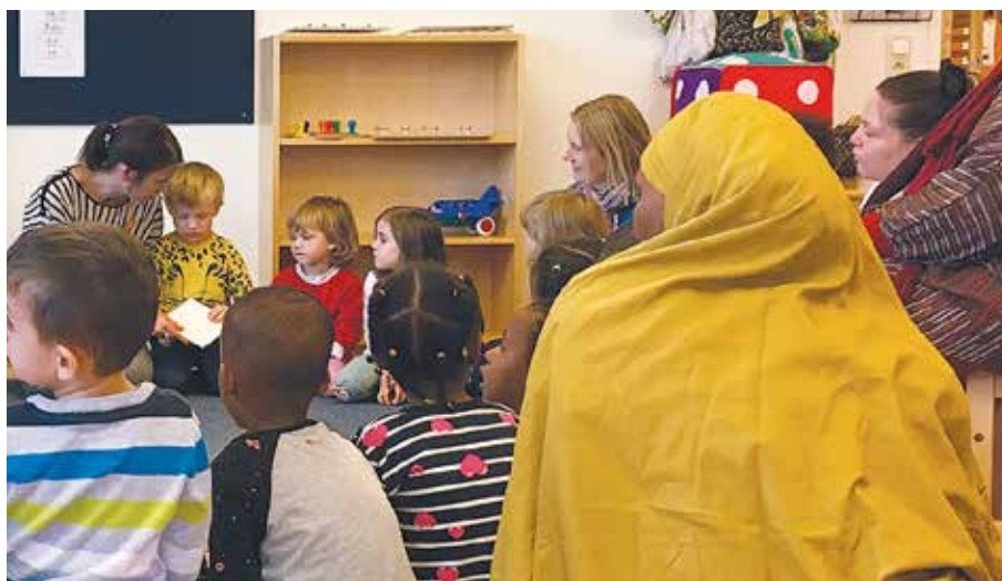
Barn, föräldrar och personal från öppna förskolan och förskolorna Ekorren och Solgläntan var de första som fick se den nya pekboken från Sörmlands museum.

Den tredje oktober möttes barn och personal från öppna förskolan och förskolorna Ekorren och Solgläntan på Familjecentralen i Brandkärr i Nyköping. Det var dags för boksläpp av en ny pekbok.