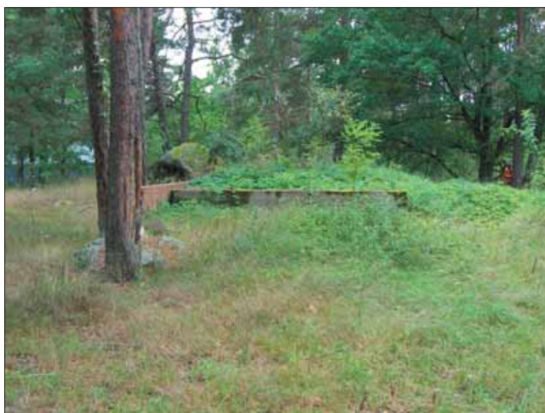
Figur 8. Betongfundamenten inom objekt11. Bilden är tagen från sydöst.

Objekt 24. Område med militära anläggningar. Objektet är beläget i lövskog inom den nordöstra delen av