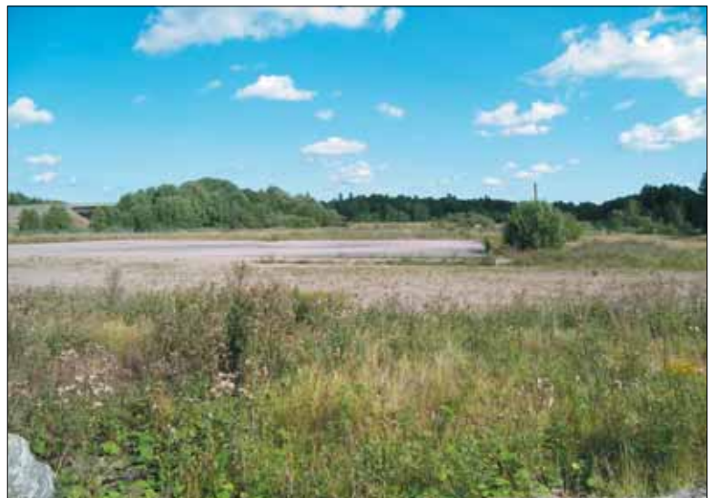
Figur 5. Vy över den nordöstra delen av utredningsområdet. Bilden är tagen från sydväst.