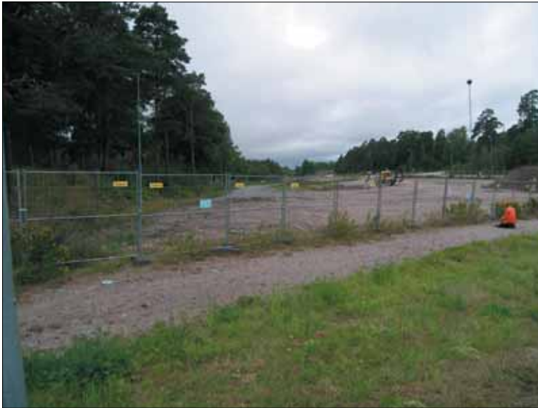
Figur 4. Den del av Eldsundsån som går under markytan. Inom området pågår miljösanering. Bilden är tagen från östsydöst.