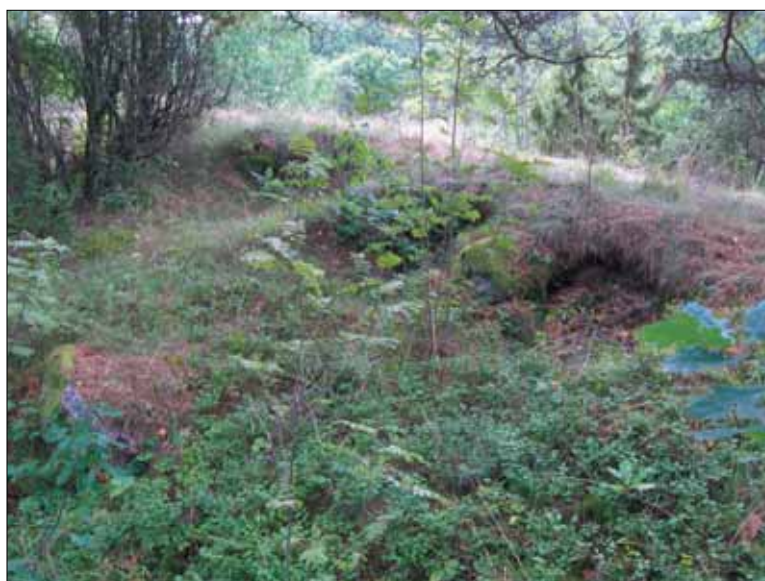
Figur 9. Exempel på skyttevärn inom objekt 16. Bilden är tagen från nordväst.

Tillägg; Vid den särskilda utredningen år 2008 bekräftades den sedan tidigare gjorda iakttagelsen (FMIS, dnr