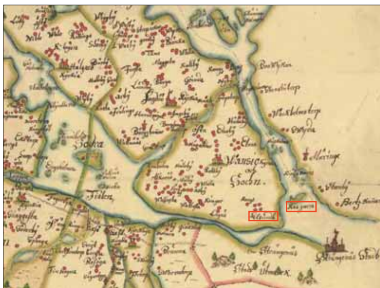
Figur 2. Bilden visar ett utdrag ur en karta från år 1690. Symbolen för Strängnäs stad syns i det högra hörnet. Eldsundsån utgjordes vid den här tiden av farbart vatten och Kasgarn var en mindre ö i Mälaren. Namnen Eldsund och Kasgarn är markerade med röd rektangel.

Inom planområdet finns således endast ett fåtal områden som är påverkade av senare tiders bebyggelse. De orörda ytorna ligger ställvis kvar som mindre områden i den omgivande bebyggelsen. I den nordöstra delen av utredningsområdet finns ett större sammanhängande markområde i anslutning till Mälaren. Nivåerna över havet inom denna yta är dock så pass låga att de inte har utgjorts av fast mark under förhistorisk tid, och till delar inte heller under historisk tid (se figur 2). De under förhistorisk tid tillgängliga, flacka ytorna där boplatser skulle kunna finnas, är idag till stora delar bebyggda. Det gäller till exempel Kasernområdet samt bebyggelsen vid Svältskogen och Broåsen (se figur 10).