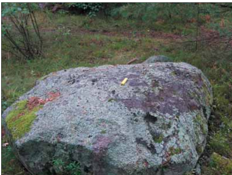
Figur 7. Hällristning, Objekt 3. Skålgropen kan anas till höger om tumstocken. Bilden är tagen från sydsydöst.

Objekt 17. Område med militära anläggningar. Objektet ligger på ett skogsbevuxet höjdparti, strax nordväst om Svälten (se figur 10). Området är cirka 50 x 60 meter stort. Inom ytan finns rikligt med mindre skyttevärn i form av 1 x 1 meter stora gropar med upplagda mindre vallar runt om varje grop. Ett av värnen är cirka 3 x 2 meter stort och 1 meter djupt. Värnet är delvis täckt med träplankor. Övrig kulturhistorisk lämning. Ingen åtgärd.