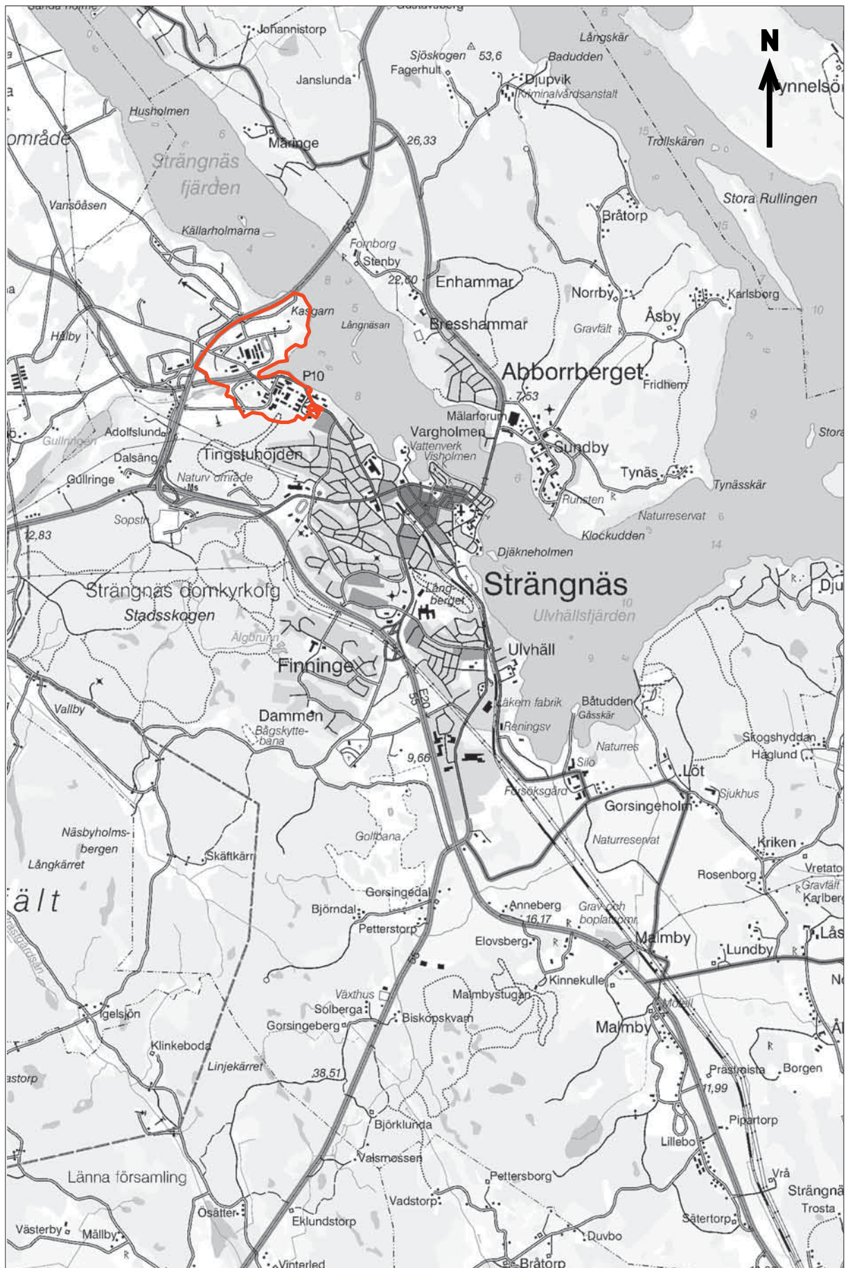
Figur 3. Utdrag ur Gröna kartans blad (GSD) Strängnäs 10H NV med utredningsområdet markerat. Skala 1:50 000.