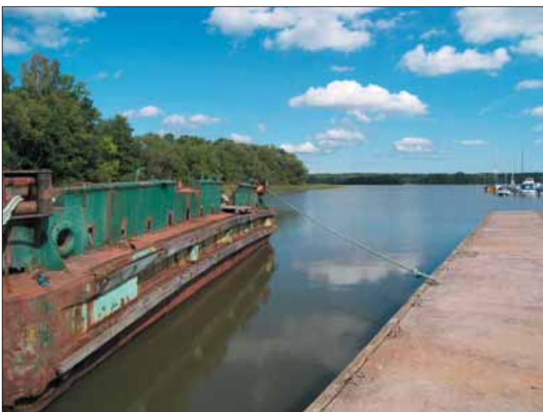
Figur 6. Utsikt mot Mälaren från en brygga i Eldsundsviken. Bilden är tagen från västsydväst.