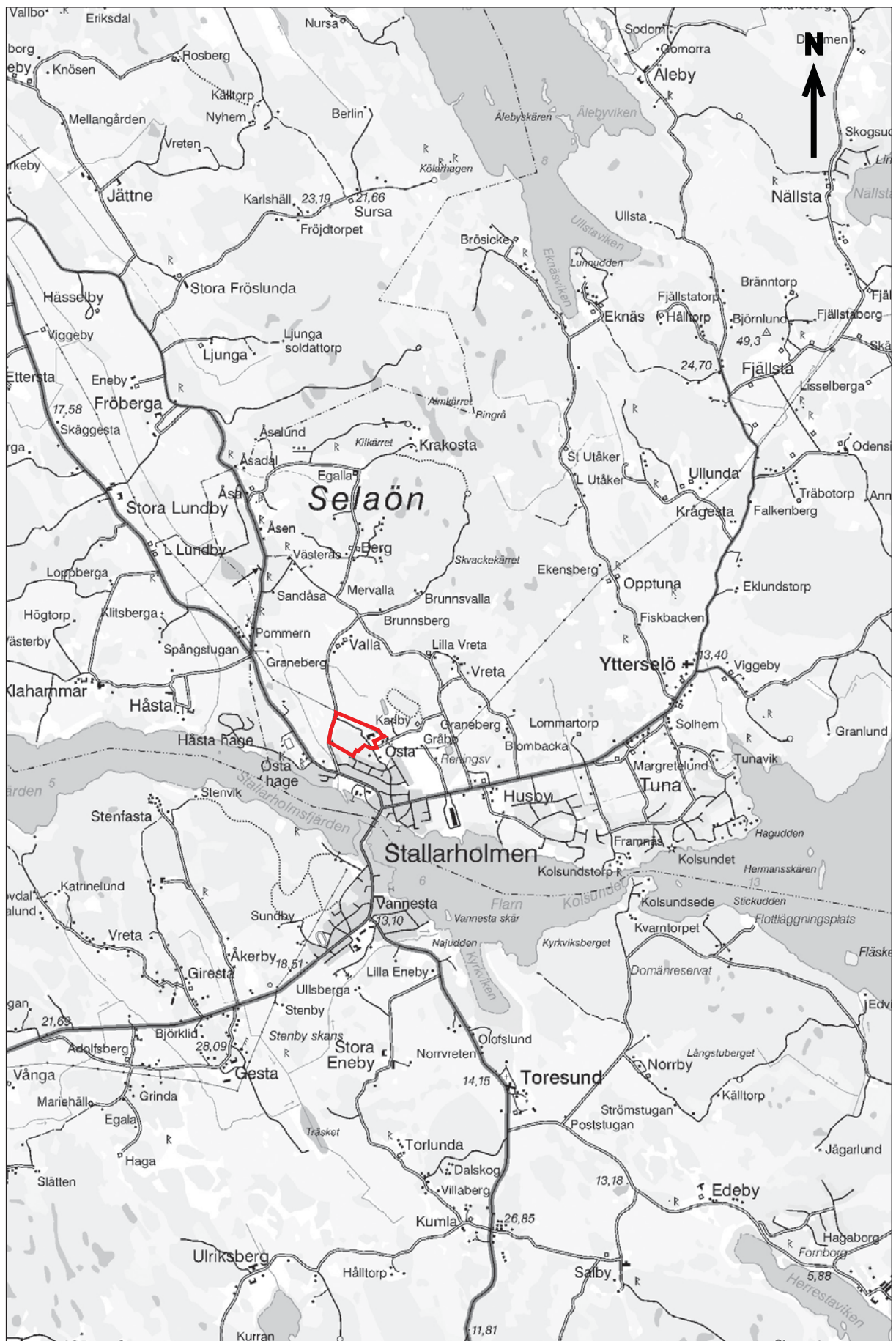
Figur 3. Utdrag ur Gröna kartans blad (GSD) Strängnäs 10H NO med utredningsområdet markerat. Skala 1:50 000.