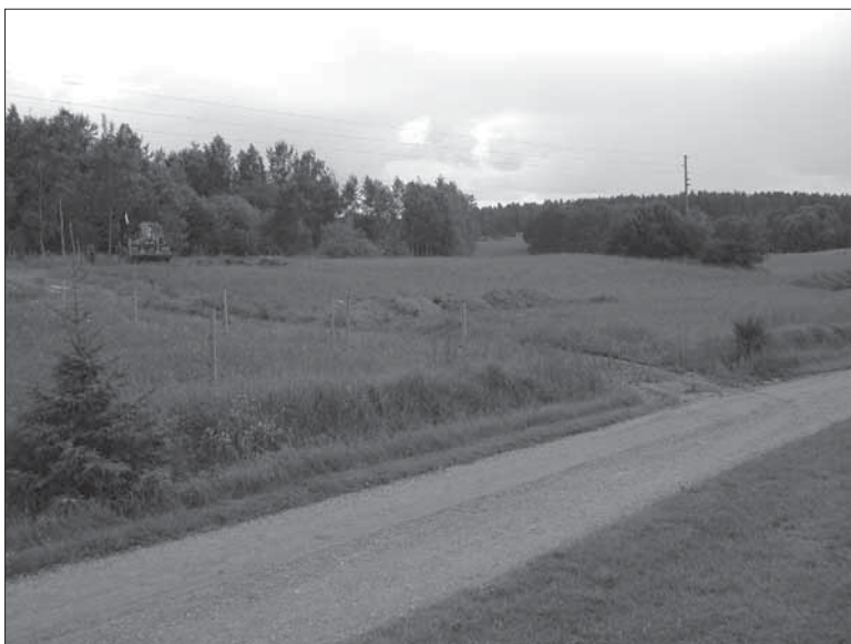
Figur 4. Vy mot sydväst över objekt 1 under schaktningsarbetet.

Objekt 3. Väg. (X6584336,93 Y1579401,40). En mindre övergiven bruksväg påträffades i zonen mellan skog och åker i den centrala delen av utredningsområdet Vägen var belägen cirka 40 meter norr om Ytterselö 151:1 i öst-västlig riktning. Den utgjordes av en väg-