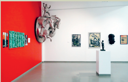
Ebelingmuseet Eskilstunavägen 5, Torshälla ebelingmuseet.eskilstuna.se

På Ebelingmuseet visas verk ur samlingen med konstnärerna Allan, Marianne och Harriet Ebeling samt Foto Bäckstrand-arkivet. Museet har även två rum för tillfälliga utställningar samt verkstad för skapande verksamhet.