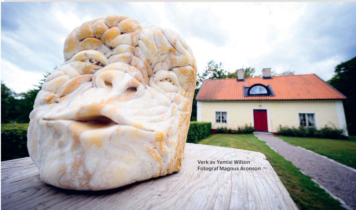
Verk av Yemisi Wilson

I skulpturparken finns närmare 40 skulpturer inom temat Tro, hopp och kärlek. En plats där konst och kyrka möts.