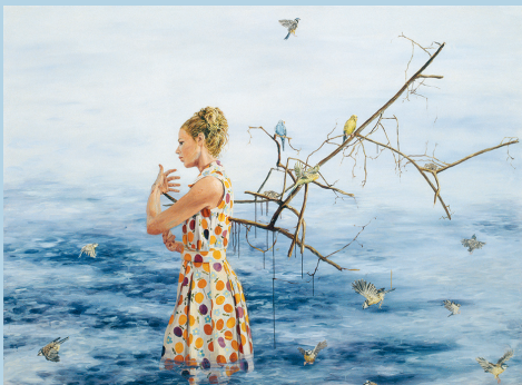
"Ängeln" av Linn Fernström