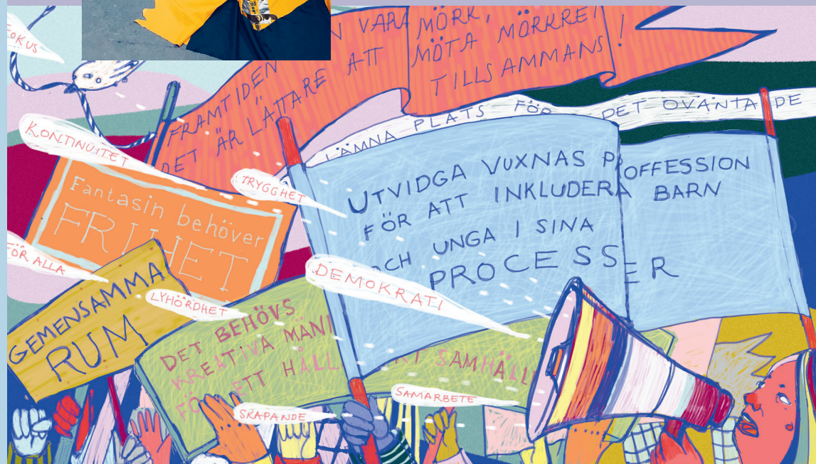
Illustration: Maria Safranova Wahlström

I höst är det åter dags för Kurioso - Sörmlands egen konstbiennal för barn och unga! Det blir utställningar och workshops på museer, konsthallar och oväntade ställen. För mer information: www.kurioso.se