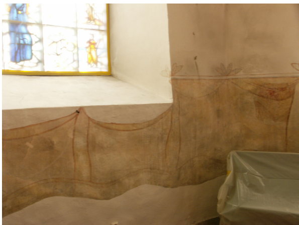
I koret löper en drapering som också var smutsig.

Putslagning och kompletterande målning på rengjorda men extra smutsiga ytor gjordes först i de båda koren. Därmed kunde stenkonservatorerna börja sitt arbete med gravhällarna i golven och målerikonservatorerna med målade ytor som altaruppsats och predikstol.