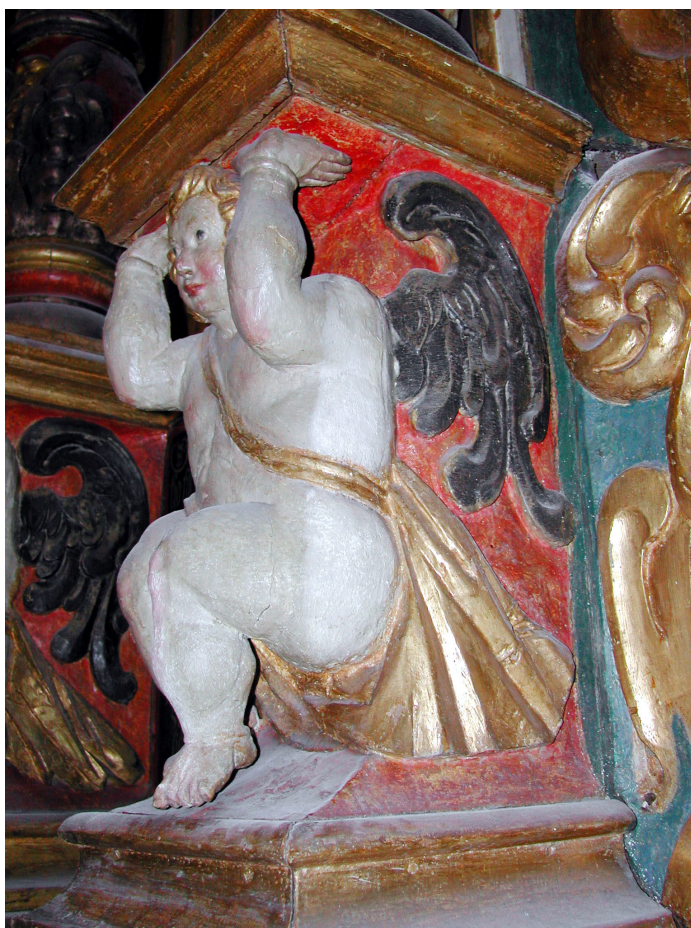
Påbörjad rengöring som ger gott resultat på de nedre figurerna i altaruppsatsen.