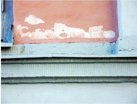
På den östra sidan av Ångakoret har det nya färgskiktet med kalklimfärg från 2005 börjat flaga i januari 2006.