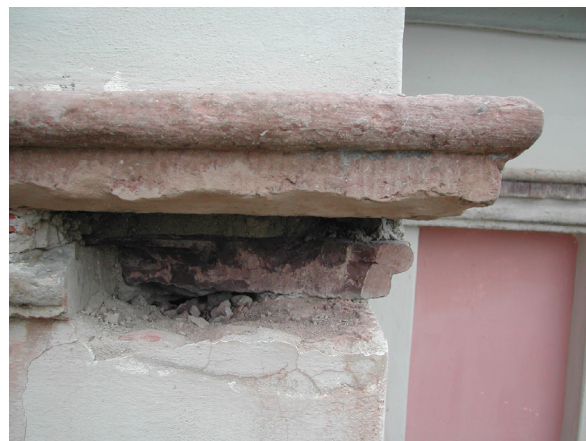
På den övre listan var ett av hörnen kraftigt eroderat. Här syns lågerhuggning/refflor i stenen och profilerna. Sammanlagt lagades fyra hörn.

Kalkstenslisterna, en övre och en undre horisontal list på gravkoret på den södra sidan av kyrkan, var hårt eroderade och skadade av väder och vind. Flisor av materialet var lösa i vissa avsnitt och mycket material var bortnött. Stenkonserverator tillkallades.