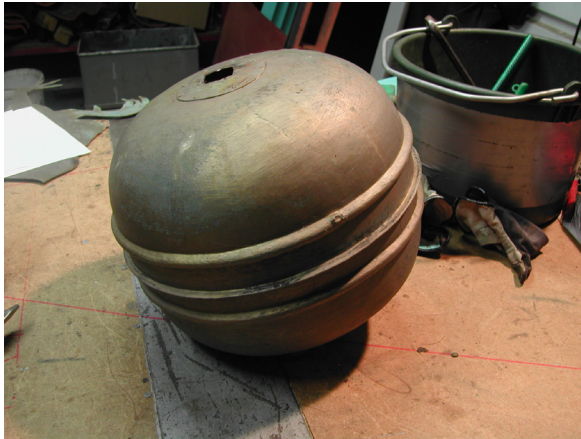
Klotet under tuppen från 1947 är av tunnare gods, ca 0,7 mm. Diameter 0,35 m. Innerhöjd 0,32. Det har liknande utformning som klotet under gravkorets kors.