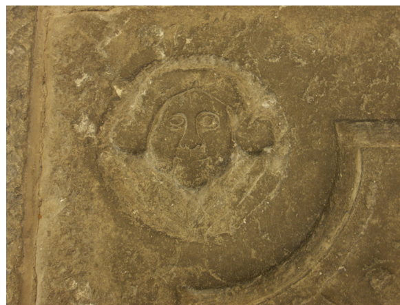
Ansiktet på gravhällen har fästs tillbaka av stenkonservator.