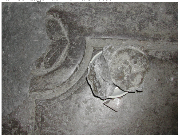
Stenkonsivering av gravhällar lagda på korens golv innebar t ex att fästa tillbaka ett ansikte på en sten.

Slutbesiktning av de inre åtgärderna gjordes separat för att kyrkan skulle kunna återöppnas med en mäsas på Palmsöndagen den 20 mars 2005.