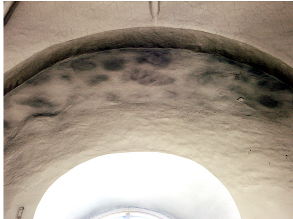
Väggpartierna ovanför fönstren var hårt nedsmutsade.

Wishab använts, vilket ger en god effekt på nersmutsade, sotiga kalkputsytor. Det blir rent men ytorna slits inte ner.