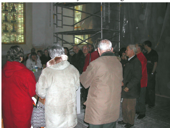
Besökarna medverkade med sina minnen om hur kyrkan har sett ut vid olika tider. Ett bildspel visades om hur rengöring och konserveringen görs.