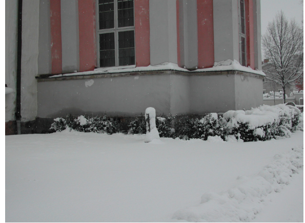
Snö och fukt samlas på den vinkelräta listen mot sockeln på gravkoret. Foto vintern 2004/2005.