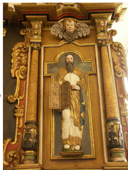
Moses till vänster om Jesus