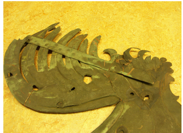
Detalj av den formade plåten. Hålen i plåten ser onekligen ut som skotthål. Måtten på kvarvarande del av tuppen är 0,55 m bred och 0,50 hög.