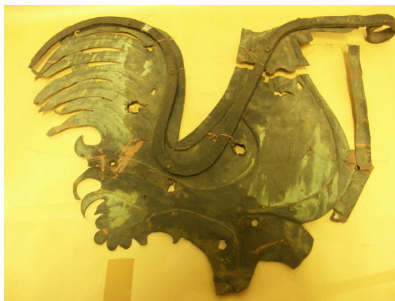
Detta är baksidan/insidan av samma tupp. Kan tuppen ha varit tredimensionell? Den kanske var sammanfogad av två plåtar.