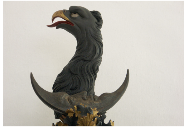
Detalj av det Tungelska anvapnet. En halvmåne av silver vilar på en krona. Överst tronar ett örnhuvud.