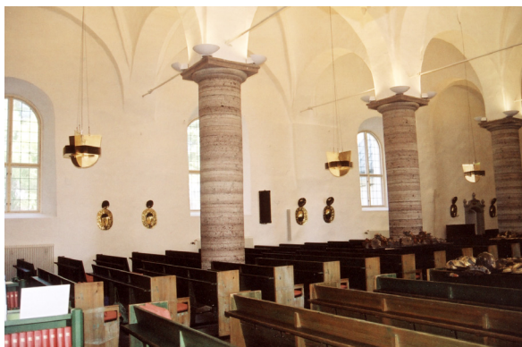
Den norra väggen med lampetter men utan anvapen längre fram i koret. Till höger har de hängts tillbaka.