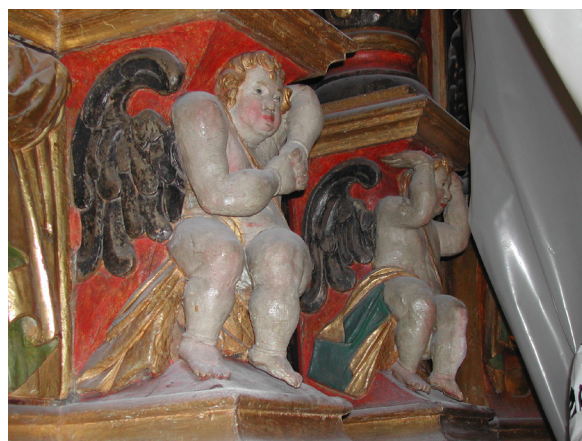
Altaruppsatsen var dammig och smutsig.