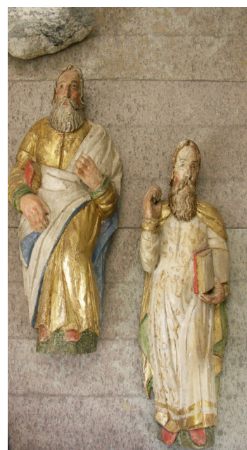
Några av altaruppsatsens figurer kunde plockas ner för rengöring och konservering i ateljé.