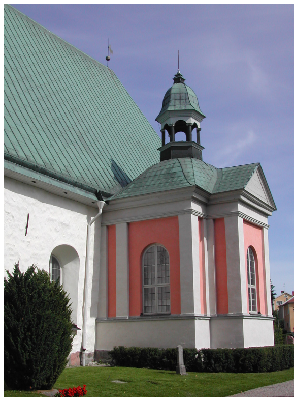
Angakoret/Tungelska gravkoret efter 2005 års underhållsätgärder. Förgyllt kors och klot saknas här.