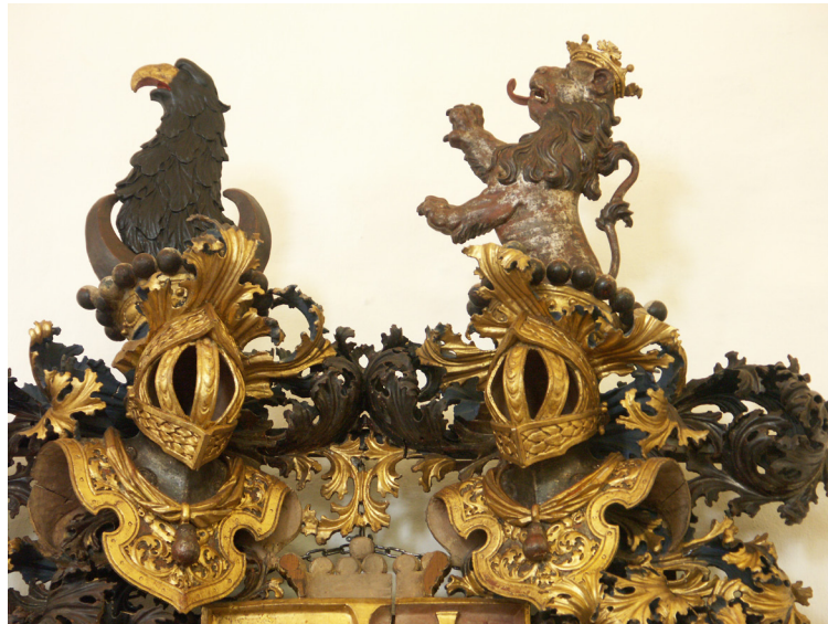
Detalj av övre delen av friherre Gustav Tungels anvapen, som hänger i långhuset på den norra väggen. Två hjälmar visar på friherretitel. Det uppresta lejonet är av silver.