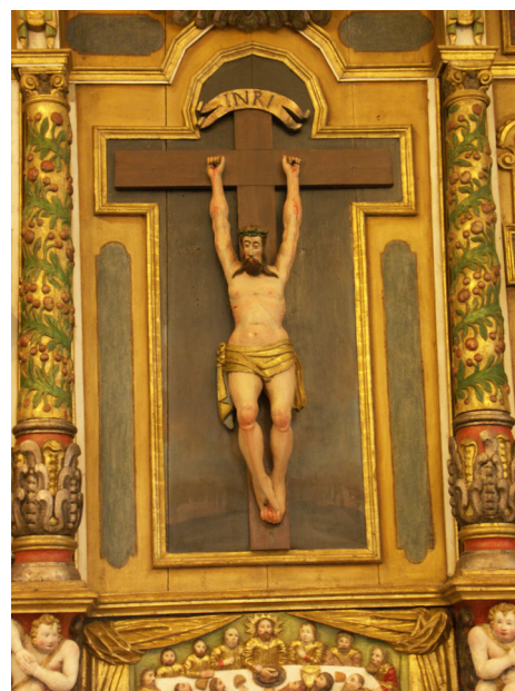
Kristus på korset i mittfältet på Alla Helgona altarpupsats.

Någon godtagbar förklaring till den framställningen har inte lämnats av tillfrågade eller i litteratur i ämnet.