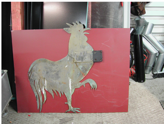
1947 års tupp med måtten 0,89 m hög och 0,75 bred. Sprickan syns under fästplåtarna till stängen.

Hur som helst, den äldsta arkiverade tuppen har en fin relief i plåten och har dessutom några skotthål som sägs komma från 1719 när ryssarna var här och uppmanade någon att skjuta och träffa tuppen för att få behålla kyrkan orörd! Det lyckades - tydligen!