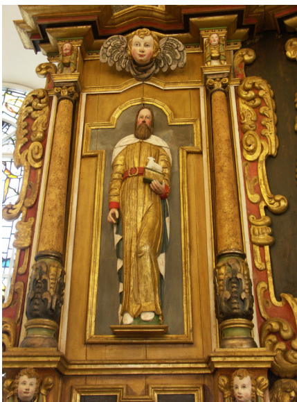
Johannes döparen är placerad på Jesu högra sida.