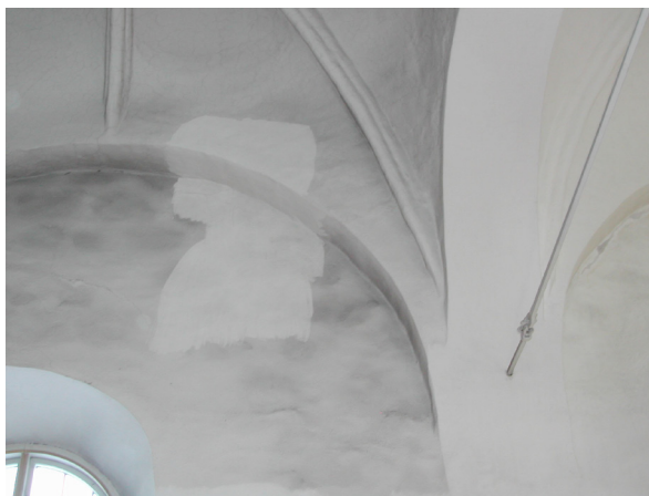
Skillnad syns mellan rengjort och smutsigt parti.