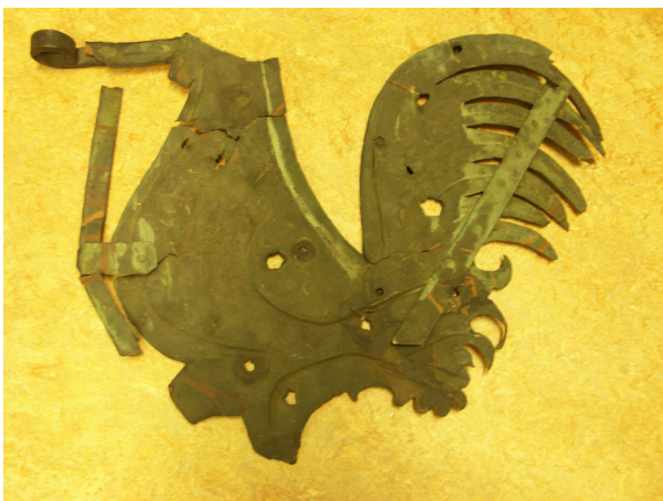
Detta är framsidan av en huvudlös tupp, som förvaras i kyrkans arkiv. Plåten är tunn och formad med reliefer.

7) På en kopia av den uppmättningsritning som finns över Alla Helgona kyrka från 1928 har inte museet kunnat se om det är en tupp eller vimpel som sitter uppe. En granskning av originalritning bör göras på Riksantikvarieämbetets arkiv ATA.