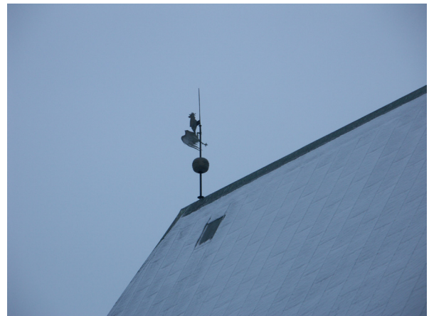
Kyrktuppen på den östra taknocken har spruckit.

I avvaktan på förgyllning av den nya tuppen och det gamla klotet har Sörmlands museum gjort efterforsk-