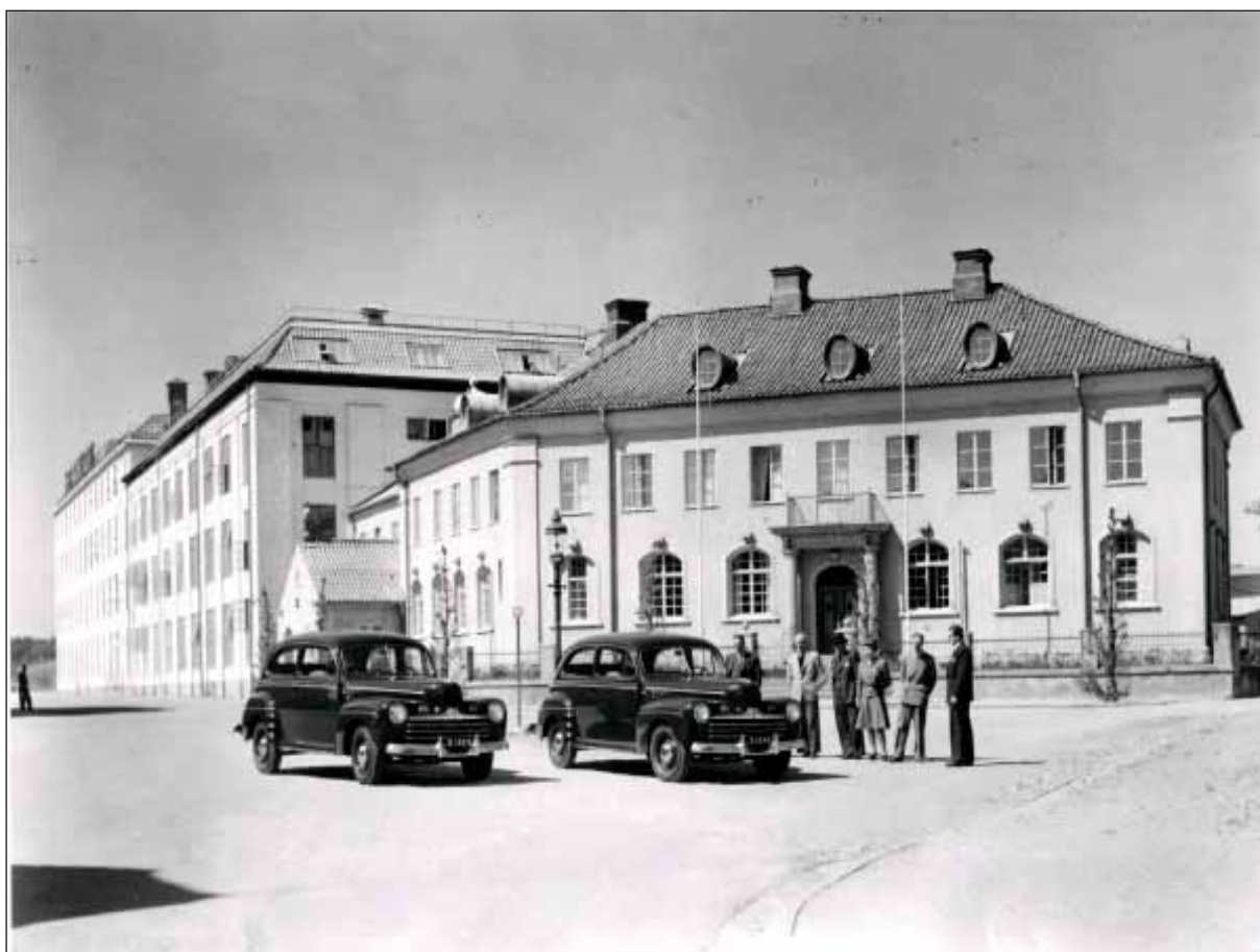
16. Äldre fotografi av kontorsbyggnaden, lägg märke till byggnadens ursprungliga tak med små runda takfönster.

Byggnadskomplexet har under årens lopp ändrats och byggts om vid ett flertal tillfällen. Nya byggnader har tillkommit och andra har förändrats och rivits. I följande