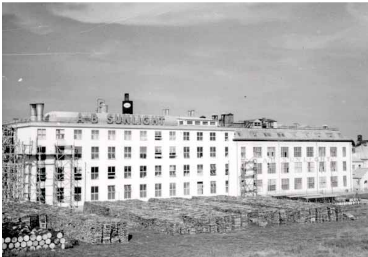
22. Äldre fotografi av Sunlight, någon gång på 1950-talet, hus 3B och 3A. Fotografiet är troligen tagit vid uppbyggnaden av 3C.