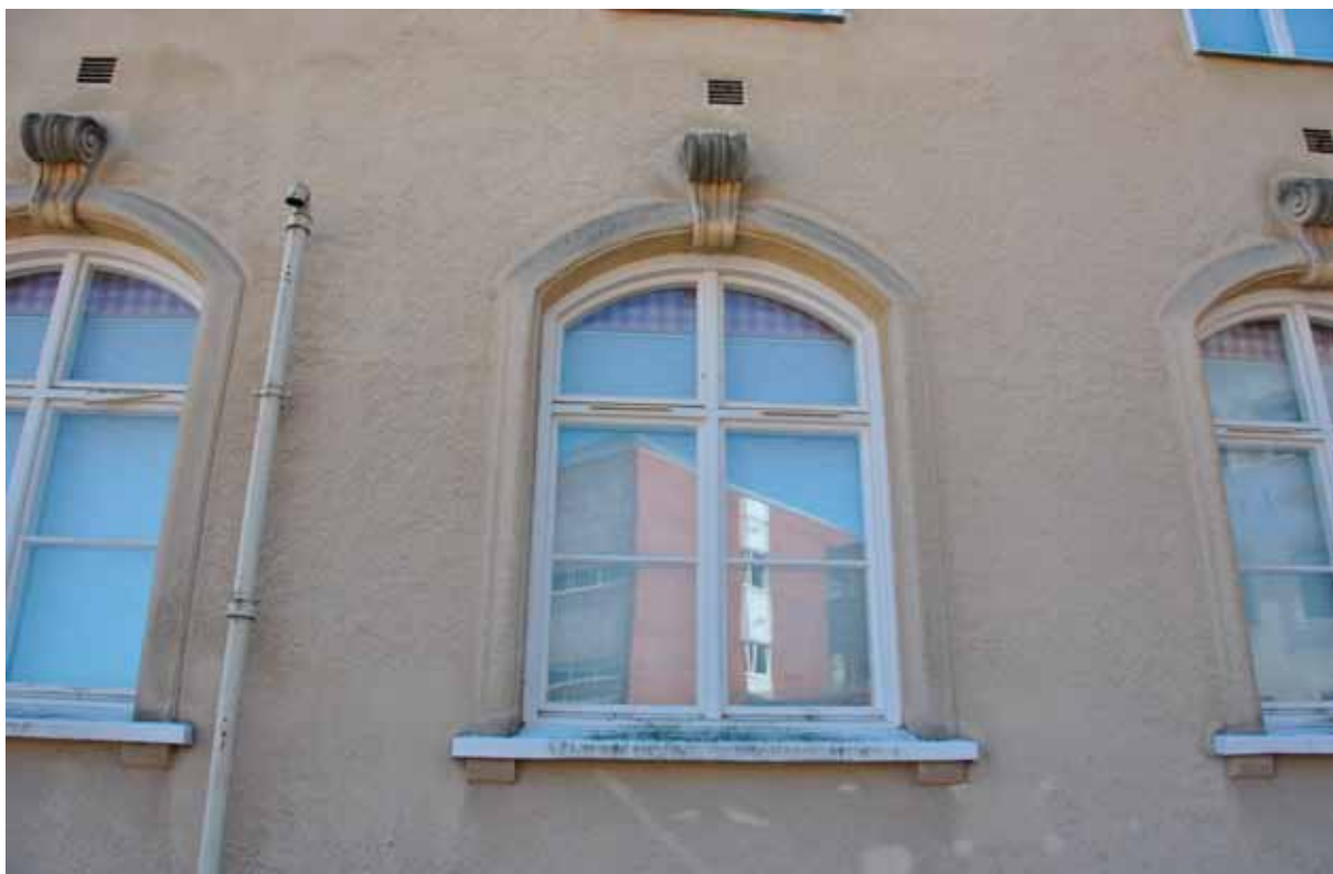
21. Detalj av bottenvåningens fönster på kontorsbyggnaden. (SLM 2015-991)