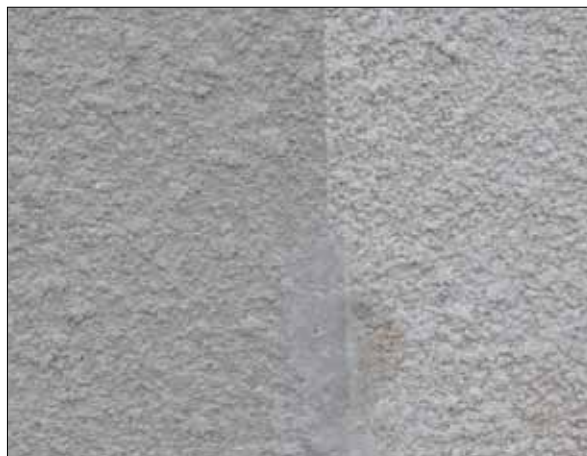
15. Detalj av fasaden på byggnad 3B. Fasaden har ädelputs med glimmer i. (SLM 2015-986)