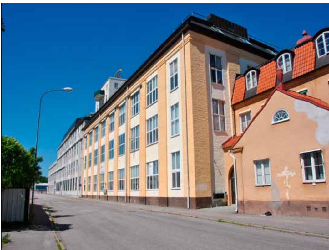
3. Sunlights långsträckt byggnadsvolymen sedd från Industrigatan. Längst till vänster i bild fabriksbyggnad 3C, därefter 3B och närmast 3A och Kontorshuset 1. Här tillverkades två produkter under åren 1925- 1992. (SLM 2015-974)

Fabriksbyggnaderna som helhet utgörs av en långsgående byggnadsvolym längs med Industrigatan. Byggnadens äldsta del utgörs av byggnad 1, ursprungligen kontorshus om två våningar med inredd vind. Byggnadskroppen är uppförd i vinkel med symmetrisk fönstersättning och mittcentrerad portik med doriska kolonner och pardörr i massivt trä. Pardörren markeras av bågformat överljus och ovanpåliggande balkong med smideräcke. Portalen bevarar inskriptionen ”Aktiebolaget Sunligh”. Även gaveln har ett mittcentrerat entréparti. Fönstren i bottenvåningen artikuleras av profilerade omfattningar med dekorativa voluter. Hörnen markeras genom hörn-