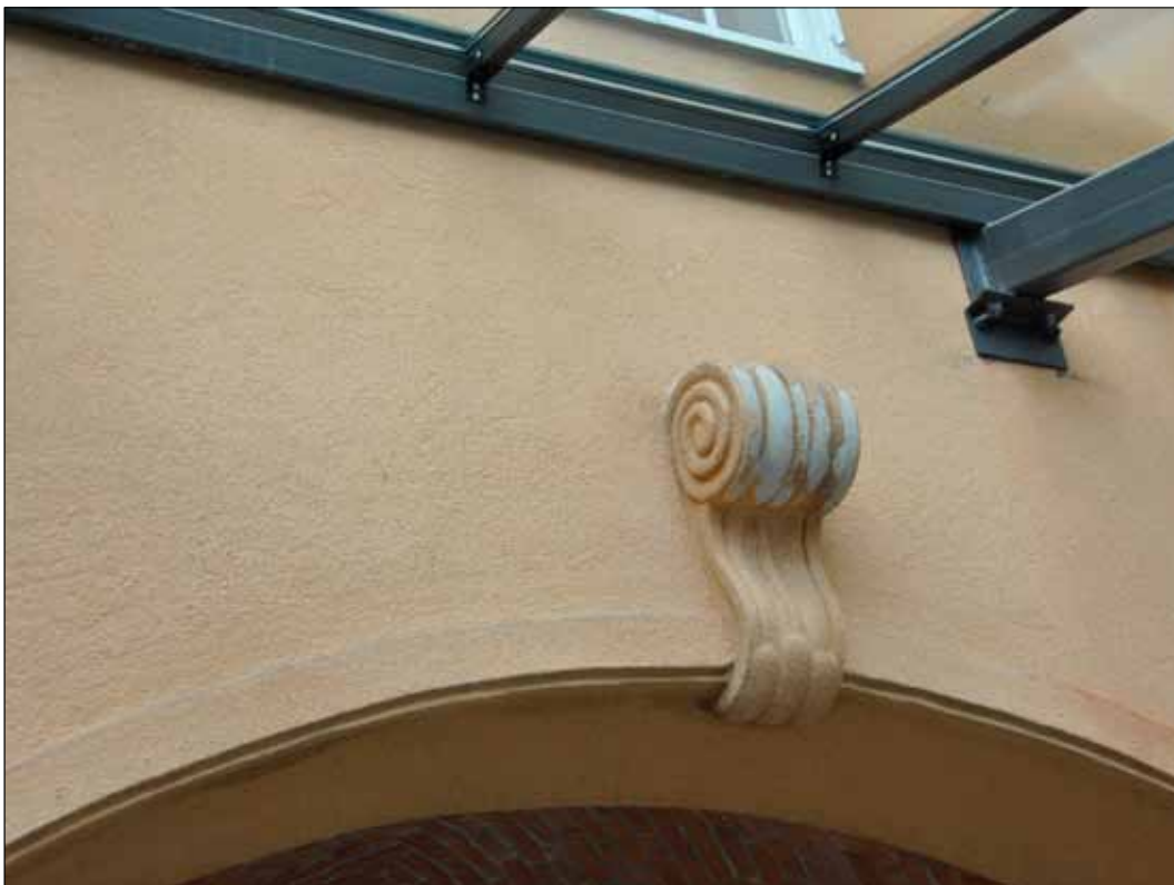
8. Dekorativ utsmyckning i form av volut, placerad vid valvbågens slutsten. Bakom sprutputsens framträder en slätputsad yta. (SLM 2015-979)