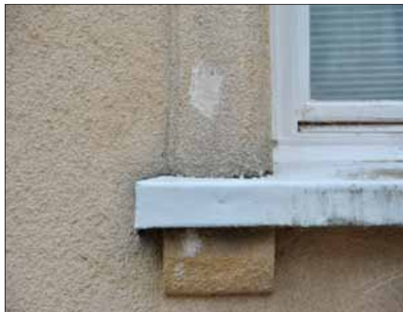
13. Detalj av fönsteromfattning på hus 1. (SLM 2015-984)