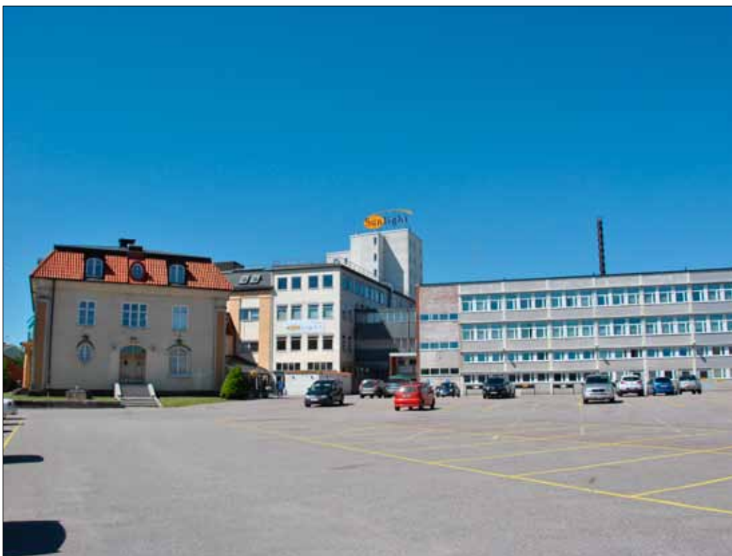
4. Byggnadskomplexet sett från Nytorget. Till höger i bild byggnadskropp 4. (SLM 2015-975)

Byggnad 3B, den första stora tillbyggnaden uppfördes i slutet av 1930-talet, i funktionalistisk stil. Fasaden är symmetriskt uppbyggd med jämn fönstersättning och betonas vertikalt genom färgsättningen. Fasaden har ädelputs med glimmer i två gråa nyanser. Vertikaliteten är synlig på långt håll och en viktig del av arkitekturen. På äldre bilder kan man också se att byggnadskroppen haft en neonskylt på taket mot Industrigatan. Trots utbytta fönster bevarar fasaden mycket av sin ursprungliga karaktär. Byggnaden är sammanlänkad med byggnad 3C som tillbyggdes under 1950-talet om tre våningar med jämn fönstersättning och vertikal indelning med lisener. Genom indelningen med lisener, får man intrycket av att arkitekten mycket medvetet har haft en önskan om att byggnadskroppen skall samspela med ursprungligt kontorshus i fråga om volym och ursprunglig fabriksbyggnad i fråga om arkitektoniskt uttryck. Trots utbytta fönster bevarar huset sin ursprungliga karaktär. Byggnad 4 om fyra våningar har inte arkivsökts. Gavlarna har bevarat rött fasadtegel och övrig tegelfasad är målad vit. Fönstersättningen består av långa fönster band.