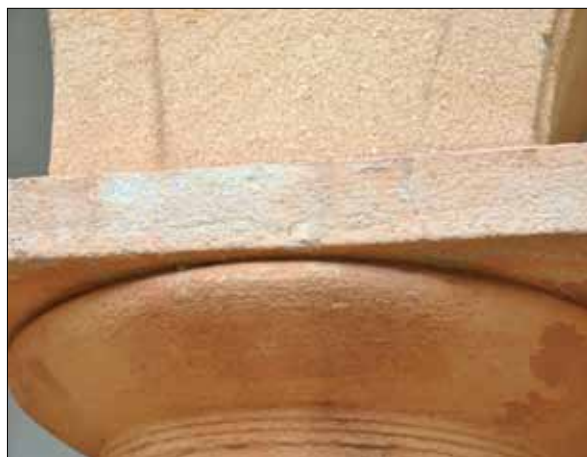
14. Detalj av kolonnens kapital i arkaden, hus 1. Vid skrapning framträder en ljusare putsad yta. (SLM 2015-985)