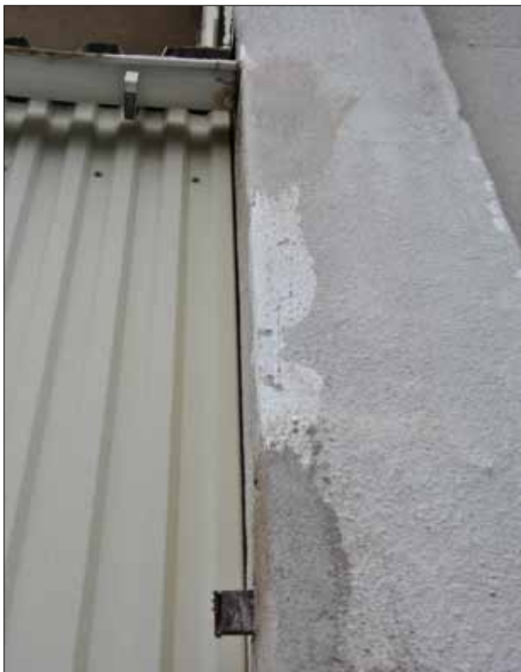
11. Vid skrapning framträder den ursprungliga vita ädelputsen, tydligt under senare putslager. Detalj av pilaster på byggnad 3C. (SLM 2015-982)