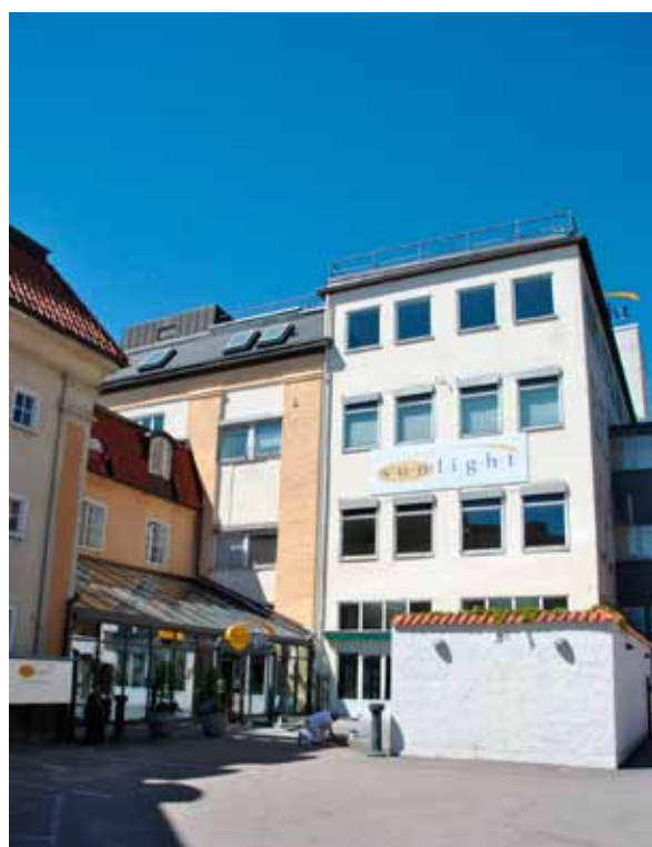
19. Innanför den glasade tillbyggnaden nås entrén till hotellet. (SLM 2015-989)