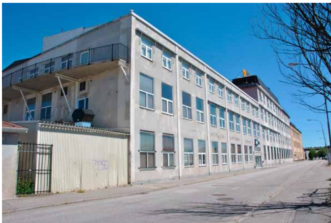
17. Närmast i bild byggnadskropp 3C, vilken uppfördes på 1950-talet efter ritningar av arkitektfirman Havstad, Hollström, Lindell. (SLM 2015-987)