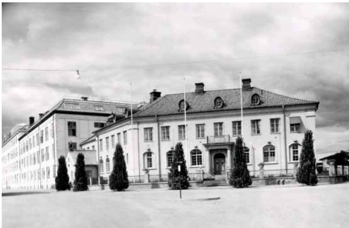
23. Äldre fotografi av kontorsbyggnaden. Sörmlands museums arkiv SLM A30-229