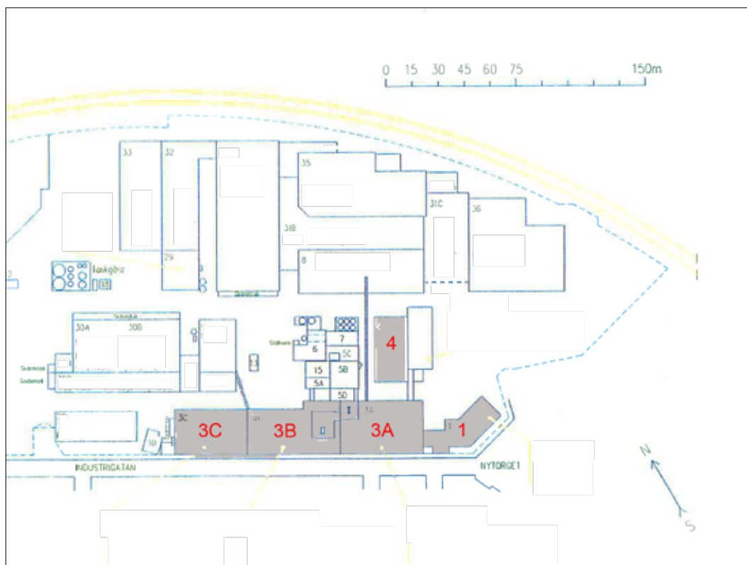
2. Situationsplan över Sunlight.