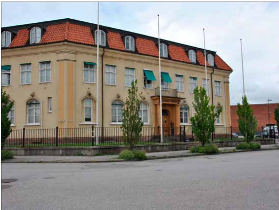
5. Den ursprungliga kontorsbyggnaden, hus 1 har i stora drag bevarat sin ursprungliga karaktär i 1920-tals klassicism. (SLM 2015-976)