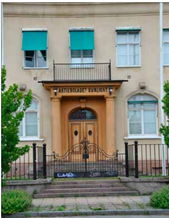
12. Detalj av den ursprungliga huvudentrén till kontorsbyggnaden, hus 1. (SLM 2015-983)