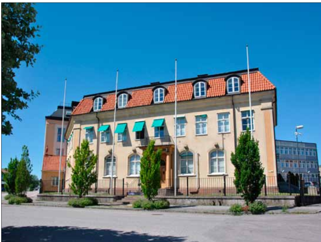
6. Byggnad 1, fasad mot söder 2015. (SLM 2015-977)