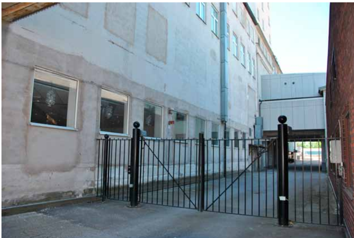
20. Baksidan av byggnad 3A. (SLM 2015-990)