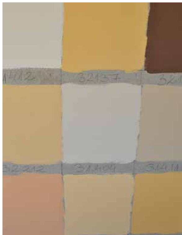
18. Detalj av olika färgsättningsförslag, framtaget av entreprenaden, för hus 1 och 3A. (SLM 2015-988)

Byggnadskomplexet har genom sin omsorgsfullt utformade byggnadsdetaljer och genomtänkta tillbyggnader med gemensamma formspråk stora arkitektoniska värden. Kontorshuset (hus 1) och den ursprungliga fabriksbyggnaden (hus 3A) är konstruerade av den välkända konstruktören Henrik Kreüger. Vidare är anläggningen ett betydande riktmärke med stort symbolvärde för Nyköping.