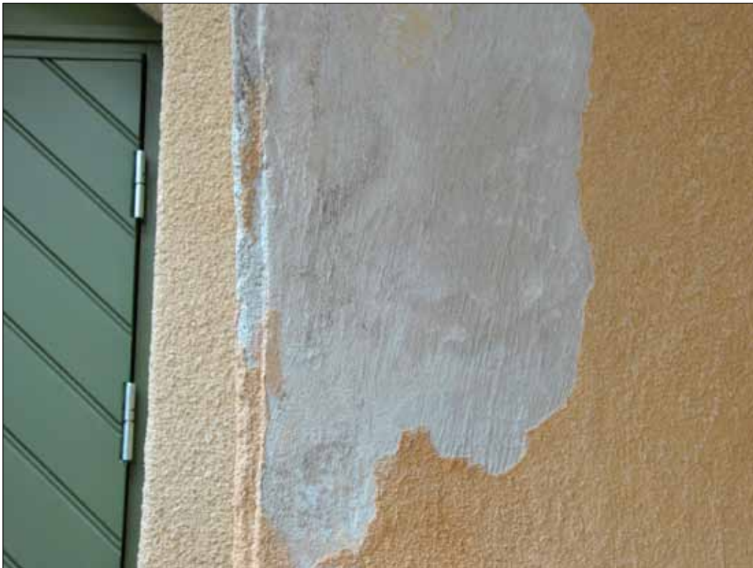
7. Detalj av portiken på hus 1, där tidigare släta och ljusare putslager är synliga. (SLM 2015-978)