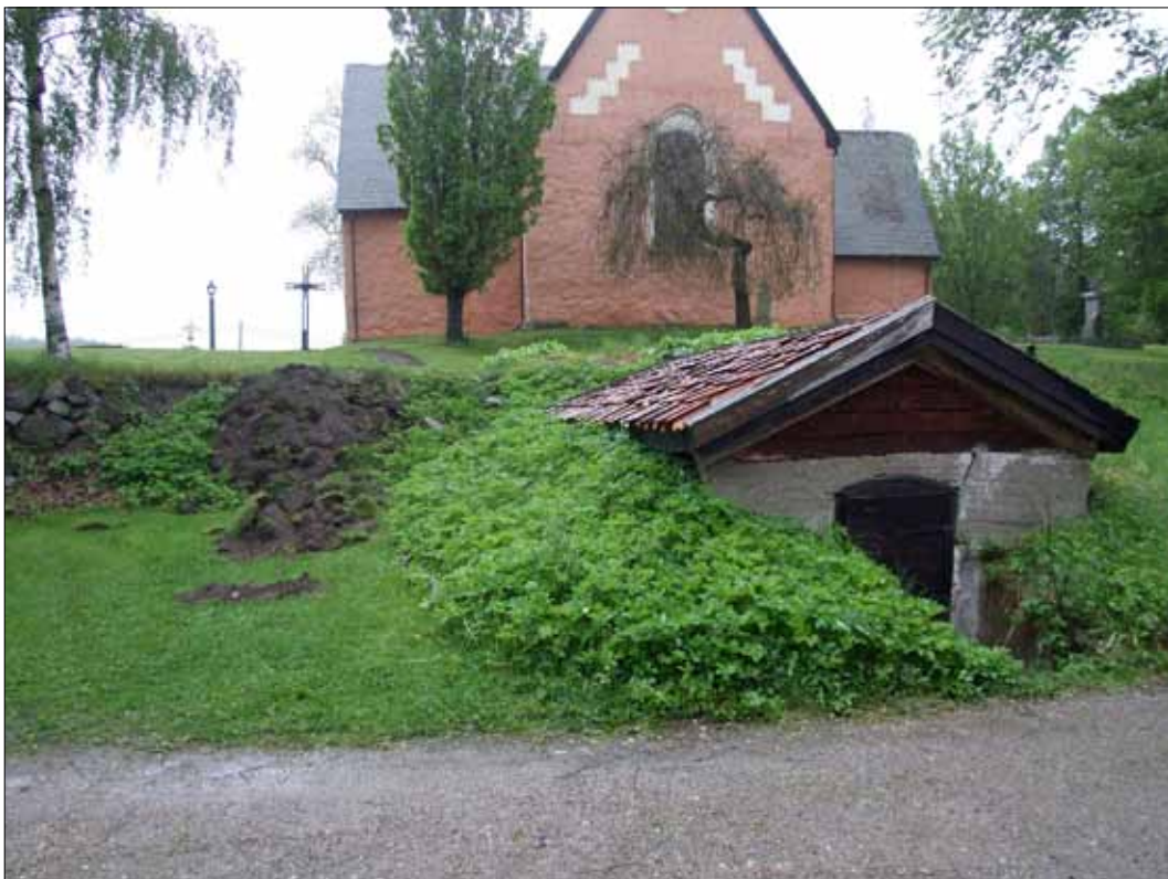
5 Aktuellt parti av kyrkogårdsmuren före anläggandet av den nya trappan (Slm D11-261).