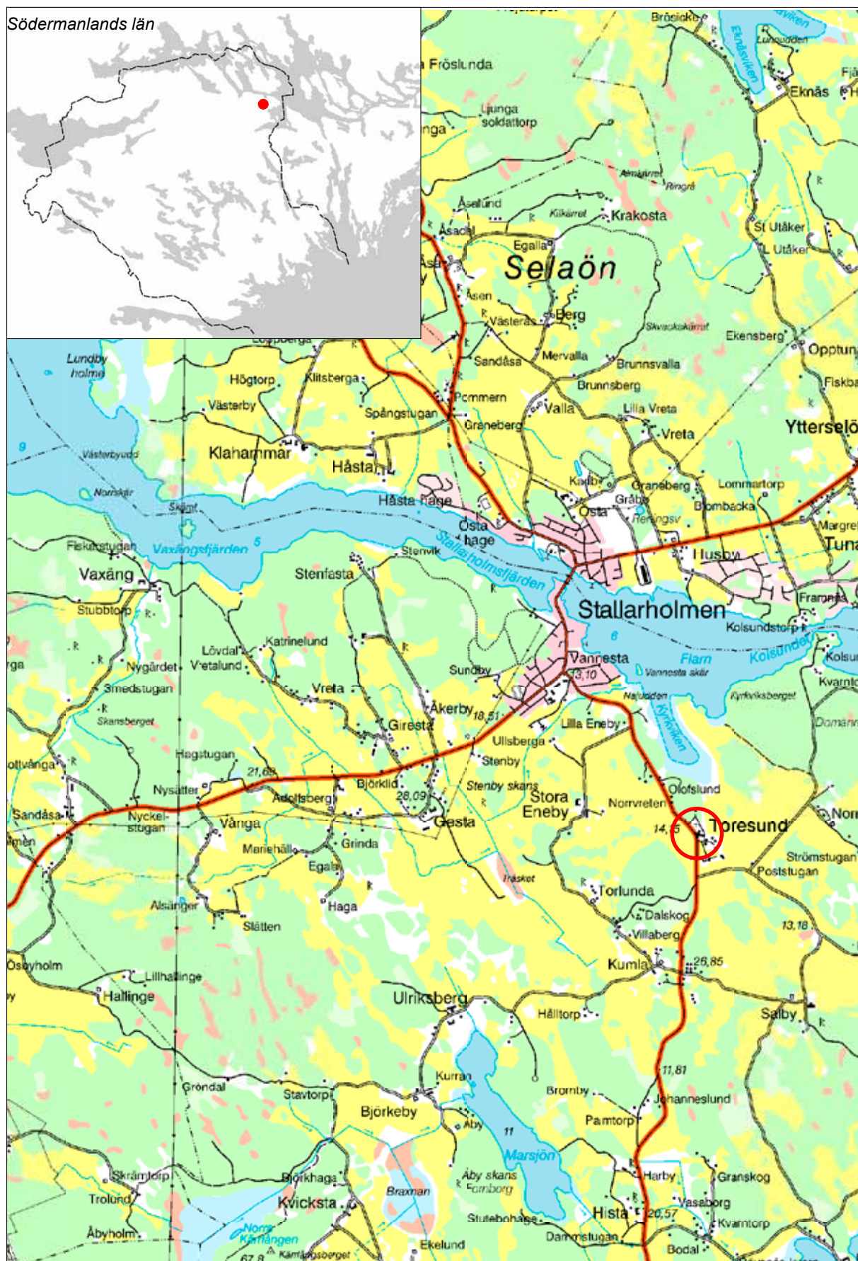
1 Utdrag ur Gröna kartans blad (GSD) Strängnäs 10H NV & 10H NO med Toresunds kyrka markerad. Skala 1:50 000.