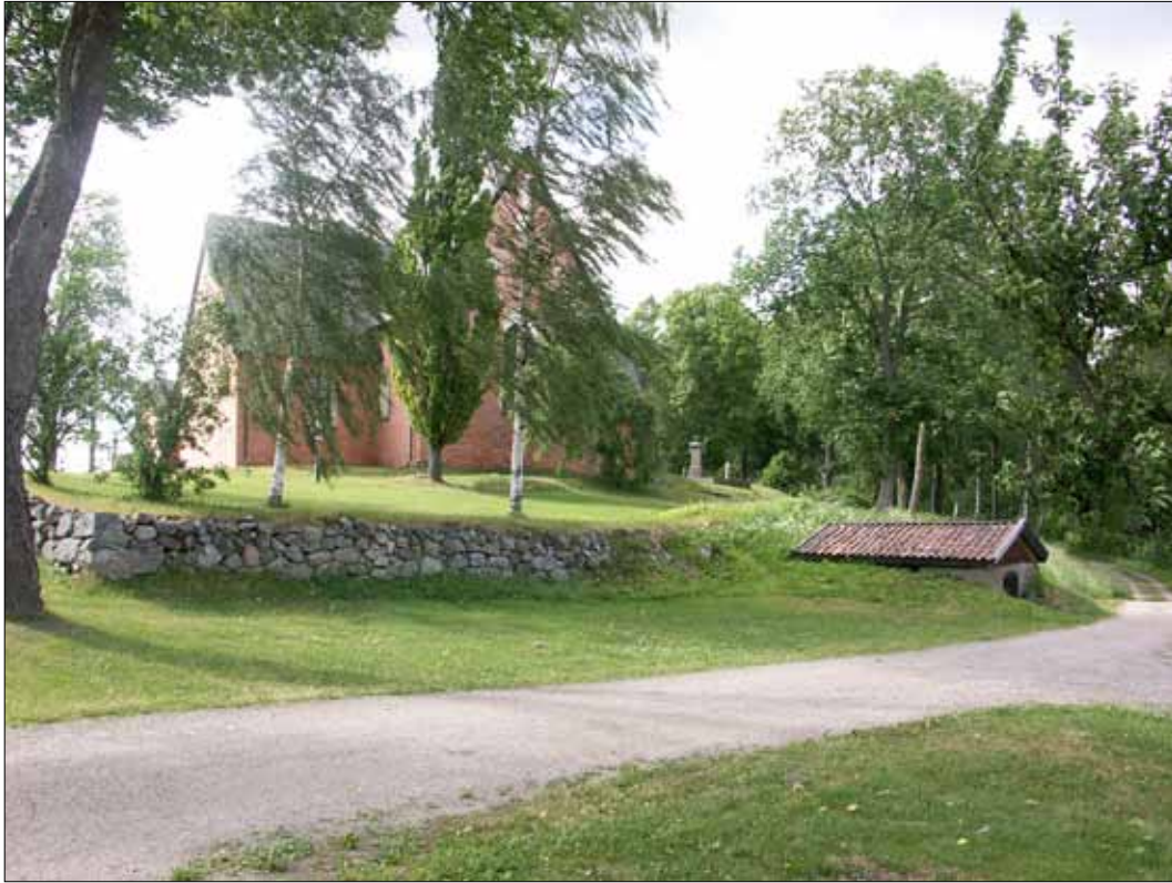
4 Kyrkogårdsmurens sydöstra del före påbörjade arbeten. (Slm D11-260).