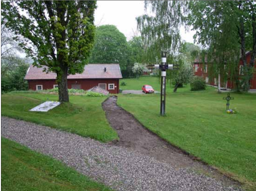
6 Läget för den nya grusgången efter utförd schaktning (Slm D11-262).