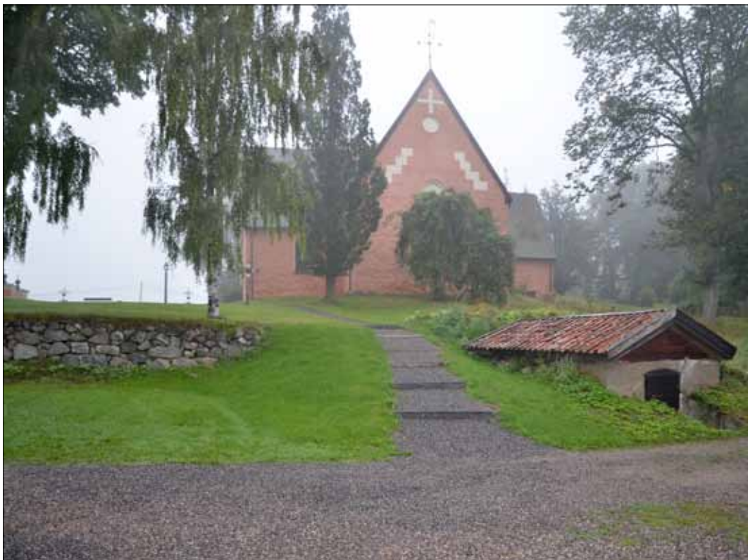
7 Den nya trappan och grusgången efter avslutade arbeten (Slm D11-263).